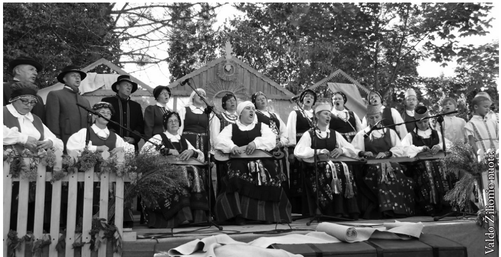
Skriaudžių etnografinis ansamblis „Kanklės“