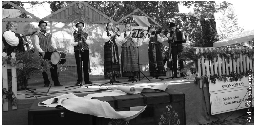
Lenkijos lietuvių etninės kultūros draugijos kapela „Šalčinukas“