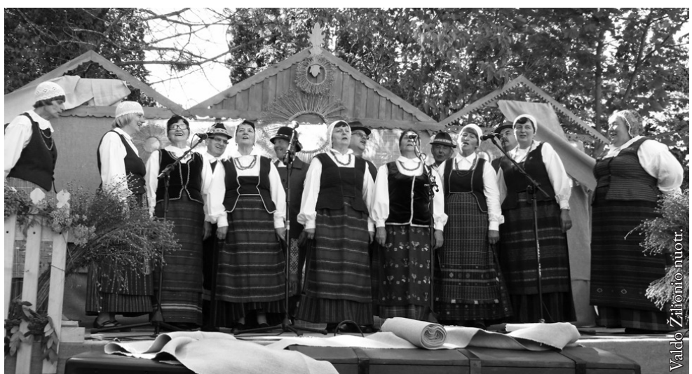
Lenkijos lietuvių etninės kultūros draugijos etnografinis ansamblis „Gimtinė“