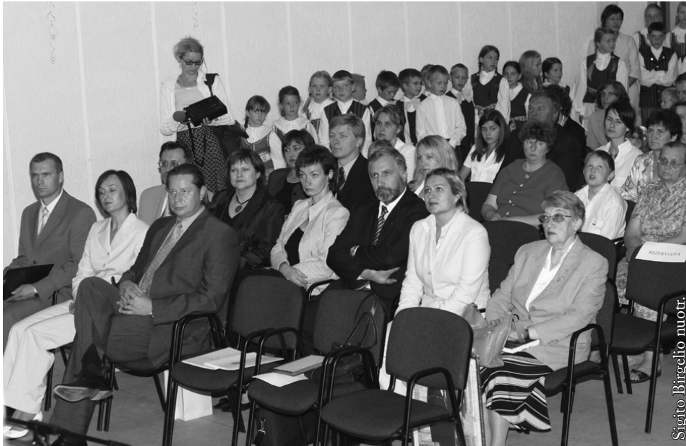
2005-09-01 d. Seinų „Lietuvių namuose“ pradėjo veikti lietuviška mokykla

dar didesne inercija. Reikėjo padėti lietuvių bendruomenei, kad jos lyderiai ir aktyvesni nariai vis geriau gebėtų stiprinti lygiavertį dialogą su savo kaimynais, mokėtų savo argumentus pristatyti ne vien besiremdami istorinėmis nuoskaudomis, bet taip pat juos perkeltų į kultūros, sporto, jaunimo ugdymo plotmę, ne tik matytų praeitį, bet mokėtų projektuoti ateitį. Todėl Seinuose iškilo paminklas ne tik katalikų vyskupui, bet ir lietuvių poetui Antanui Baranauskui, buvo pastatyti „Lietuvių namai“ ir galiausiai „Žiburio“ mokykla. Prisimenu, kad kiekvienu atveju buvo abejojančiųjų, ar šios institucijos dar labiau nepakenks lietuvių ir lenkų santykiams, ar netaps nuolatinių konfliktų vieta. Nieko panašaus neįvyko.