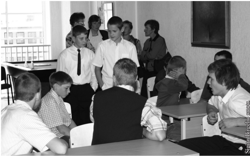
Pirmieji „Žiburio“ mokiniai 2005 m. rugsėjo 1-ąją

į šį prekybos centrą gausiai atvykstantys pirkėjai iš Lietuvos sustiprino lietuvių kalbos girdimumą mieste, ir ji tapo natūraliai priimtina. Nei vienos kalbinės grupės interesai nuo to juk nenukentėjo, jokie pavojaus tautinio tapatumo išsaugojimui nematyti, o atsirado daugiau supratimo ir bandymo kiek įmanoma pasinaudoti draugiškos kaimynystės teikiamais privalumais.