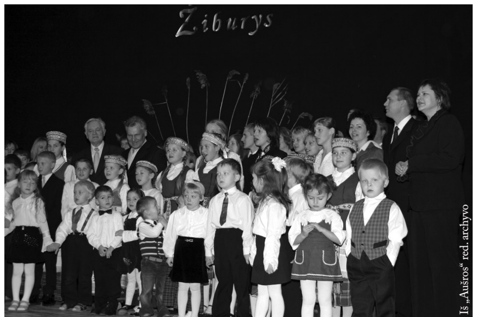
2005-11-05 d. Seinų lietuviškai mokyklai „Žiburio“ vardo suteikimas. Dalyvauja Lietuvos ir Lenkijos prezidentai V. Adamkus ir A. Kvasnevskis

imtis iniciatyvos ir pastatyti Seinų lietuviams lietuvišką mokyklą. Seinų lietuviai jos neturėjo nuo 1920 metų. Jau nedaug jų beliko, nebuvo ir nėra pavojaus, kad netikėtai pradės dominuoti Seinų kalbinėje ar kultūrinėje plotmėje, apie ką kartais užsimena kai kurie vietiniai patriotai. Sprendimas pastatyti mokyklą būtų turėjęs didžiulę simbolinę reikšmę. Žinoma, tą klaidą dar galima būtų šiek tiek atitaisyti, skiriant pakankamą finansinę paramą „Žiburio“ darbui užtikrinti. Vertėtų tai padaryti įvertinant tą 10-ies metų veiklą ir naudą abiem bendruomenėms. Juk ne viską galima taip paprastai pamatuoti ir suvokti, kokie procesai vyksta visuomenėje, kas labiausiai paveikia jos nuotaikas. Neseniai teko bendrauti su Lenkijos mokslininke, kuri domisi šalies lietuvių gyvenimu, ypač jų padėtimi Seinuose. Po ilgos diskusijos, analizuodami ne tik istorinius įvykius, bet ir šiame krašte vykstančius socialinius, kalbinius procesus, priėjome prie beveik bendros išvados, kad „milžinišką“ darbą mažinant kalbinius konfliktus Seinuose atliko ne tik „Žiburio“ mokykla ar „Lietuvių namai“, bet taip pat... prekybos centras „Biedronka“! Būtent