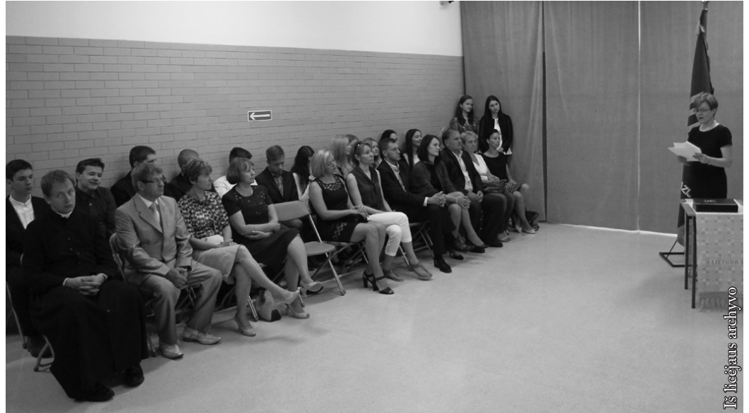
Iš licėjiaus archyvo

dalykų pasirinkimas mokslėiviams kiek didesnis. III a klasė išplėstinu lygmeniu mokosi anglų kalbos ir biologijos, o III b – anglų kalbos ir matematikos. Be to, mokslėiviai privalo pasirinkti vieną dalyką (chemiją arba istoriją).