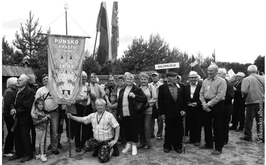
Punsko ir Seinų bitininkai eisenoje