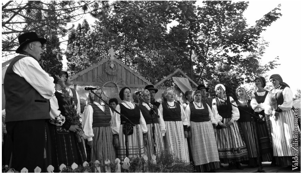
Dovilų folkloro ansamblis „Lažupis“

X tarptautinį folkloro festivalį „Išaudiau drobę“ rėmė Lenkijos administravimo ir skaitmeninimo ministerija.