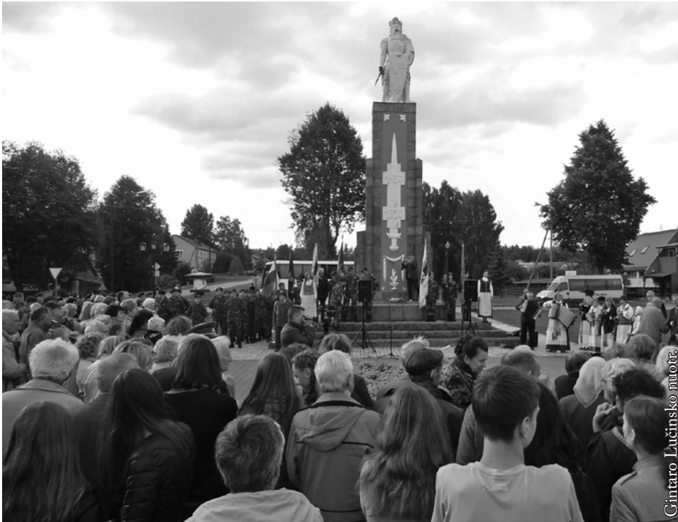
Minėjimas Perlojoje prie paminklo Vytautui Didžiajam

MVD kariuomenės pietų grupės komandoms, buvo duota užduotis atlikti žvalgybą Liškiavos ir Ivanuvkos rajonuose – Varėnos apskrities Druskininkų, Merkinės ir Lazdijų apskrities Leipalingio valsčių sandūroje.