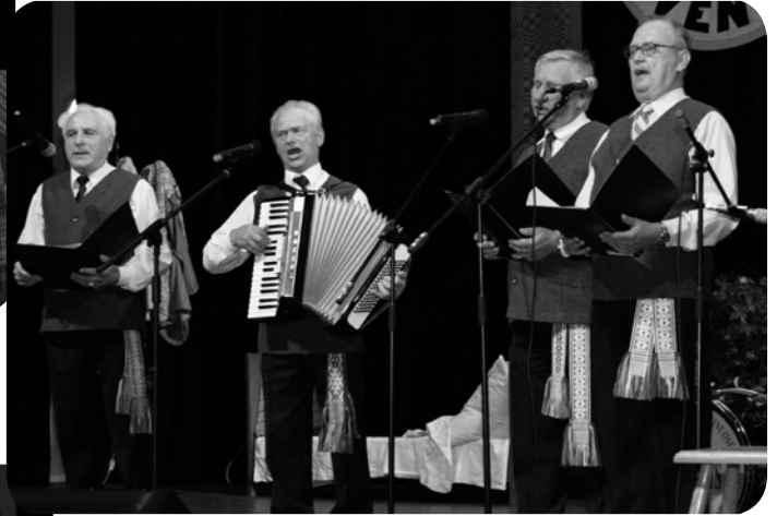
Lietuvių šv. Kazimiero draugijos vyrų kvartetas