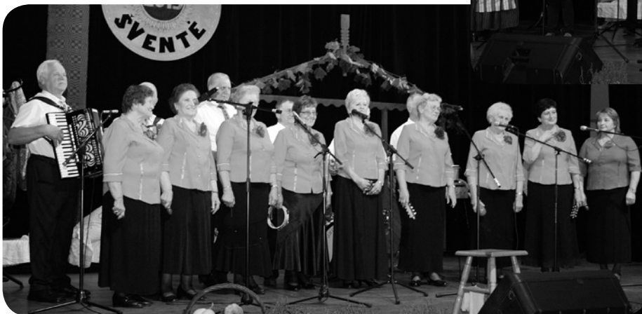
Punsko senjorų klubo kapela „Tėviškės aidai“