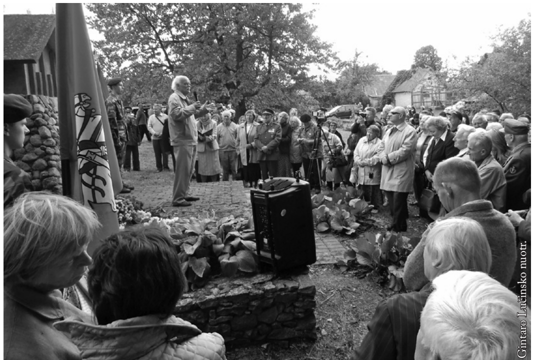
Minėjimas prie paminklo Juozo Vitkaus-Kazimieraičio paskutinės vadavietės vietoje Liepiškių kaime

Su užduotimi surasti ir sunaikinti „A“ apygardos štabą buvo išsiųstos į spėjamą štabo buvimo vietą žvalgybinės paieškos grupės. Manevrinei grupei Nr. 2, vadovaujamai majoro Tuševskio, kaip ir visoms kitoms