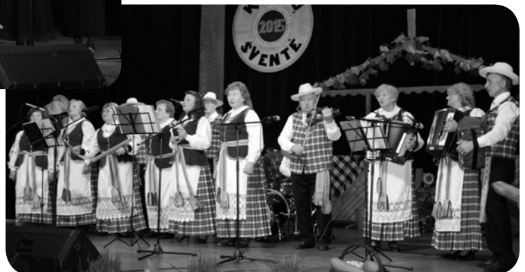
Kumečių kaimo bendruomenės liaudiškos muzikos kapela „Kaimynai“