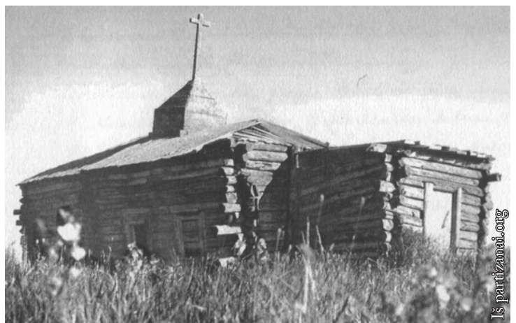
Lietuvos tremtinių bažnyčia Sibire

Artėjant Seimo rinkimams šis klausimas vis dažniau linksnuojamas politikų. Natūralu, kad didėjant Vakarų Europos šalių spaudimui Lenkijai dėl karo pabėgėlių priėmimo iškyla tautiečių repatriantų