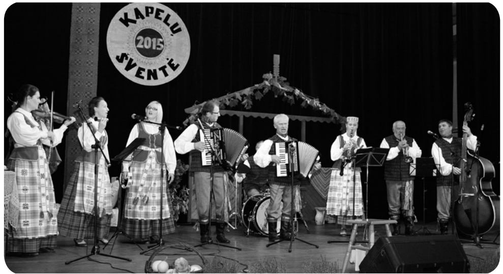
Seinų „Lietuvių namų“ liaudiškos muzikos kapela „Šalcinis“

Kapelių šventės akimirkos.