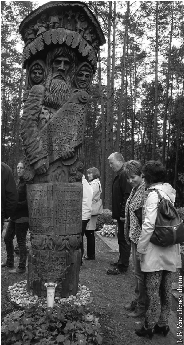
Prie Krėvės kapo