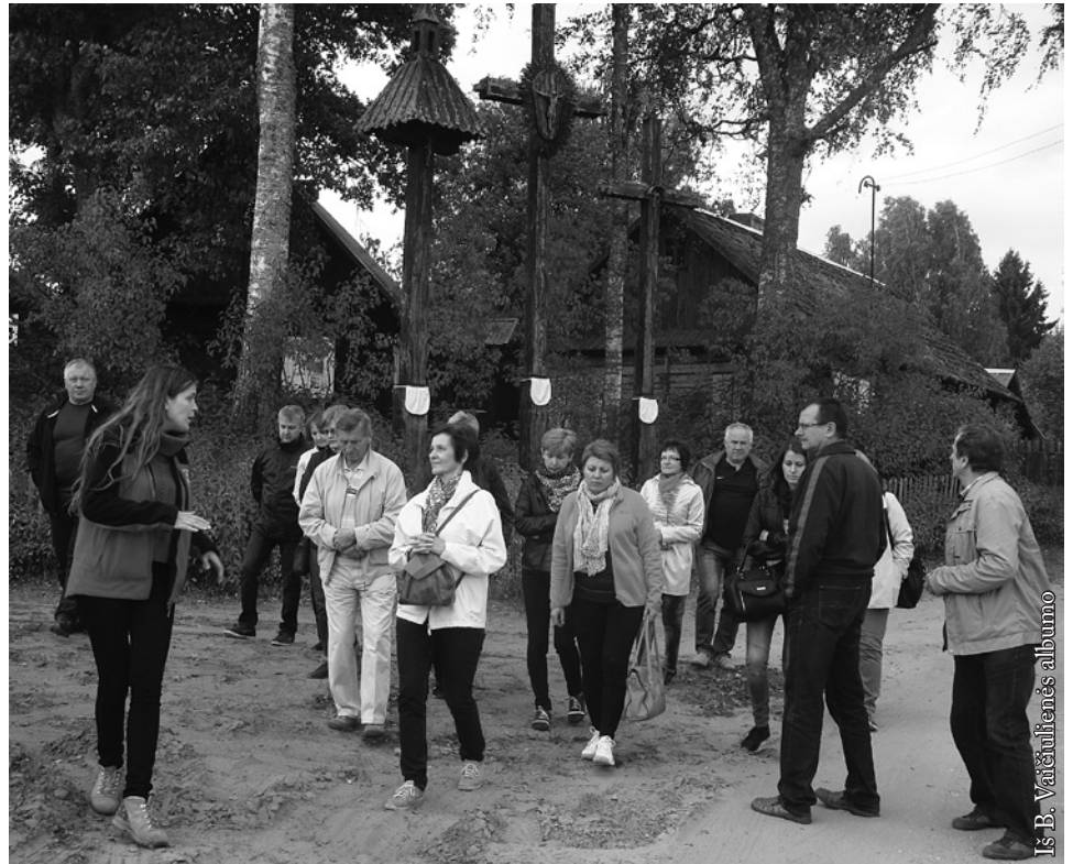
Prijuostuoti kryžiai Zervynuose

K ažkieno dzūkiškai sueiliuotos mintys puikiai atspindi tai, ką vieną rugsėjo šeštadienį pamatė ir patyrė dalis mūsų lietuviškų mokyklų pedagogų, dalyvavusių edukacinėje ekskursijoje po Dzūkiją. Rugsėjo 12 d. grupė Punsco Kovo 11-osios licėjaus mokytojų (šiuo metu dirbančių ir keli pensininkai) bei Vidugirių mokyklos pedagogai Lietuvos regionų metų proga panor geriau pažinti mūsų širdims artimiausią Dainavos kraštą. Prisiminkime, kad Lietuvos Respublikos teritorija dalijama į penkis etnografinius regionus: Dzūkiją (Dainavą), Suvalkiją (Sūduvą), Aukštaitiją, Žemaitiją ir Mažąją Lietuvą. Svarbiausi kriterijai, pagal kuriuos brėžiamos Lietuvos etnografinių regionų ribos, yra: materialinės ir dvasinės kultūros reiškinių (darbo, šeimos, kalendorinių ir bendruomenės švenčių, kalbos (tarmių), folkloro, tradicinių amatų ir verslų, kulinarinio paveldo, architektūros, drabužių, audinių ir kt.) regioninis savitumas. Nors šie regionai formavosi ne vienu laiku ir jų vaidmuo istorijos eigoje buvo skirtingas, tačiau juos sudaro gana ryškūs etninės kultūros vertybių klodai, reikšmingi ne tik ten gyvenančių žmonių savimonei, bet ir visos Lietuvos kultūrinės tapatybės palaišymui ir stiprinimui. Verta pridurti, kad Dzūkijos pavadinimas nesenas,