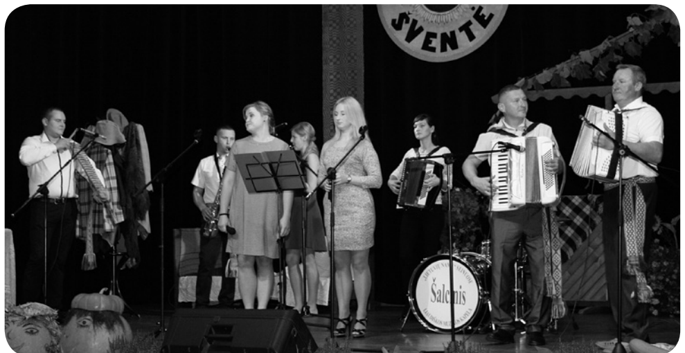
Vidugirių kaimo kapela