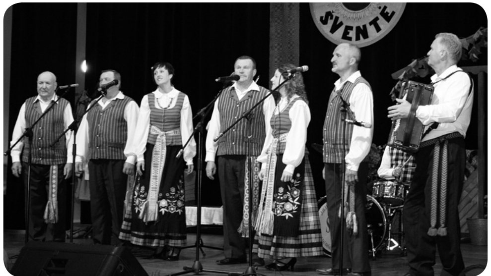
Punsko kultūros namų kapela „Klumpė“