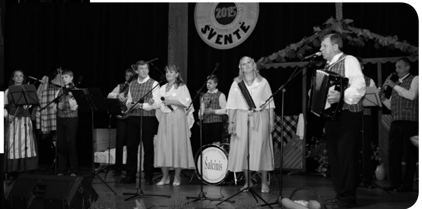
Mažeikių rajono Tirkšlių kultūros centro liaudiška kapela „Subatvakaris“