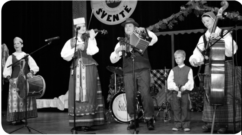
Punsko folkloro ansamblis „Alna“