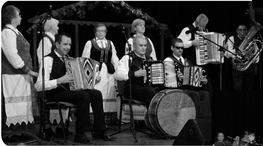
Jonavos suaugusiųjų švietimo centro kapela „Lankesa“