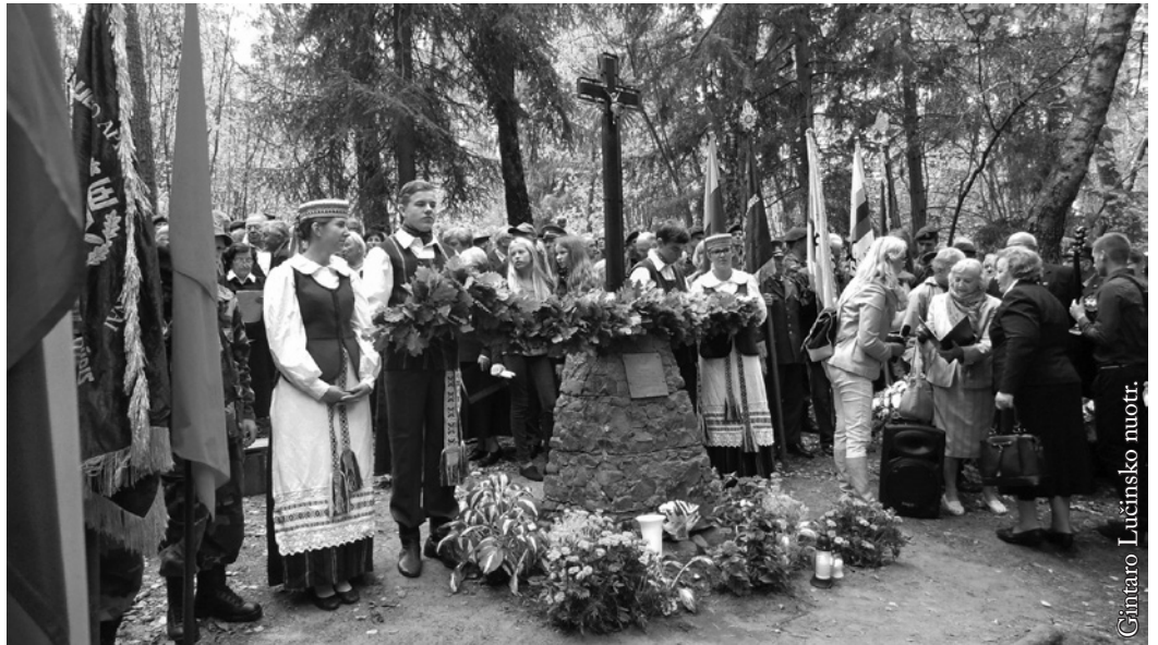
Minėjimas prie paminklo žuvusiems partizanams Bestraigiškės miške