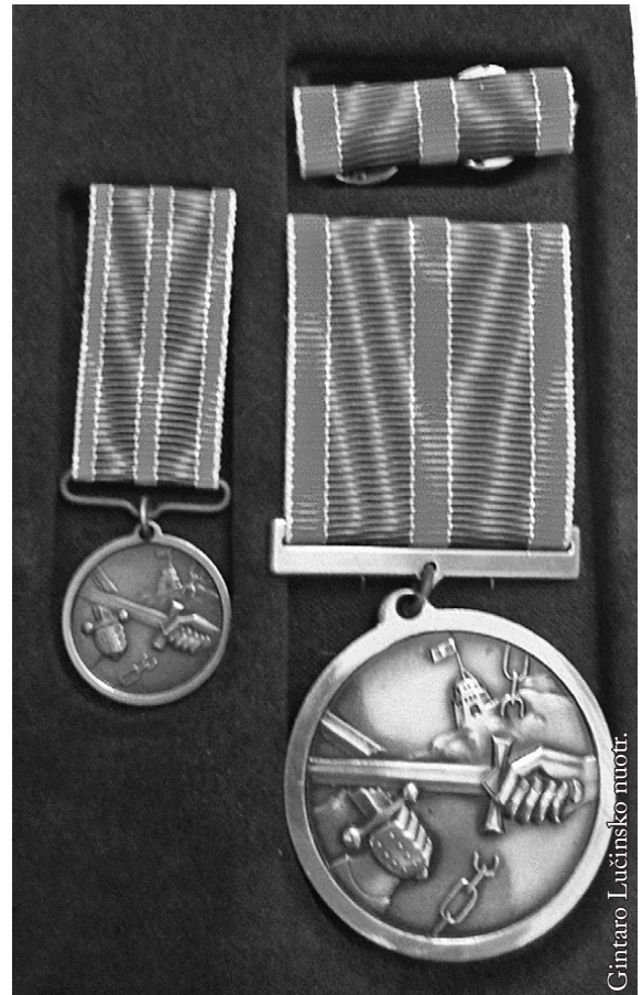
Lietuvos kariuomenės kūrėjų savanorių medalis

okupantams istorija. Vienos intensyviausių kovų vyko būtent Merkinės apylinkėse. Pati vietovė buvo dviejų pagrindžio administracinių vienetų geografinėje sandūroje. Vienas garsiausių mūšių pokario istorijoje: 1945 m. gruodžio 15 d. Lietuvos partizanų įvykdytas Merkinės miestelio puolimas. 1945 m. vasario 28 d. netoli Merkinės įvyko garsiosios Panaros kautynės. Abiejuose mūšiuose dalyvavo po kelis šimtus vyrų. Aktyvią pagrindžio veiklą Merkinėje ir gretimoje teritorijoje vykdė legendinis Lietuvos partizanas, Dainavos apygardos partizanų vadas Adolfas Ramanauskas-Vanagas, pirmasis Pietų