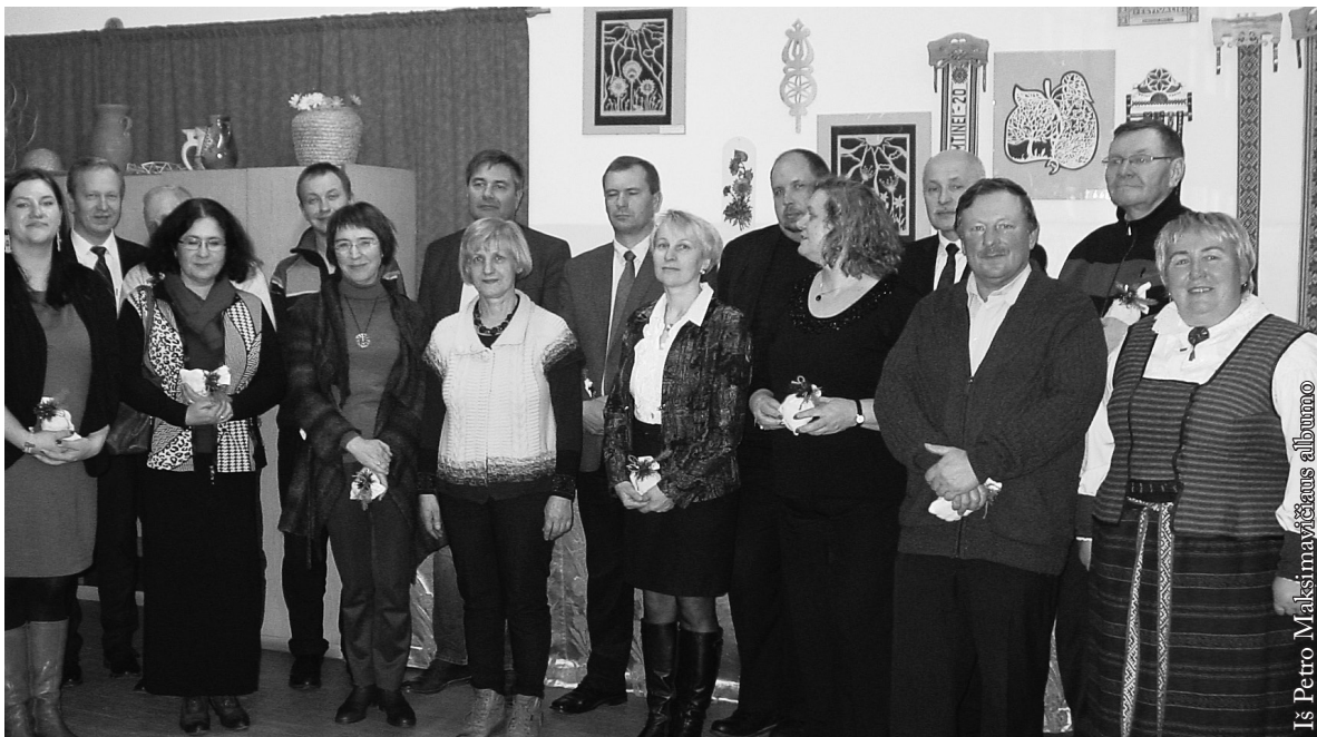
Susitikimo su LR kultūros ministerijos atstovėmis dalyviai

I Punską iš Varšuvos ir Liublino 1986 m. vasarą atvykę studentai su savo dėstytojais surengė mokslinę ekspediciją. Jų tikslas buvo tyrinėti, kur, kodėl ir kaip pasireiškia lietuvių kultūra Punsko savivaldybėje. Ekspedicijos metu pastebėta, kad lietuvių kultūrinis ir visuomeninis gyvenimas Punske labai turiningas, pasireiškia įvairiomis formomis ir pasižymi masišku-