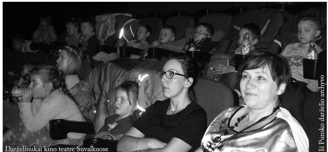
Darželinukai kino teatre Suvalkuose

Lapkričio 18 dieną Punsko darželinukai buvo išvykę į Suvalkus į kiną. Vaikučiai žiūrėjo filmą „Sava – mažas, bet didelis didvyris“. Darželinukai žavėjosi pagrindiniais herojais, jų geraširdiškumu ir darbais. Maloniai leido laiką kine, valgė kukurūzų spragėsius. Į darželį grįžome pilni išpūdžių.