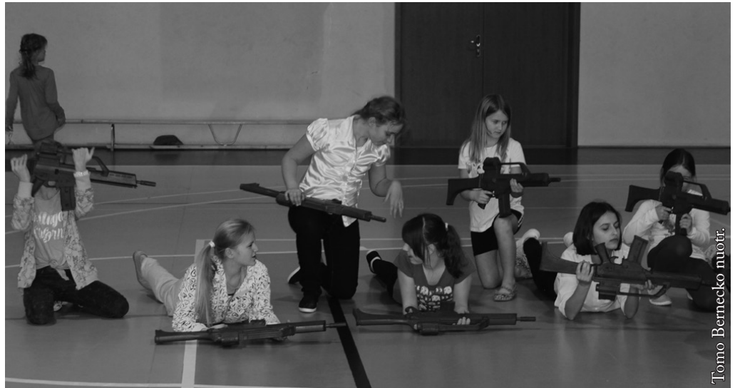
Lietuvos kariuomenės diena Seinų „Žiburio“ mokykloje

Grįžę į mokyklą stebėjome meno programėlę, kurią parengė I–VI klasių mokiniai. Kariai pristatė mums savo darbą trumpais filmais. Po to, mokinių nuomone, prasidėjo linksmiausia dienos dalis. Kariai mokė mus taisyklingai žygiuoti, parodė savo įrangą ir kaip ji naudojama, surengė mums varžybas