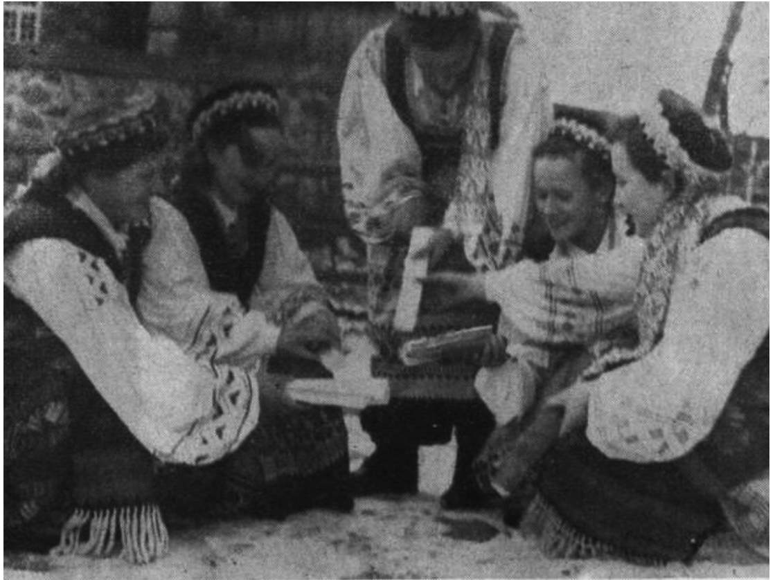
Malkų rinkimas. Kiekvienu atveju lemia porinis skaičius

Trečiasis peržvelgtas leidinys, tai 1961 m. trečiasis „Aušros“ numeris.