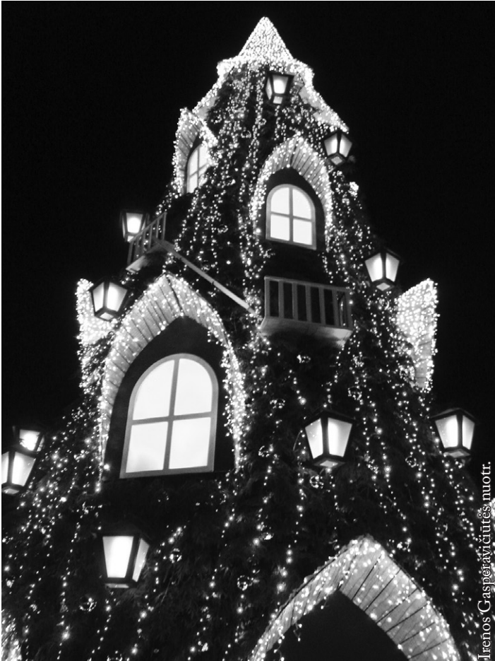
2015 m. Vilniaus kalėdinė eglutė

nėra daug. Bet jei į rinkimus ateitų tik pusė, koks milijonas (taip jau yra buvę) rinkėjų, o protestuotojai ateitų, jie sudarytų penktadalį.