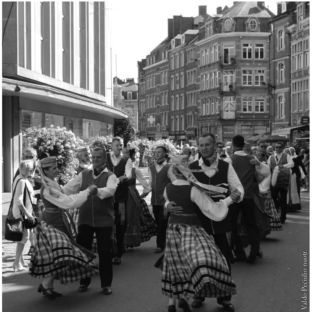
Punsko lietuvių kultūros namų tautinių šokių grupė „Vyčiai“ Belgijoje

Liepos 12 d. visą mūsų bendruomenę maloniai nustebino Australijos lietuvių liaudiškos muzikos ansamblis „Pamesta klumpė“, kuris koncertavo ne tik Punske, bet ir Seinuose. Tai keliolika jaunų žmonių, kurie savo laisvalaikį skiria lietuviškai dainai ir muzikai. Visus klausytojus pakerėjo kūrinių atlikimo maniera ir charakteris. Kartais net sunku buvo patikėti, kad ir lietuviai scenoje moka būti tokie gyvastingi, charizmatiški ir uždegantys. Todėl „Pamesta klumpė“ iš Australijos mus labai sužavėjo ir pradžiugino.