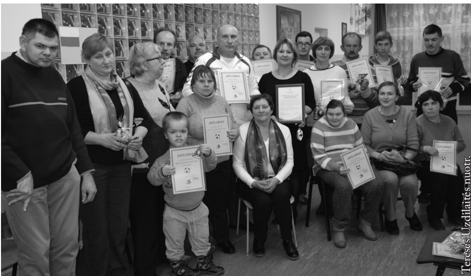
Kalėdinių žaidynių 2015 dalyviai

Mes mylime Žemę, Žmogų ir Saulę Ir šitaip įveikiame savo negalią“.