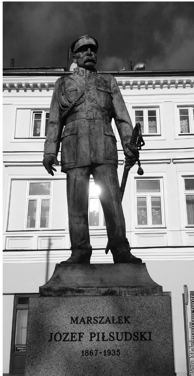
Juzefo Pilsudskio paminklas Suvalkuose

Valstybės valdymo pertvarka jau veikia mūsų gyvenimą. Ginčai aukščiausiuose valdžios sluoksniuose ir jų metu išsakomi