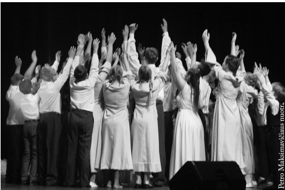
Jaunimo šokių grupė „Seina“