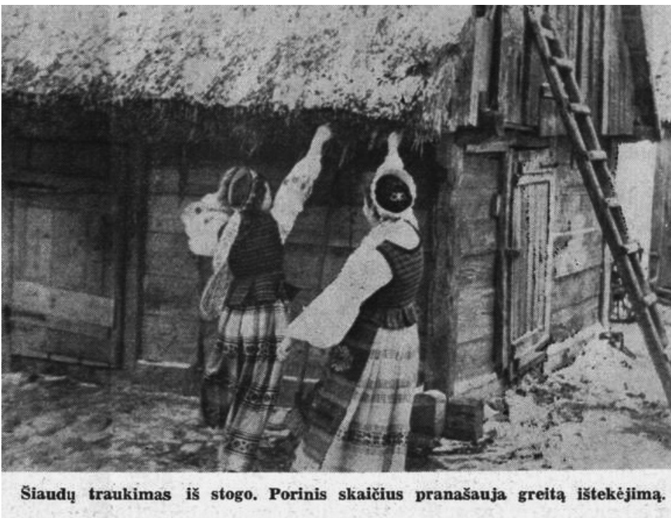
Šiaudų traukimas iš stogo. Porinis skaičius pranašauja greitą ištekėjimą.

Kiek vėlesniame už minėtą „Šaltinio“ numerį 1937 m. „Kalėdų minčių“ leidinyje taip pat buvo