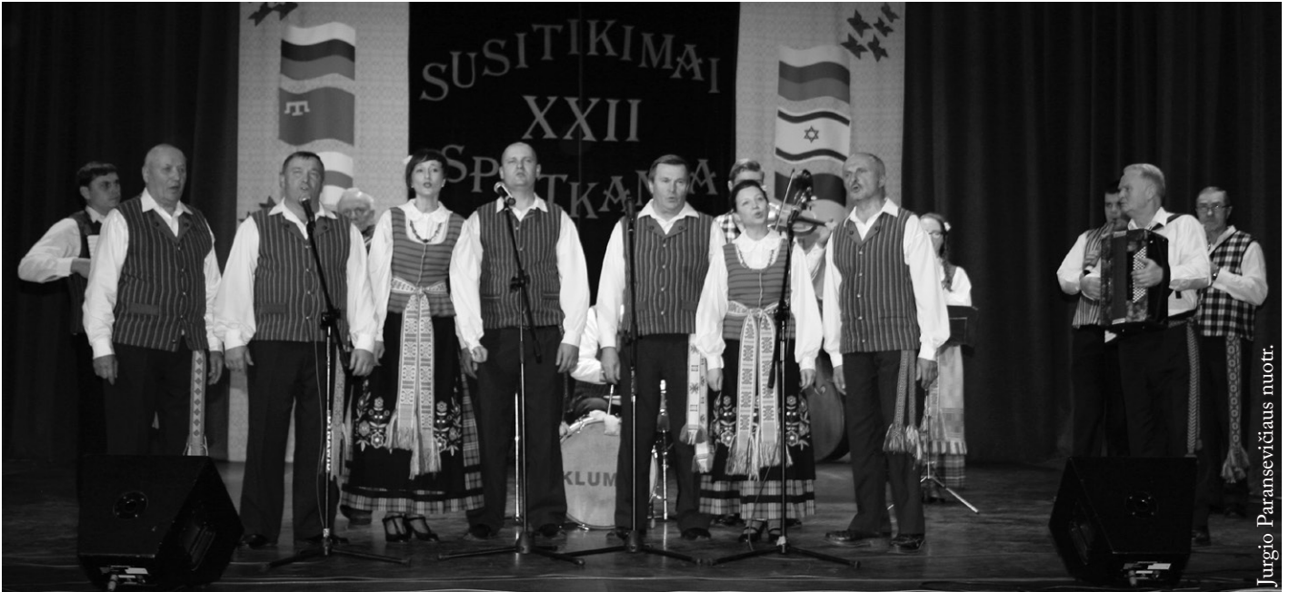
Jurgio Paransevičiaus nuotr.