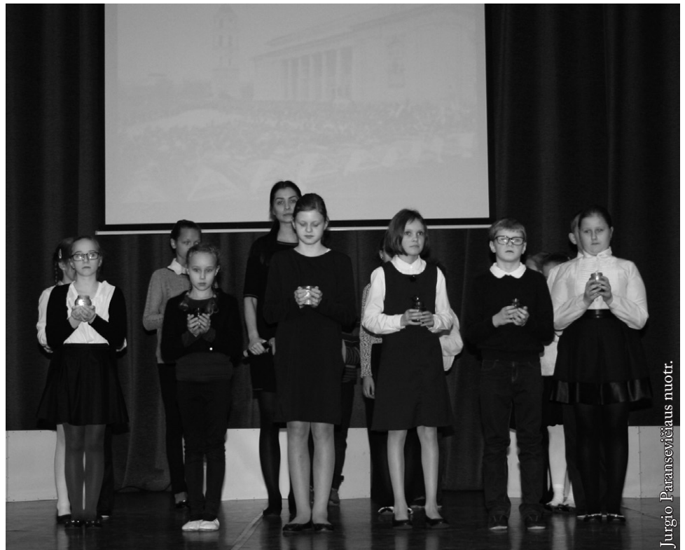
Sausio 13-osios minėjimas Punsco lietuvių kultūros namuose

„Aš čia – gyva“, – rašęs Bernardas Brazdžionis. Lietuva gyva. Džiaukimės jos laisve, branginkime jos istoriją ir tuos, kurie kovojo už ateitį.