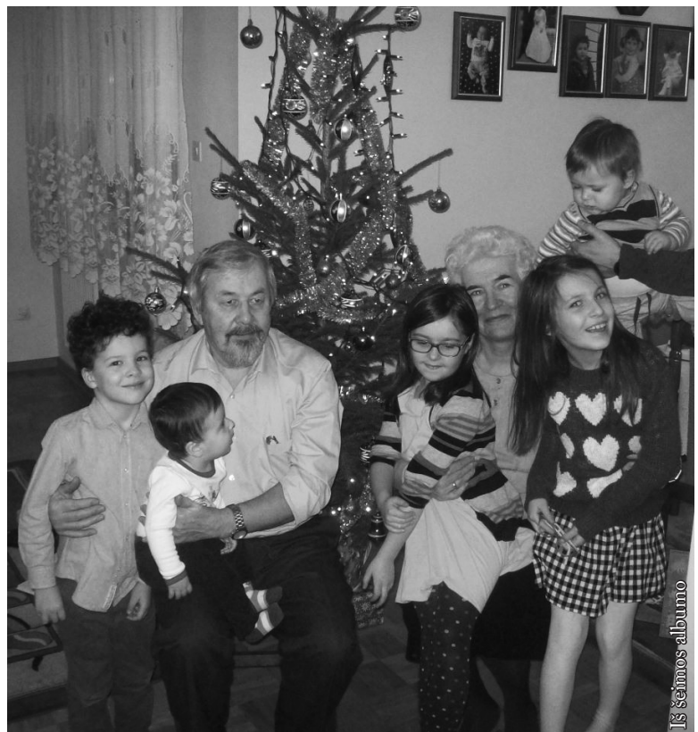
Iš šeimos albumo

J. S.: Ačiū Jums už pokalbį ir laukiame sugrįžtant.