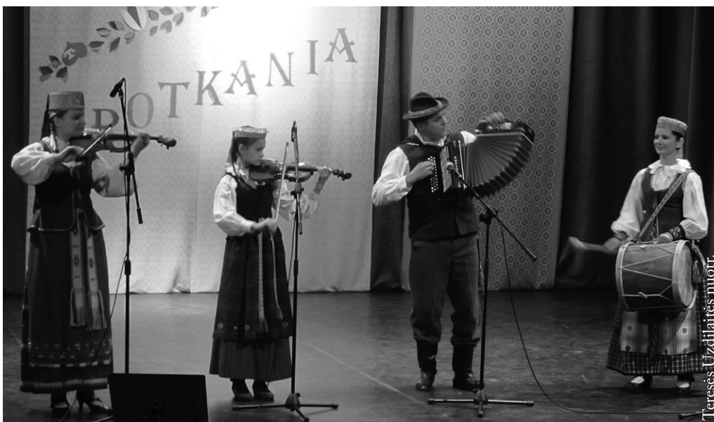
„Alna“ Tautinių mažumų susitikimuose