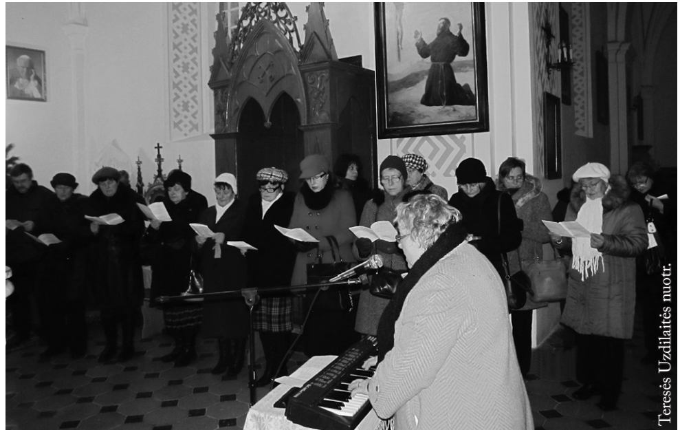
„Gimtinė“ per adventą gieda Šv. Mergelės Marijos valandas

Žolinės – svarbiausia Punsco šventė, kurioje dalyvauja daugiausia svečių ir turistų. Draugija yra pagrindinė tautodailės mugės ir folkloro festivalio organizatorė. Renginio scenoje, be kitų, pasirodė Skriaudžių kanklininkai, Dovilų etnografinis ansamblis „Lažupis“, „Gimtinė“, „Alna“ ir „Šalcinukas“. Festivalis pavadintas „Išaudiau drobėlį“. Šalia scenos įrengtos staklės. Kiekvienas galėjo