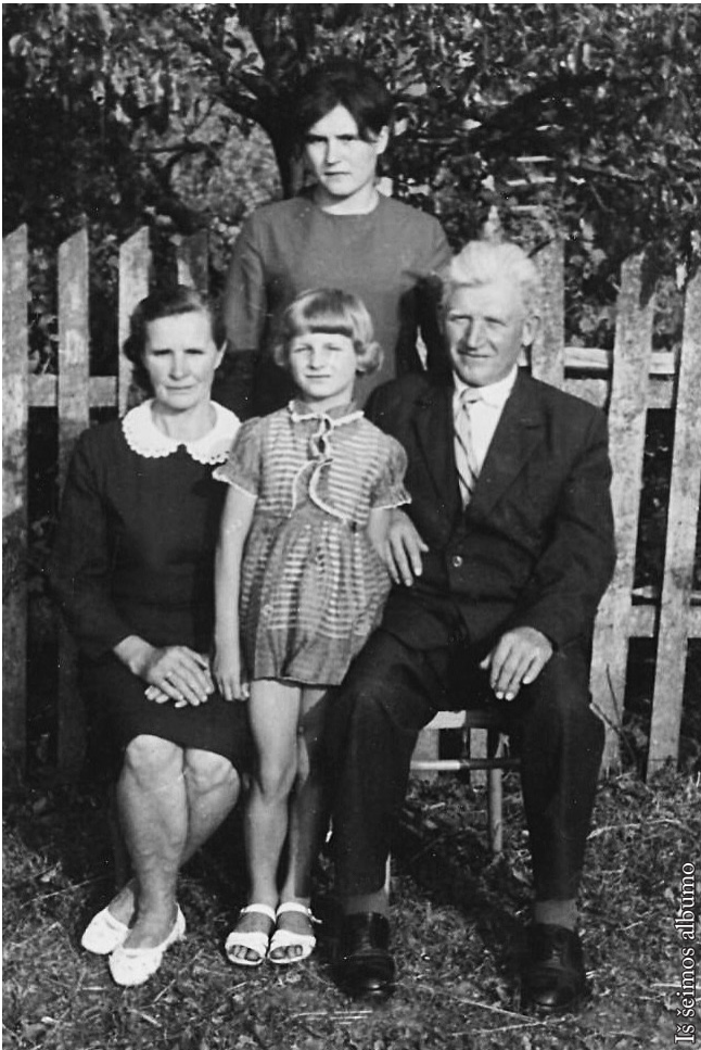
Su tėveliais ir maža sesute

Man mokslas sekėsi neblogai. Mielai dalyvačiau mokyklos gyvenime. Vienu metu teko būti klasės šeimininke, dirbti mokyklos savivaldoje, o pasibaigus mokslo metų ketvirčiui su kitais mokiniais ruošiau sienlaikraštį su visų klasių mokymosi rezultatais. Galbūt dėl to gerai atsimenu savo pažymius. Buvoau šešta tarp geriausiai