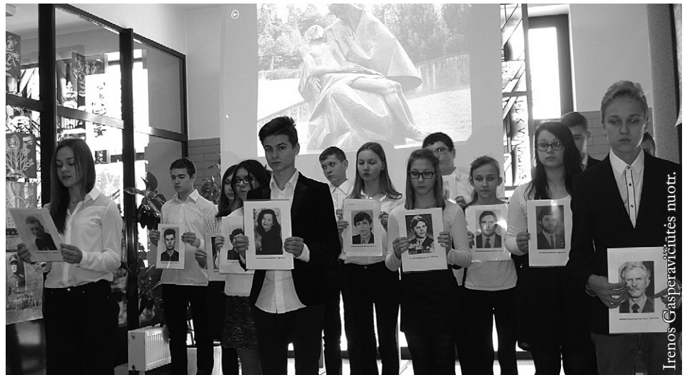
Sausio 13-osios minėjimas Seinų lietuvių „Žiburio“ mokykloje