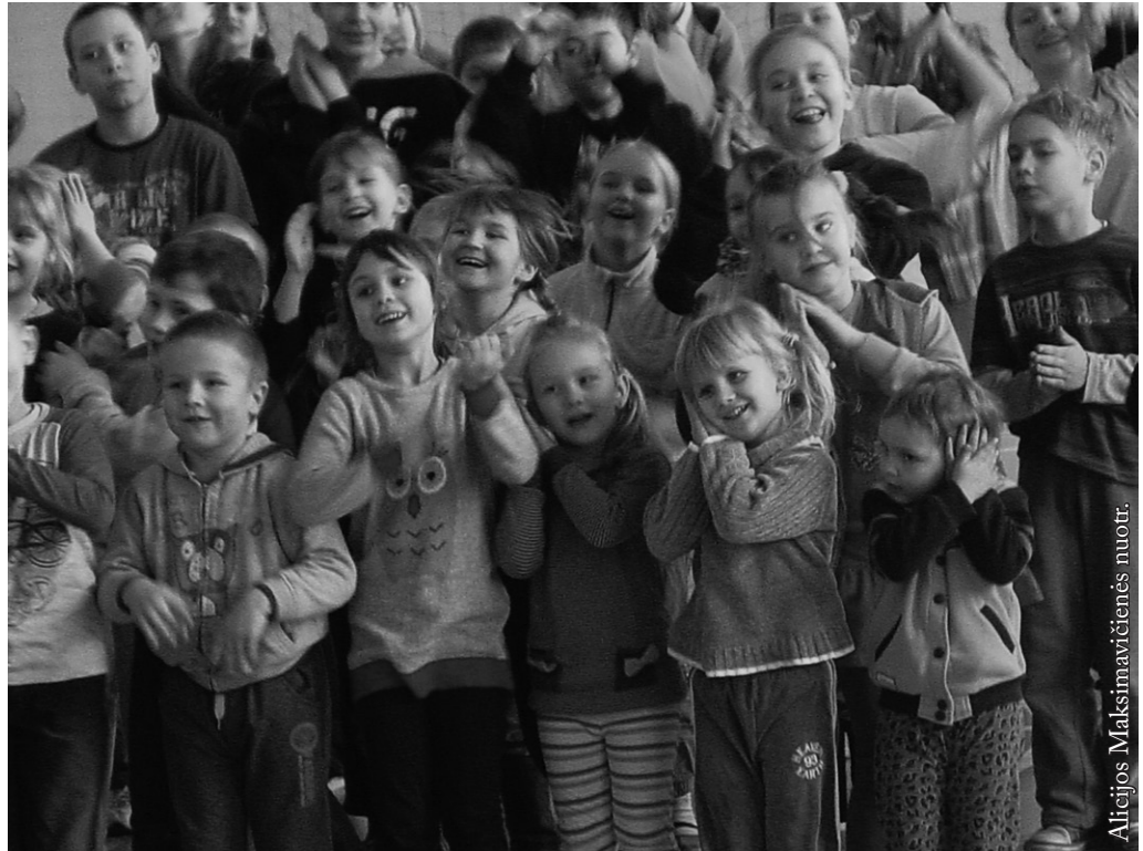
Žiemos stovykla Seinuose

Švietimo reformos daug kainuoja, kadangi kiekvienas sprendimas sukelia grandininę reakciją. Keičiant