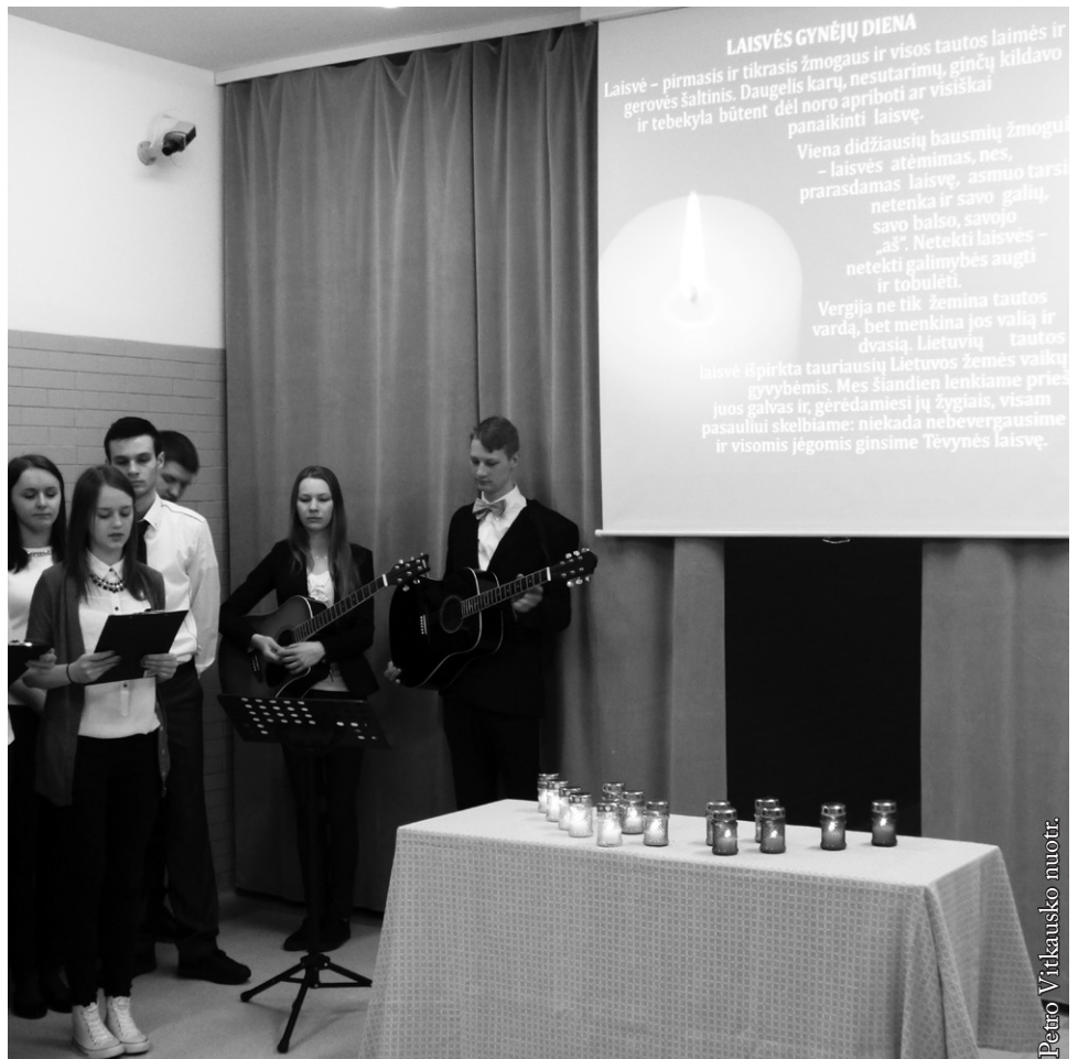
Punsco Kovo 11-osios licėjuje