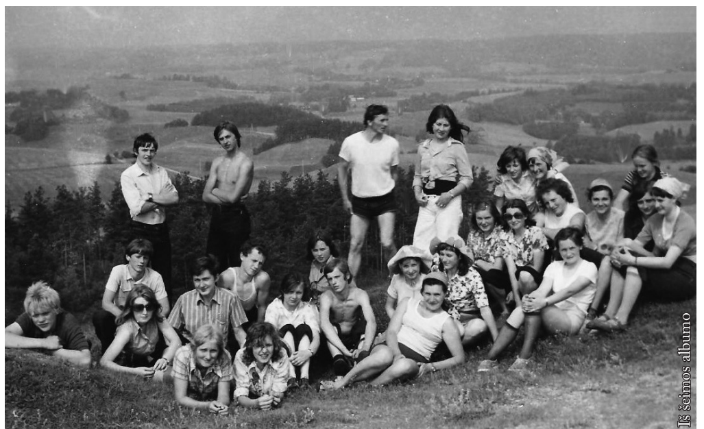
Kelionė į Šiurpilį