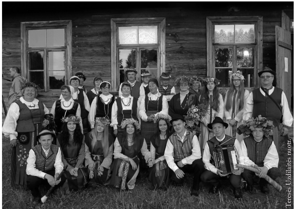
Joninės Balstogės skansene

Metų pradžioje, sausio 13 d., draugija jau antrą kartą su Punsko parapijos kunigu M. Talučiu surengė minėjimą. Dėl stipraus vėjo jis šįkart vyko parapijos salėje prie židinio. Kartu su „Gimtinės“ ansambliu susirinkusieji dainavo patriotines dainas, kunigas skaitė eiles. LLEKD globojami ansambliai dalyvavo Punsko lietuvių kultūros namų surengtame