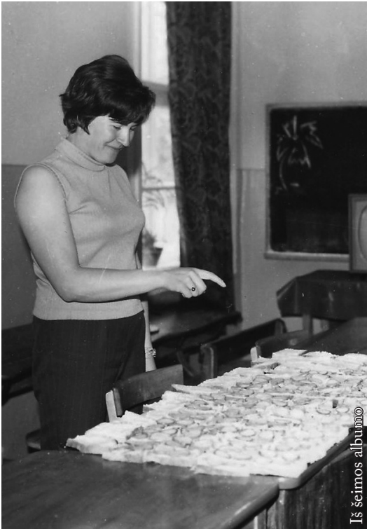
Iš šeimos albumo

Stovyklos Sudetuose metu skaičiuoju sumuštinius