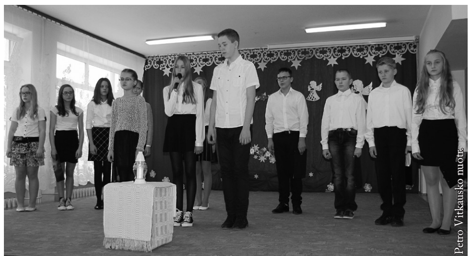
Punsko Dariaus ir Girėno mokykloje