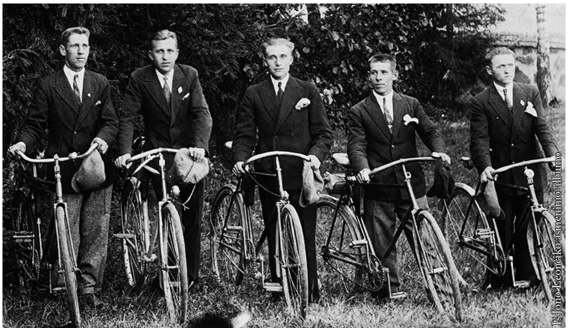
Klevų vyrukai su dviračiais