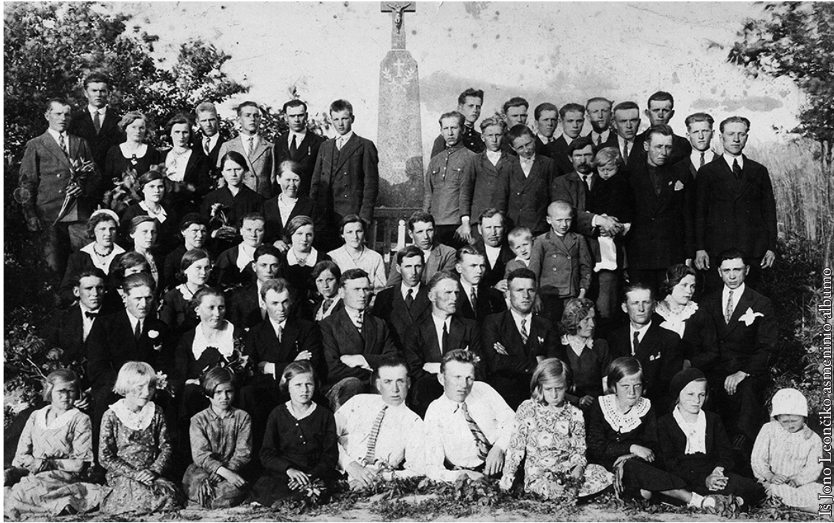
Kleviškiai prie kryžiaus palei Marazus