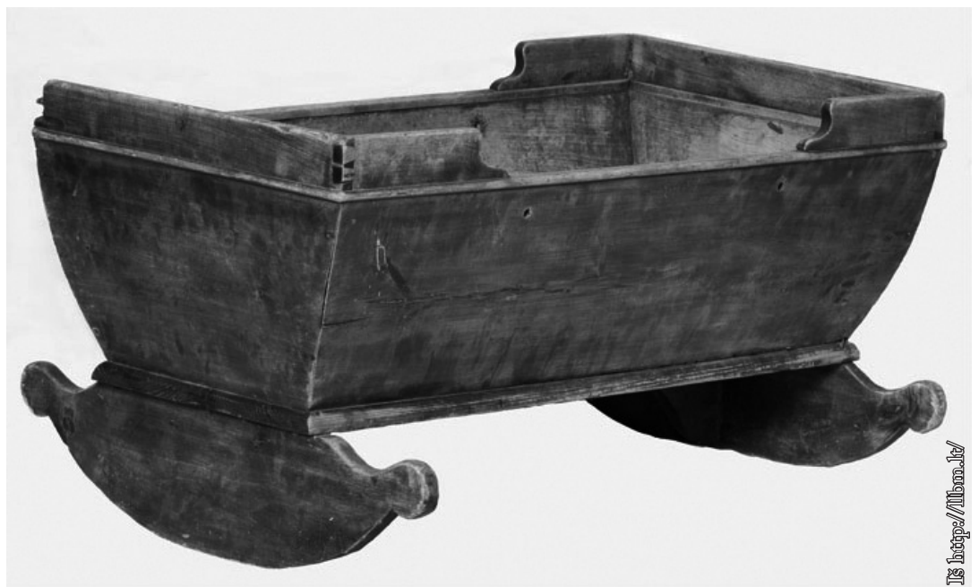
Lopšys, vygė. Pagamintas 1908 m., naudotas Šilutės r., Prycmų k. LBM 33614