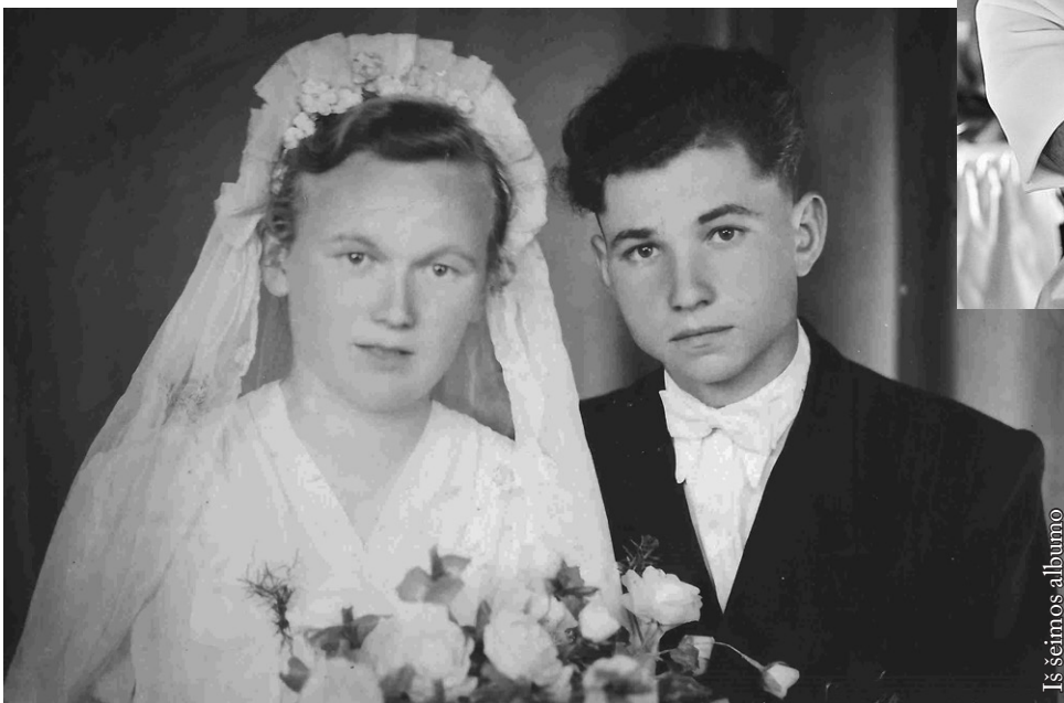
Vestuvinė nuotrauka. 1957-09-25