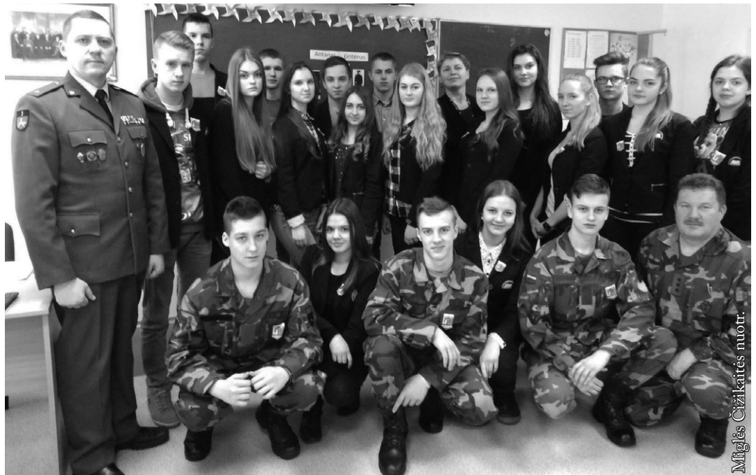
Mokiniai ir svečiai po istorijos pažinimo pamokos Lazdijų Motiejaus Gustaičio gimnazijoje