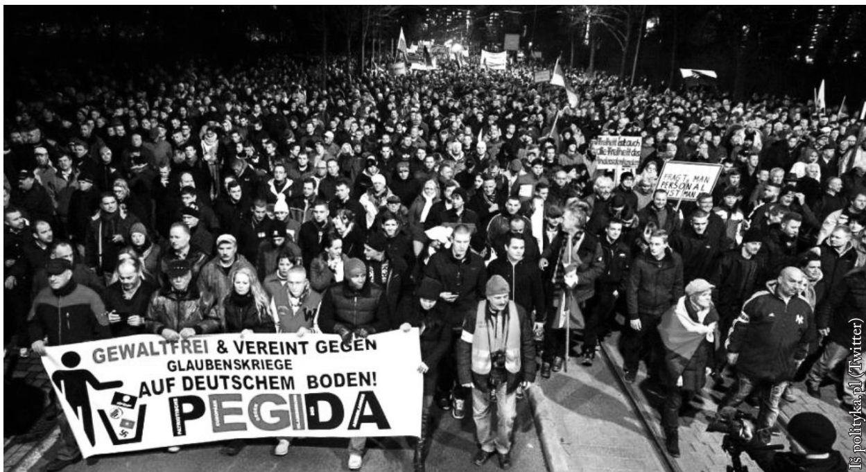
Vokietijoje protestus rengia judėjimas PEGIDA

Jau girdžiu kosmopolitiškai atlaidžių oponentų murmėjimą, kad