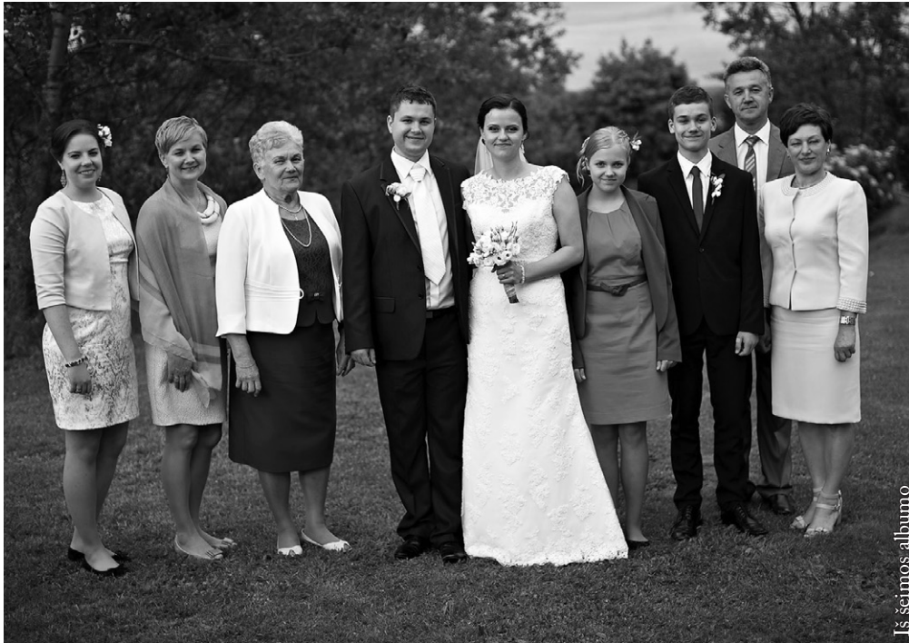
Iš šeimos albumo