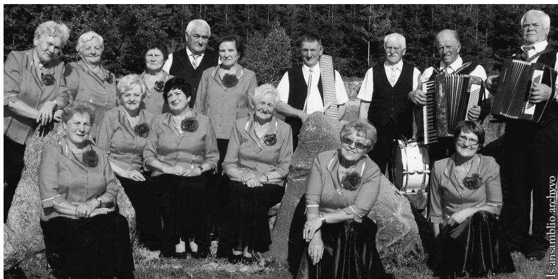
Iš ansamblio archyvo

Reiškiame užuojautą šeimai. „Tėviškės aidai“