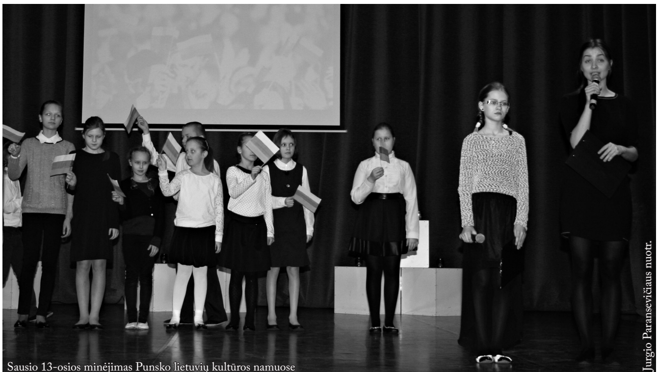
Sausio 13-osios minėjimas Punsko lietuvių kultūros namuose