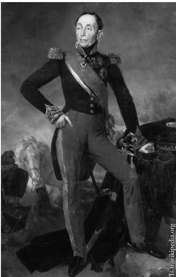
Generolas Emanuelis de Gruši

Netekęs galimybės pasipinigauti, Vredė vis tiek iškrėtė Seinams nemenką kiaulystę. Jis liepė kareiviams plėšti nuo stogų šiaudus arklių paklotui ir pjauti javus jų pašarui, nors šieno ir šiaudų atsargos buvo paruoštos iš anksto. Maža to, dar surengė dviejų dragūnų pulkų apžiūrą ir mokymus daržuose ir soduose. Po kelių valandų, kai daržovės ir pasėliai buvo ištrypti, o vaismedžiai stipriai apkapoti ir aplaužyti, Vredės dragūnai paliko Seinus. Kaip „kompensacija“ seiniškiams jų daržuose ir soduose liko kelios dešimtys nudvėsusių