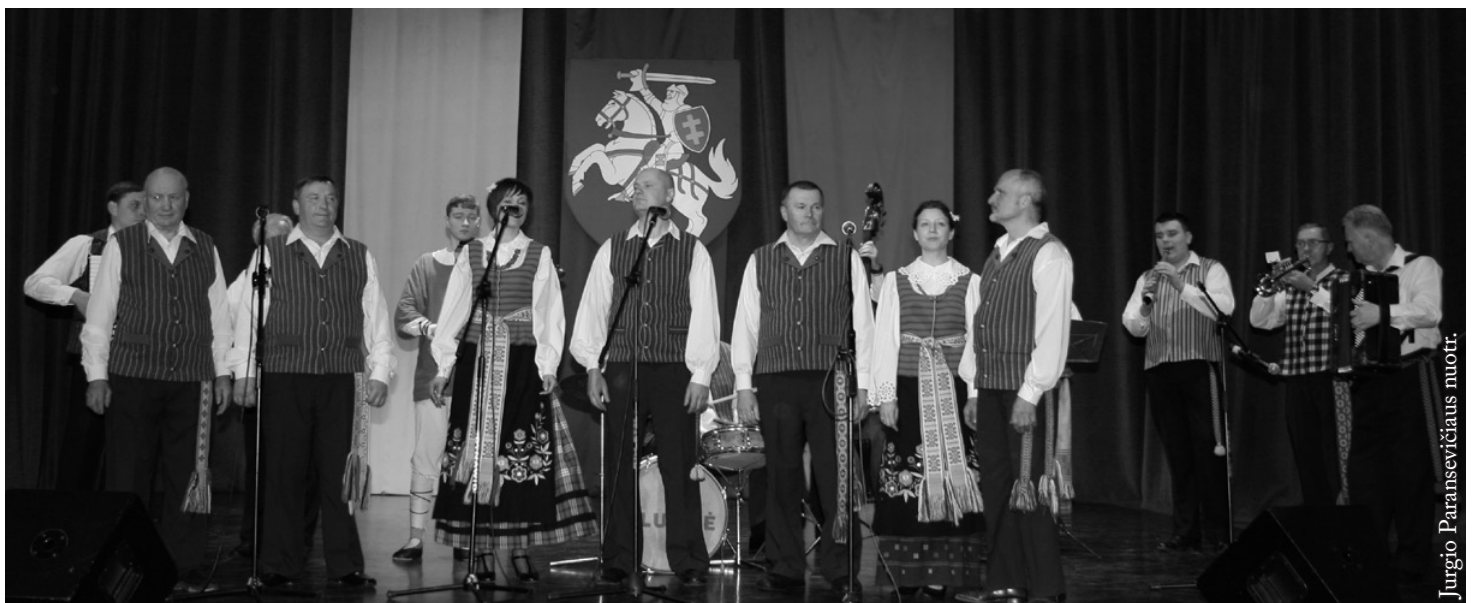
Punsko lietuvių kultūros namų kapela „Klumpė“