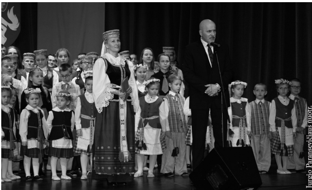
Jurgio Paransevičiaus nuotr.

Šventės proga sveikina LR konsulato Seinuose vadovas V. Stankevičius