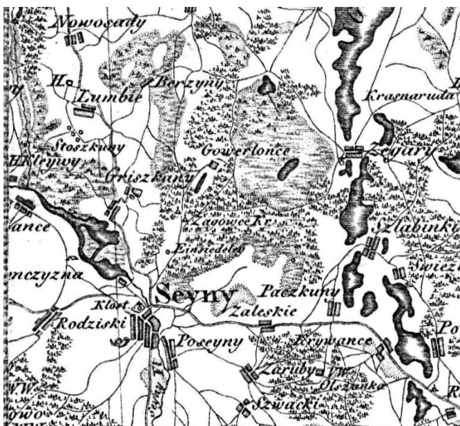
Seinų žemėlapis, 1807 m.

Po bavarų Seinuose pabuvojo ir kiti Napoleono armijos pulkai. Jie skyrėsi vieni nuo kitų savo mundurais, vėliavomis ir kalba. Tiktai požiūris į vietinių gyventojų nuosavybę