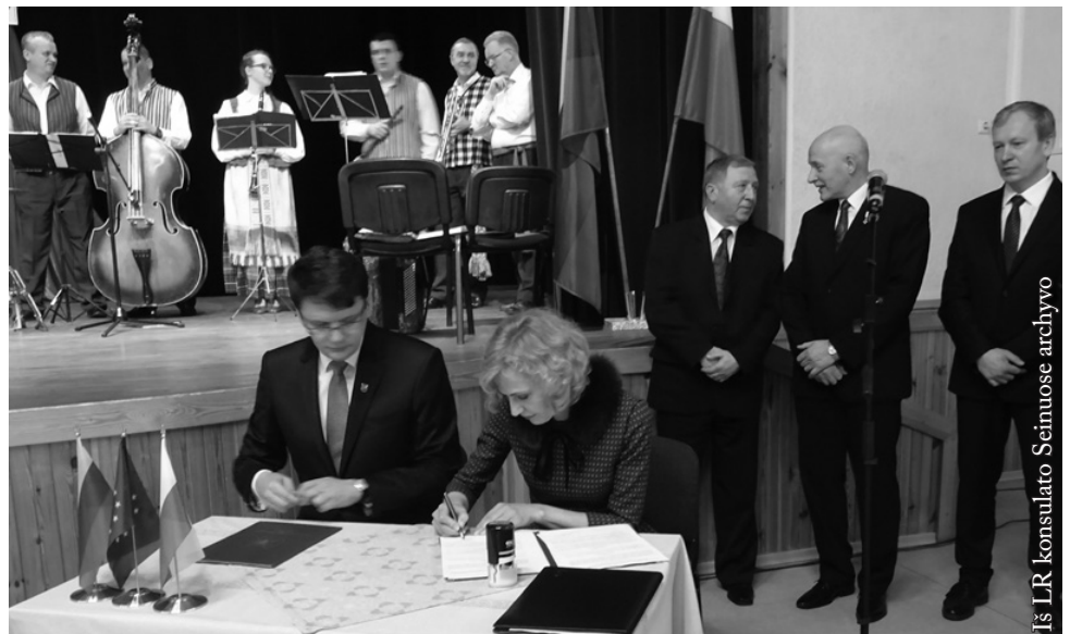
Alytaus ir Seinų miestų savivaldybės pasirašė bendradarbiavimo ketinimų protokolą