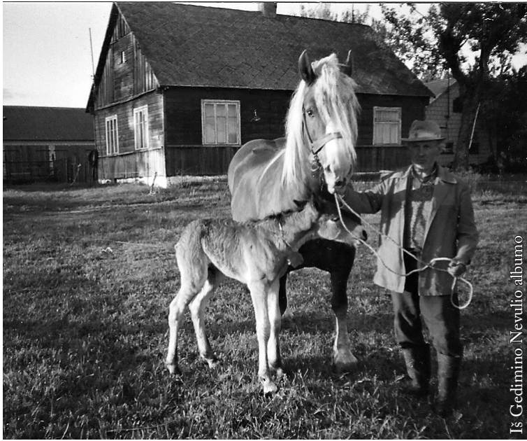
Iš Gedimino Nevulio albumo