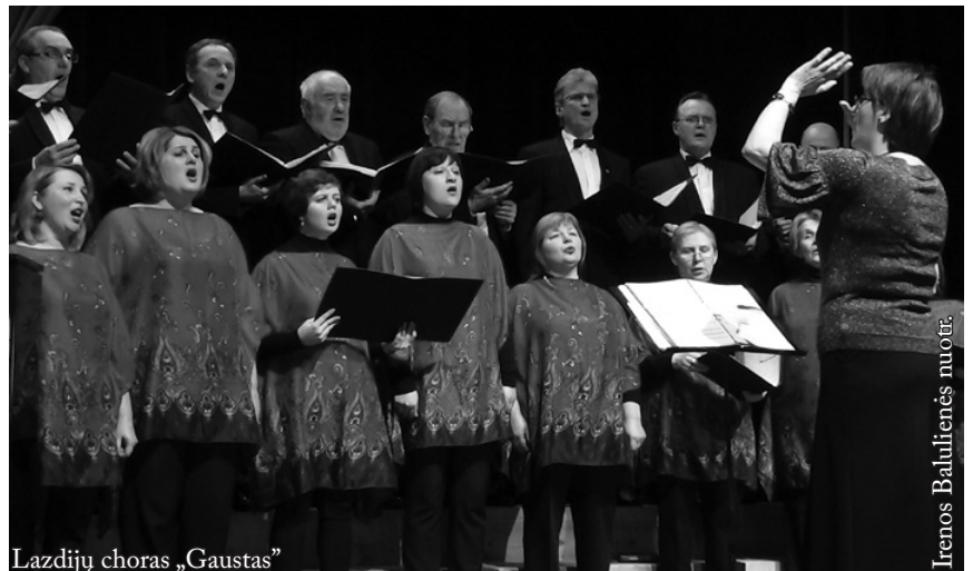
Lazdijų choras „Gaustas“