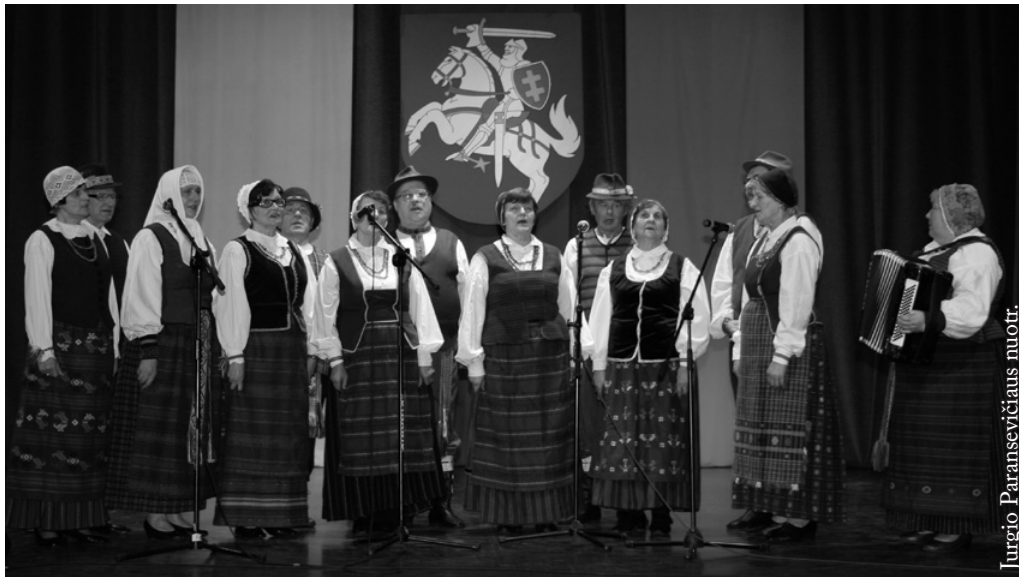
Lenkijos lietuvių etninės kultūros draugijos etnografinis ansamblis „Gimtinė“