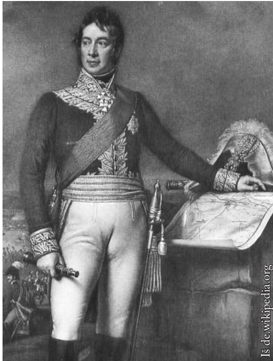
Grafas Karlas Filipas fon Vredė

buvo tas pats: „Kas tavo, tai ir mano“. Plėšė ir atiminėjo viską, ypač maistą. Nepaslėpti pinigai sėkmingai rasdavo prieglaudą kareivių kišenėse.