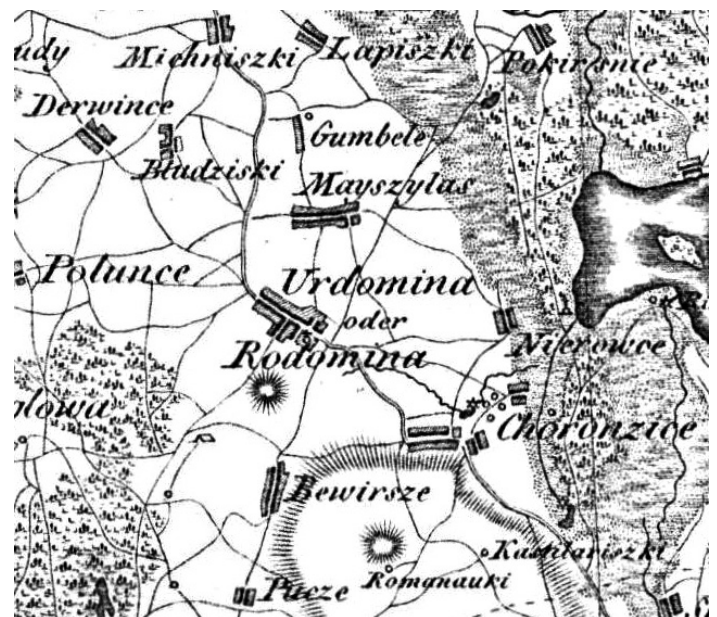
Rudaminos žemėlapis, 1807 m.