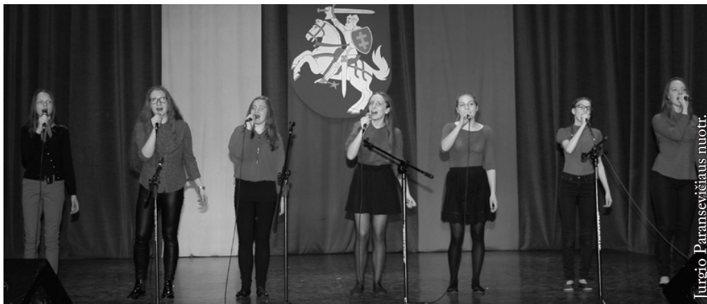
Punsko lietuvių kultūros namų vokalinė grupė „Balsynėlis“