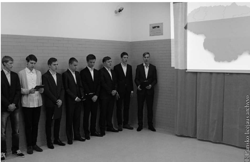
Licėjaus antrojų programa

Mus kviečia ir globoja studentų korporacija „Tautito“ (Tautiškumas, Tikėjimas, Tobulėjimas). Ačiū jiems už globą ir rūpinimąsi.