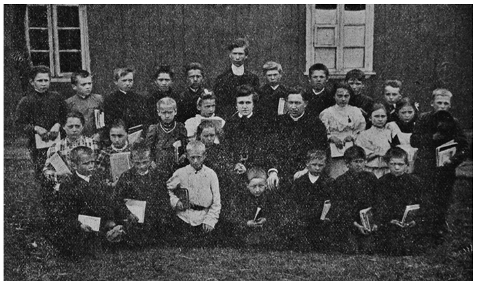
Seinų „Žiburio“ mokykla

„Šaltinio“ redaktorių gyvenimas carinės Rusijos valdžios „globoje“ nebuvo lengvas. Veikė cenzūra ir griežtas teismas, baudžiantis už valdžios nuomone, nepalankius straipsnius. Todėl reikėjo ginti tautinius, kultūrinius, religinius ir politinius lietuvių reikalus, bet kartu per daug „neįkasti“ valdžiai. Mat būdavo, kad redaktoriai sėdėdavo kalėjime, gaudavo dideles pinigines baudas ir buvo dažnai tardomi bei keičiami. Nepaisant carinės Rusijos valdžios „Šaltinio“ konfiskavimo atvejų, lietuviai drąsiai rašydavo apie savo reikalavimus ir nuoskaudas. Todėl ir mūsų kraštas išliko lietuviškas.