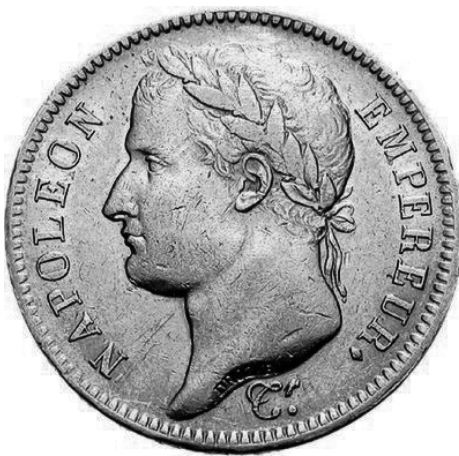
Prancūzijos auksinė 40 frankų moneta