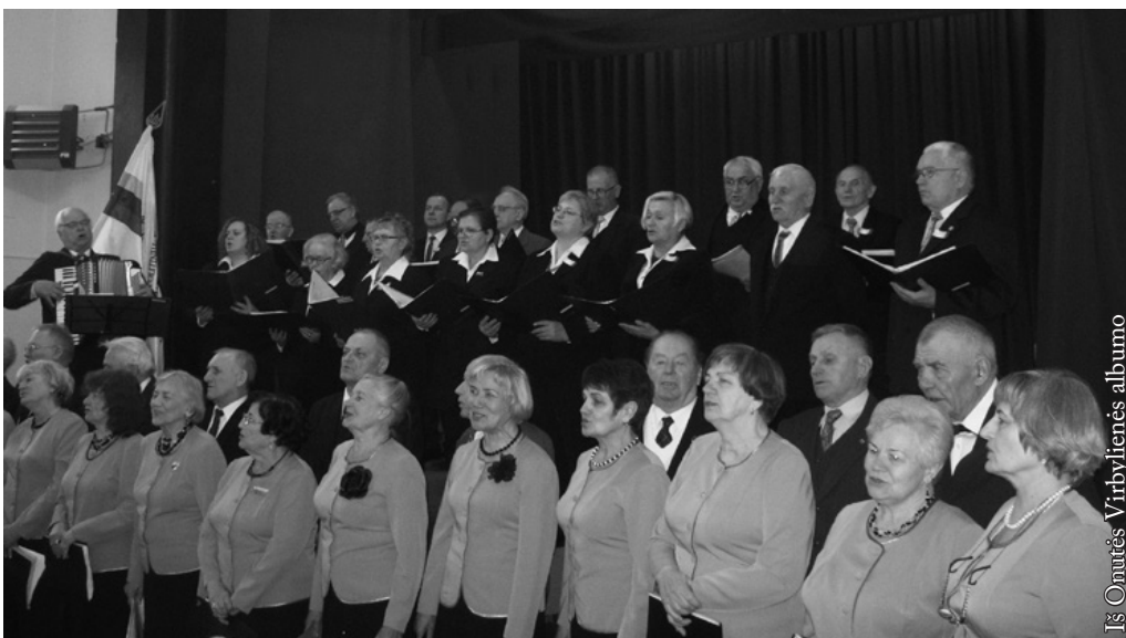
Pirmoje ir antroje eilėse Lietuvos politinių kalinių ir tremtinių sąjungos choras „Atmintis“ iš Alytaus, trečioje ir ketvirtoje eilėse Suvalkų lietuvių ansamblis „Ančia“ su „Tėviškės aidų“ iš Punsko muzikantais

Po oficialiosios renginio dalies dar ilgai bendravome prie vaišių stalo, dainavome liaudies dainas apie Lietuvą, tėvynę, gimtinę, kalbėjome apie patriotinę poeziją, išleistas knygas. Džiaugiamės, kad taip įdomiai ir garbingai galėjome paminėti Lietuvos nepriklausomybės atkūrimo dieną.