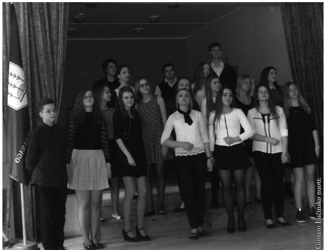
Adolfo Ramanausko-Vanago gimnazijos moksleivių meninė kompozicija „Diena, kai neskamba skambutis“