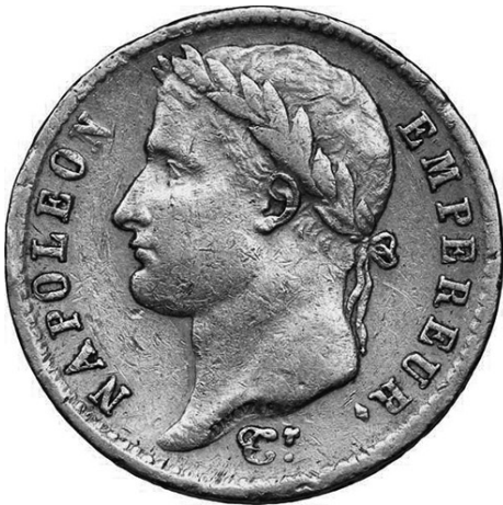
Prancūzijos auksinė 20 frankų moneta