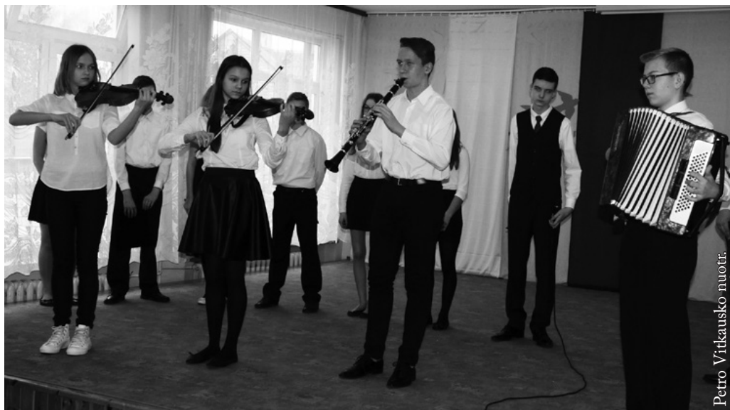
Gimnazistų paruošta programa