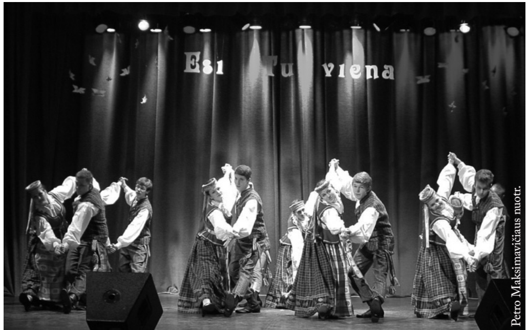
Punsko Kovo 11-osios licėjaus šokių grupė „Šalčia“