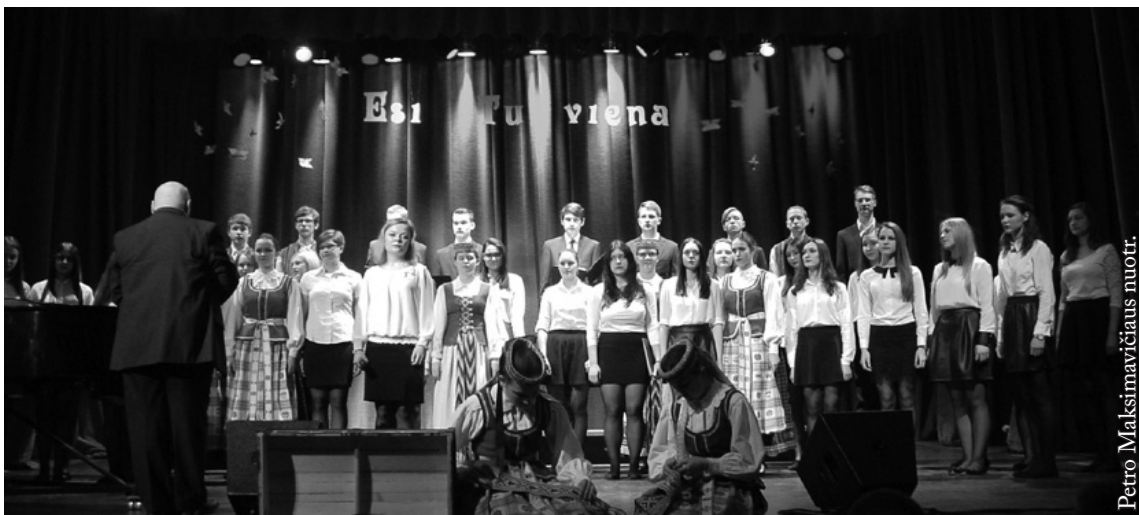
Punsko Kovo 11-osios licėjaus choras „Pašešupiai“

Mokyklos istorijoje svarbi data yra 1992 m. kovo 11-oji. Šią dieną, dalyvaujant svečiams iš Lietuvos ir Lenkijos bei gausiai susirinkusiai visuomenei, mokyklai suteiktas garbingas Kovo 11-osios vardas.