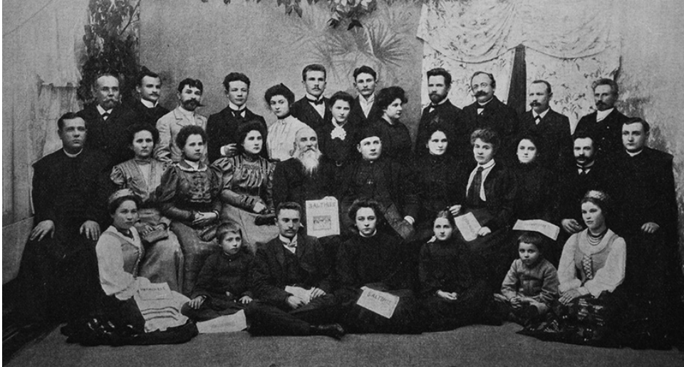
Lomžos lietuvių draugija „Pagalba“