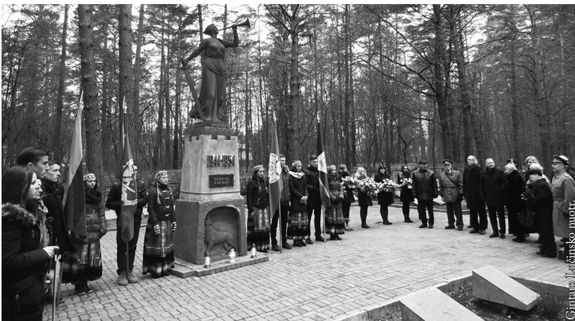
Dainavos apygardos partizanų memorialas kapinėse (Daugų g.) prie simbolinio Lietuvos partizanų vado Adolfo Ramanausko-Vanago kapo

Vėliau aplankytas Dainavos apygardos partizanų memorialas kapinėse (Daugų g.) ir simbolinis Lietuvos partizanų vado Adolfo Ramanausko-Vanago