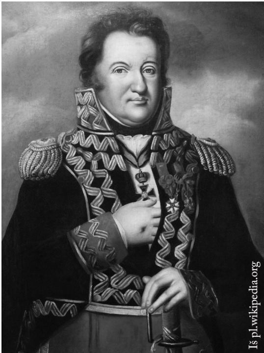
Generolas Jonas Henrikas Dombrowskis

eiti ir Varšuvos kunigaikštystės kavalerija. Didžioji dalis kavaleristų ėjo pėsti ir tarp jų matėsi daugiau karininkų negu kareivių. Geriausiai iš kavalerijos atrodė 4-asis raitųjų jėgerių pulkas. Jo visi karininkai buvo išsaugoję arklius, o ir kareivių kiekis, lyginant su kitais pulkais, atrodė nemažas.