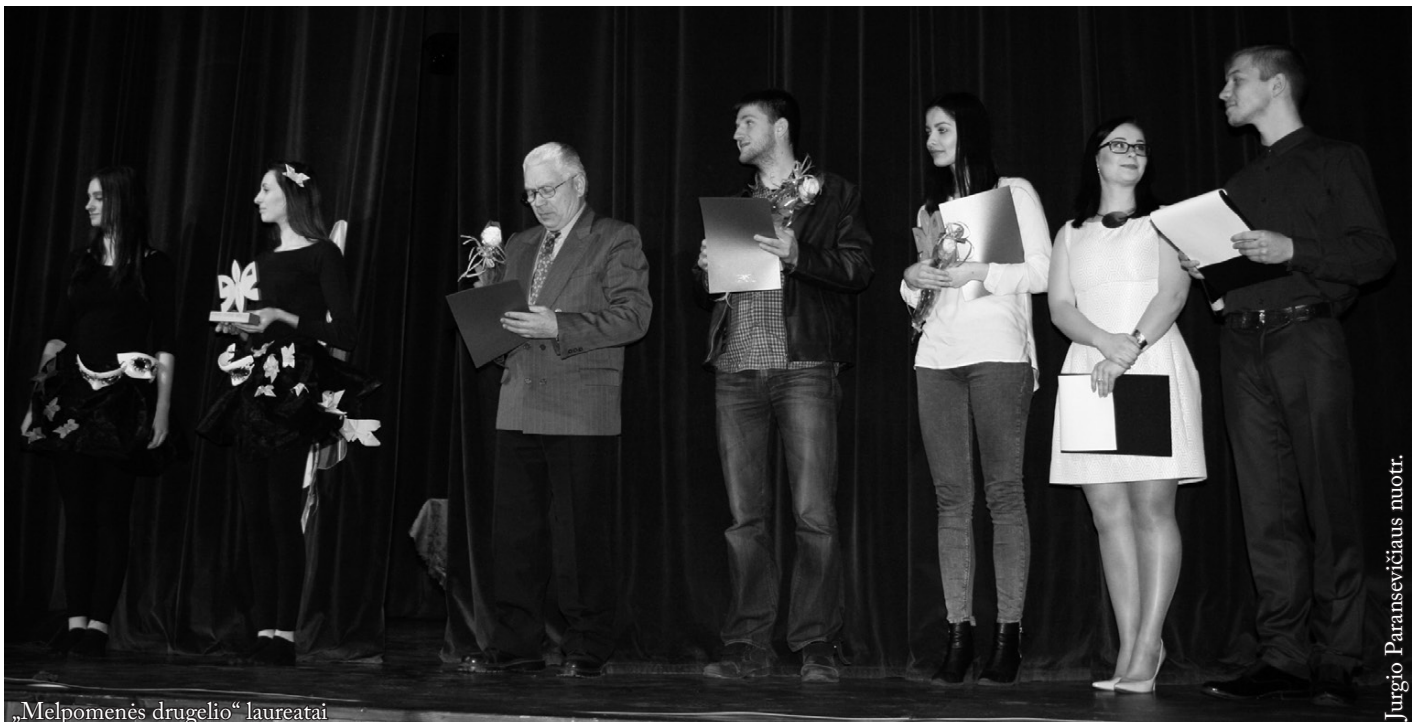
„Melpomenės drugelio“ laureatai

Laisvės gynėjų dienos minėjime kaip paprastai dalyvavo „Kregždės“ jaunieji ir „Kregždutės“ vaikučiai. „Kregždė“ paminėjo ir poeto Juozo Kėkšto 100-ąsias gimimo metines. Ta proga Vasario 16-osios koncerte parodyta poetinė kompozicija „Toks gyvenimas“. „Kregždė“ – pagrindinė