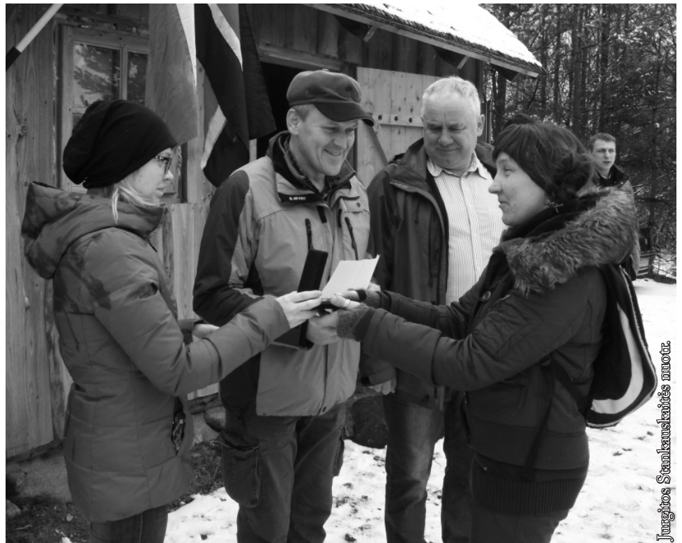
Žygyje dalyvavę punskiečiai

Jeigu dabar jus, skaitytojai, pavyko šiek tiek sudominti žygiais Lietuvoje, galite klausti, ar kitais metais vyks panaši pėsčiųjų kelionė. Atsakymas – taip, bet tikriausiai ne Punsco apylinkėse, o Lietuvoje. Mat kodėl gi nesusipažinus su Lietuvos grožiu kitoje sienos pusėje?