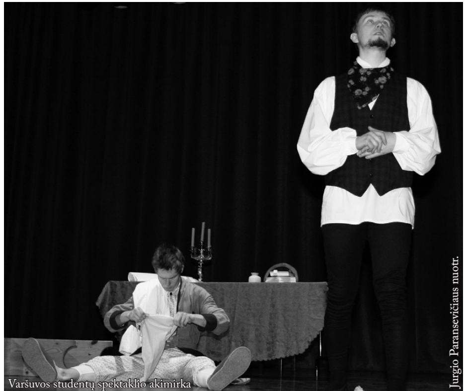
Varšuvos studentų spektaklio akimirka

Kaip ir kiekvienais metais, punskiečiai daug gastroliavo. Klotimo teatras vaidino Birštone, Kalvarijoje, Kurtuvėnuose, Ožkabaliuose, Palubiuose. Surengė vestuvinius vartus,