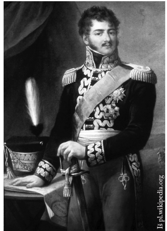
Kunigaikštis Juzefas Poniatovskis

Generolui Krasinskiui išvykus pro Seinus praėjo dar daug kareivių, bet niekas jau nebekreipė į juos dėmesio. Niekas net nepagalvojo, kad Seinuose gali pasirodyti ir pats Napoleonas.