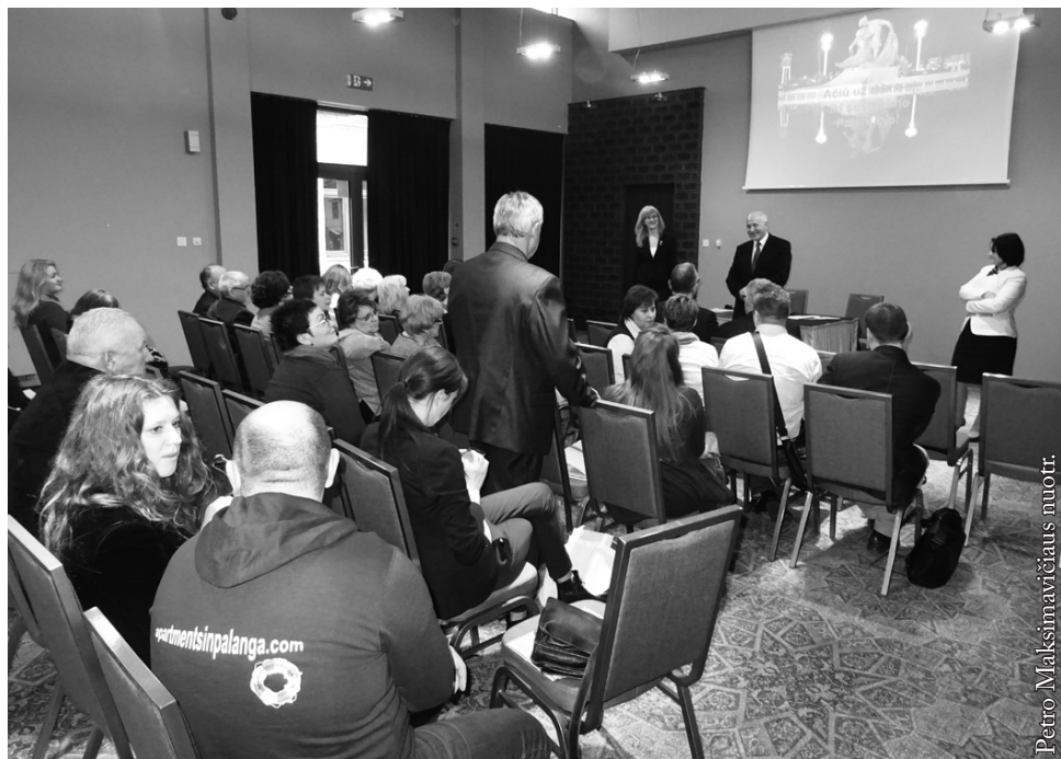
Susitikimas Suvalkų „Lof“ viešbutyje

prabangių viešbučių arba restoranų klientai. Tačiau atitinkamai suintensyvius reklamą ir ryšius su Lenkijos turizmo organizatoriais, Palangos klientais gali tapti tie, kurie atvyksta pailsėti prie Suvalkijos ežerų ar pasigrožėti šio regiono gamta.