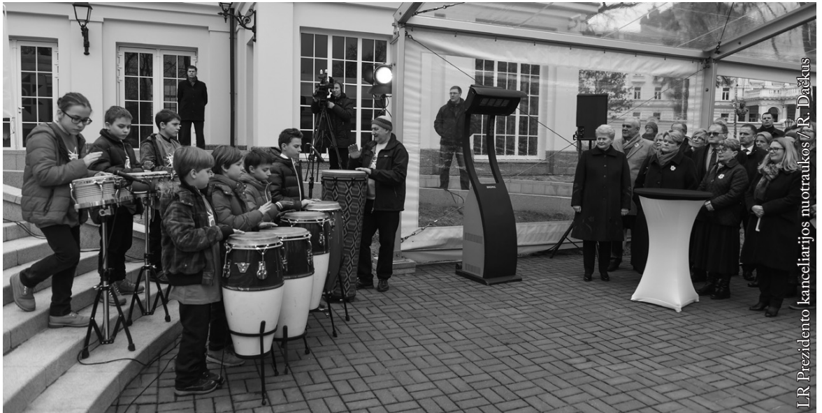
Prezidentė atidaro Valstybės pažinimo centrą