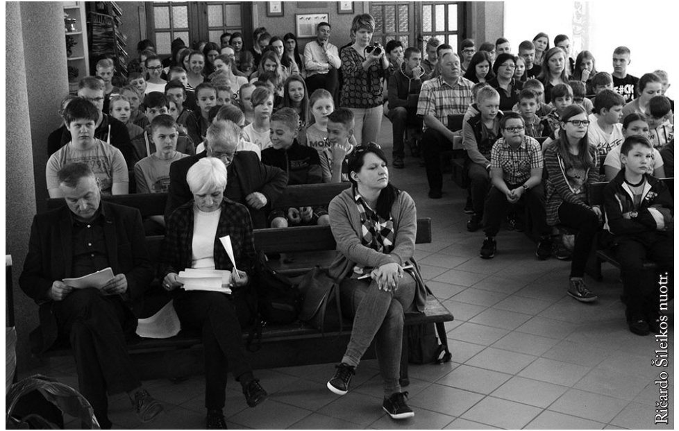
Poezijos pavasaris Punsko mokykloje