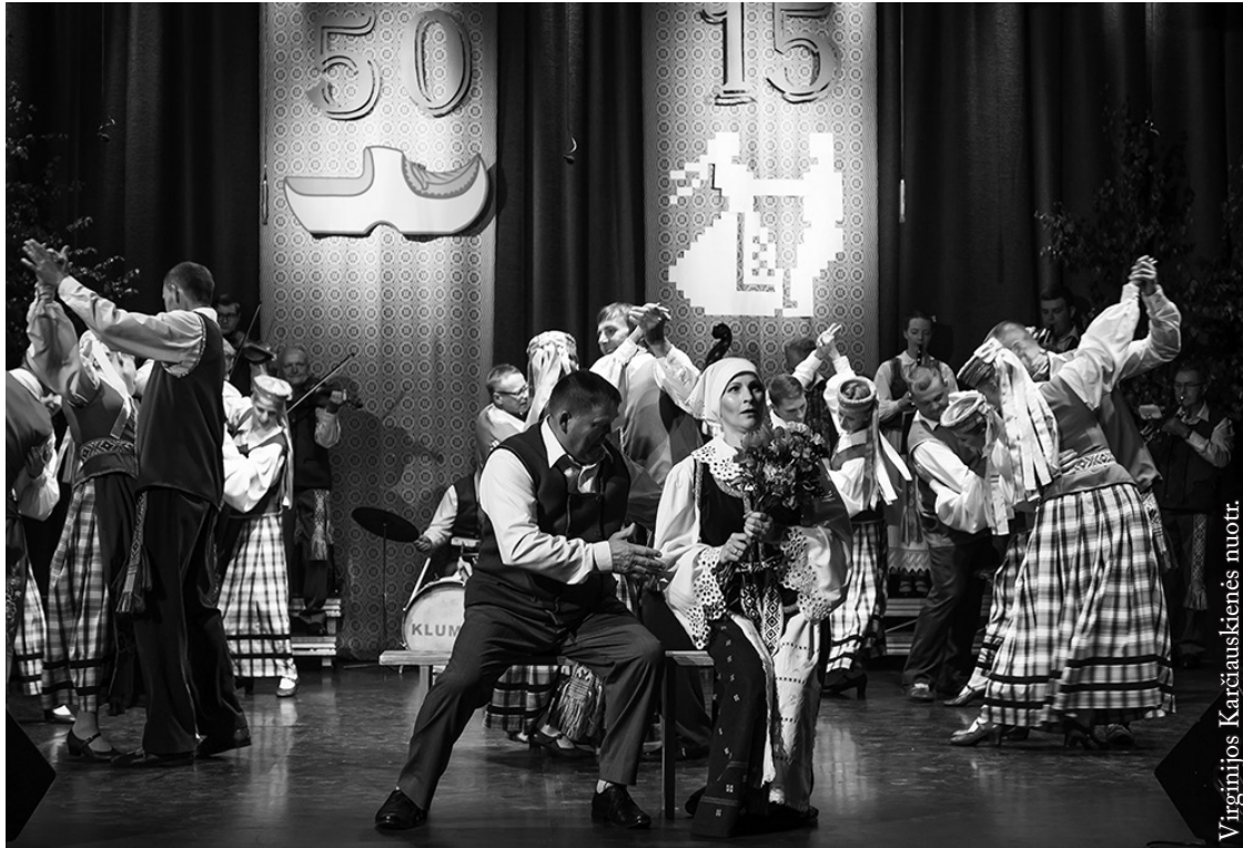
Šoka tautinių šokių grupė „Vyčiai“