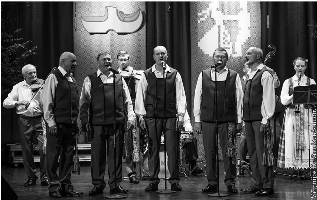
LKN kaimo kapela „Klumpė“ per jubiliejinį koncertą

„Klumpė“ nuo pat gyvavimo pradžios savo muzika ir dainomis žavėjo ne tik