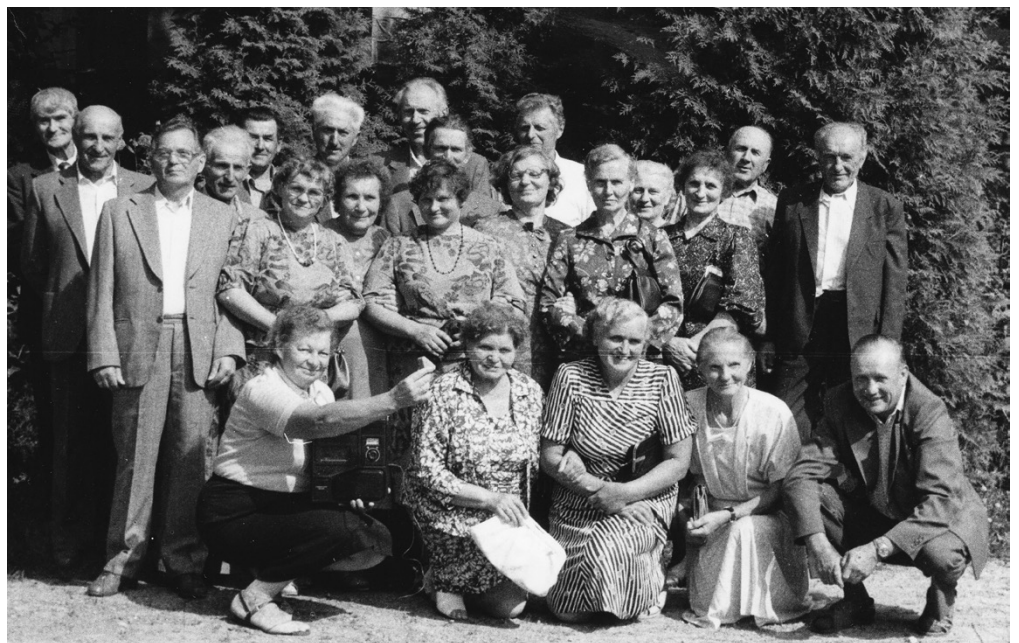
Punsko bažnytinis choras. 1989 m.

D. P.: Nenorėčiau girtis ar būti ne taip suprasta, bet man visi dalykai gerai sekėsi. 1955 m. atstovavau Suvalkų licėjui per studentų festivalį Varšuvoje (sakyčiau, išskirtinėm teisėm, kaip geriausia moksleivė). Kadangi kiekvienas dalykas gerai sekėsi, baigus