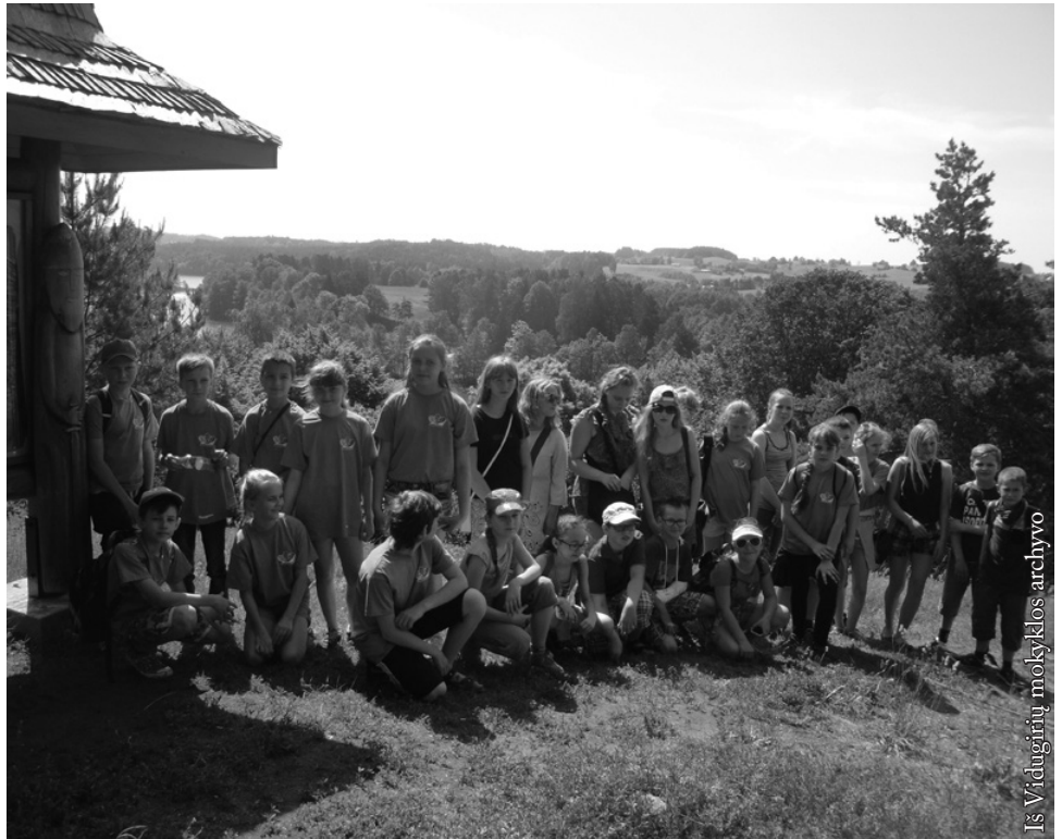
Šiurpilio piliakalnio viršūnėje

Man labai patiko Suvalkijos regioninis parkas, labiausiai – Šiurpilio piliakalnis. Šiltai dėkojame Seinų „Žiburio“ mokyklai už įdomią išvyką, smagiai kartu praleistą dieną. Buvo malonu susipažinti ir pabendrauti su naujais draugais.