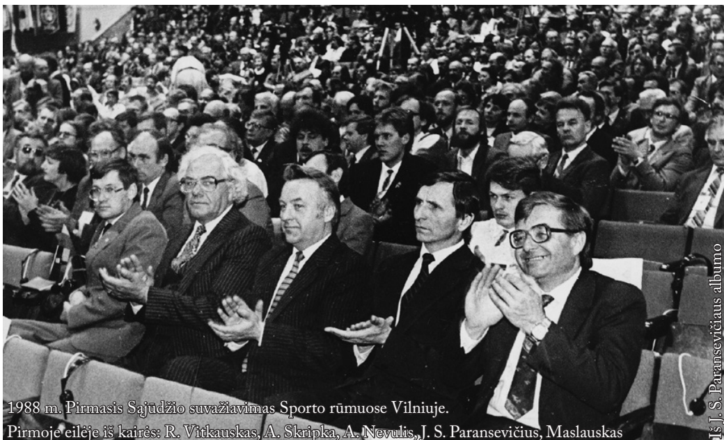
1988 m. Pirmasis Sąjūdžio suvažiavimas Sporto rūmuose Vilniuje.