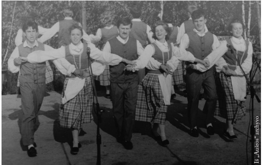
Iš „Aušros“ archyvo