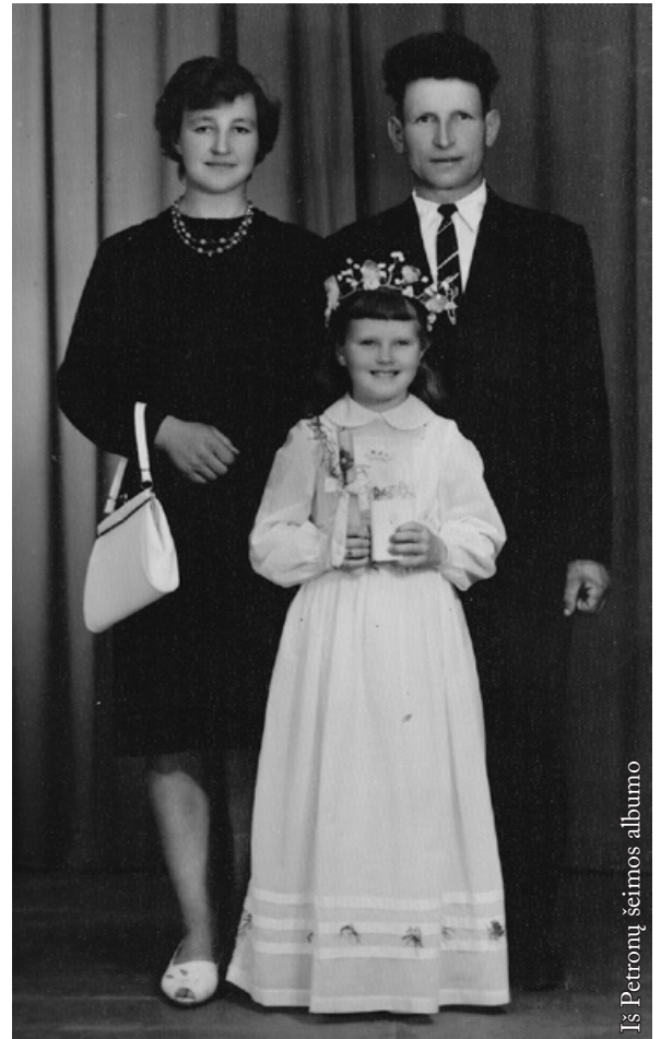
Iš Petronų šeimos albumo