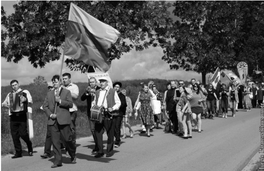
XXV klotimo teatrų festivalio eiseną