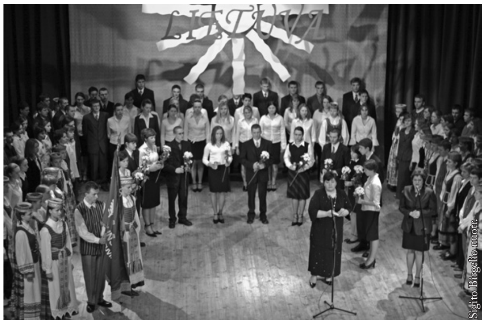
Kovo 11-osios minėjimas 2004 m.

I. B.: Palinkėčiau, kad mūsų licėjus gyvuotų kuo ilgiau. Kad dabar, turėdamas labai gerą sąlygą, išugdytų tokius jaunus žmones, kurie būtų visiškai subrendusios asmenybės, suvokiančios, kas jos esą.