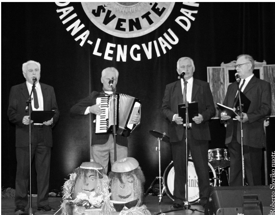
Lietuvių šv. Kazimiero draugijos vyrų kvartetas