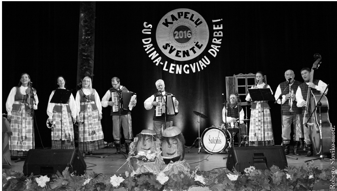
Seinų „Lietuvių namų“ liaudiškos muzikos kapela „Šalcinis“

Lietuvių kraičio skrynios per amžius buvo pilnos dainų. Mūsų protėviai gyveno dainų pasaulyje, kiekvienas darbas buvo lydimas jų skambesio. Su daina – lengviau darbe! Toks šūkis lydėjo XIV kapelių šventę, kuri įvyko š. m. spalio 1 d. Seinuose. Renginį rėmė Lietuvos Respublikos užsienio reikalų ir Lenkijos Respublikos vidaus reikalų ir administravimo ministerijos. Šventėje