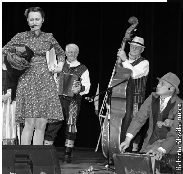
XIV kapelų šventės vedėjai