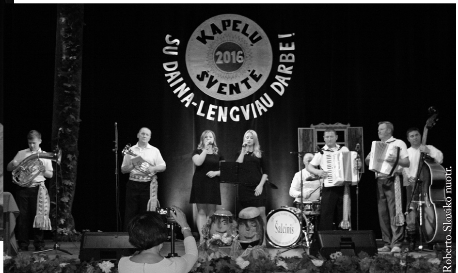
Vidugirių kaimo kapela