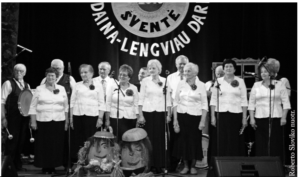
Punsko senjorų klubas „Tėviškės aidai“