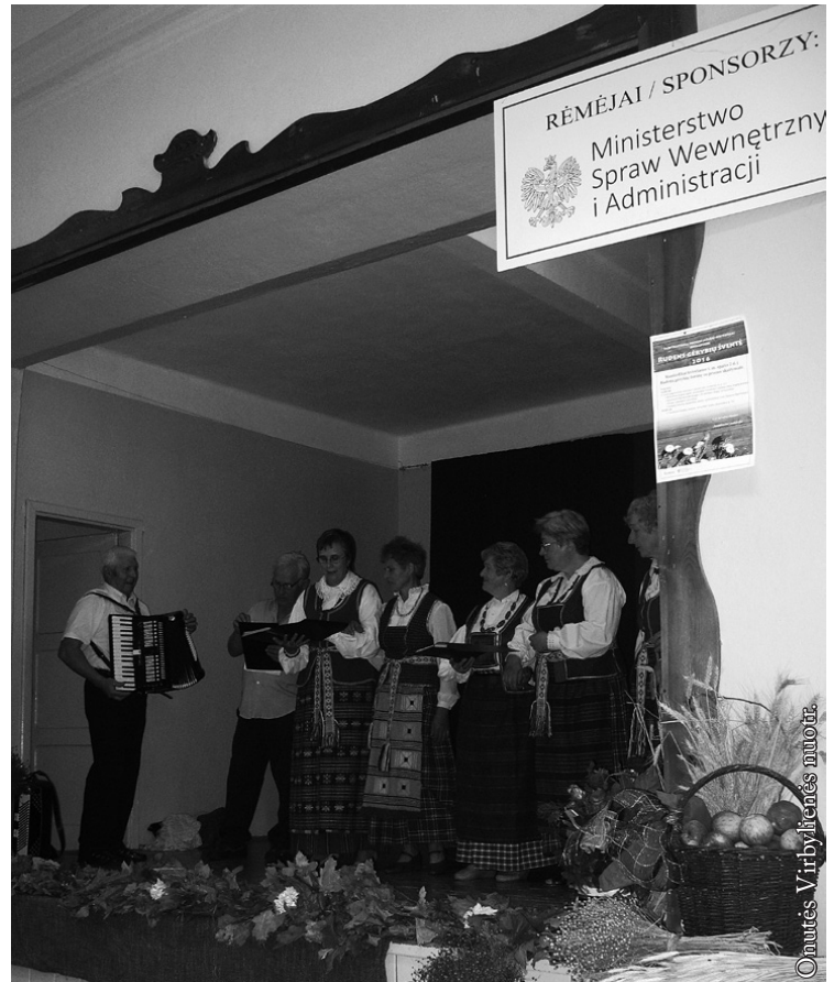
Seiniškių pasirodymo akimirka

(...) (Kazimieras Baranauskas „Rudens žaismas“)