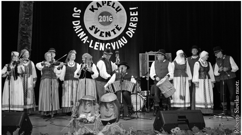
Šiaulių miesto kultūros centro folkloro ansamblis „Salduvė“

Dėkoju visoms kapeloms ir jų vadovams, scenografei, režisieriai, vaidintojams, įgarsintojui ir fotografui, o visų pirma – žiūrovams už pilną koncertinę salę, audringus plojimus, šiltus palaikymo žodžius ir šypseną. Gyvuokime ne kaip atskiri vienetai, o kaip viena didelė šeima – kad vaikai ir jaunimas kartu su vyresniaisiais grotų ir dainuotų lietuvių liaudies dainas.