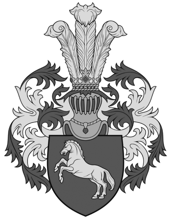
Aleksų giminės herbas

Saulėtą ir šiltą šeštadienį, rugsėjo dešimtosios rytą, iš visos Lietuvos į tradicinę – dešimtąją Aleksų giminės suvažiavimą Kaune (jis rengiamas kas dvejus metus) atvyko per penkiasdešimt giminaičių. Tarp jų buvo mokslininkų, visuomenės veikėjų, inžinierių, gydytojų, teisininkų, dailininkų, ekonomistų ir moksleivių. Čia iškilieji giminaičiai buvo prisiminti ir gražiai pagerbti. Visi bendravo, gėrė kavą, valgė sumuštinis, pyragaičius, ragavo įvairių rūšių tortus, dalijosi įdomiais prisiminimais bei numatė giminės tolimesnes gaires. Šiam Aleksų giminės susitikimui buvo