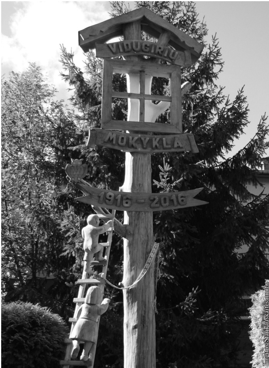
Vidugirių mokyklos 100-mečiui skirta skulptūra. Autorius Zenonas Knyza

traukiniu nuvažiavome į Suvalkus, ten pernakvojome pas Onutės tetą ir kitą dieną vėl traukiniu nuvykome į Augustavą. Ten išlaikėme egzaminus į pedagoginį licėjų ir traukiniu sugrįžome namo. Autobusai į Augustavą tada nevažiavo. Bet po atostogų mūsų keliai išsiskyrė. Tuomet įsikūrė Punske lietuviškas licėjus, kurį tėvų paraginta pasirinkau, o Onutė mokėsi Augustave.