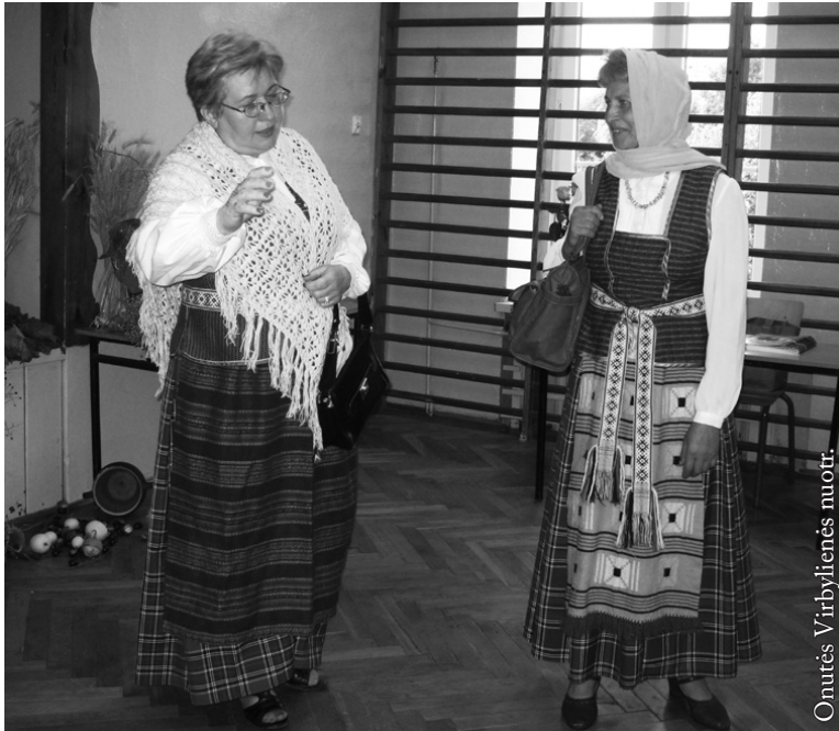
Seiniškių sceninis vaizdelis „Jubiliejus“