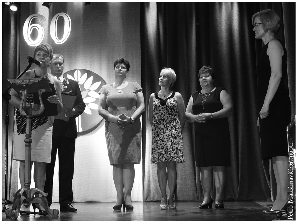
Punsko Kovo 11-osios licejaus 60-asis jubiliejus

Norėčiau tarti nuoširdžiai ačiū Lietuvos švietimo ir mokslo ministerijai, Užsienio reikalų ministerijai, Ugdymo plėtotės centrui, Užsienio lietuvių švietimo centrui, LR konsulatui Seinuose, Lietuvos aukštosios mokykloms už paramą, rodomą dėmesį. Taip pat Punsko savivaldybė ne kartą pagelbėjo esant finansinių sunkumų. Mokyklos jubilėjaus proga Punsko valsčius sukūrė stipendijų programą tautinių mažumų mokiniams, kurie mokslus tęsia Punsko licejuje. Pagal tą programą šiais mokslo metais kiekvienam pirmokui kas mėnesį skiriama 100 zł parama. Nuoširdžiausiai ačiū.