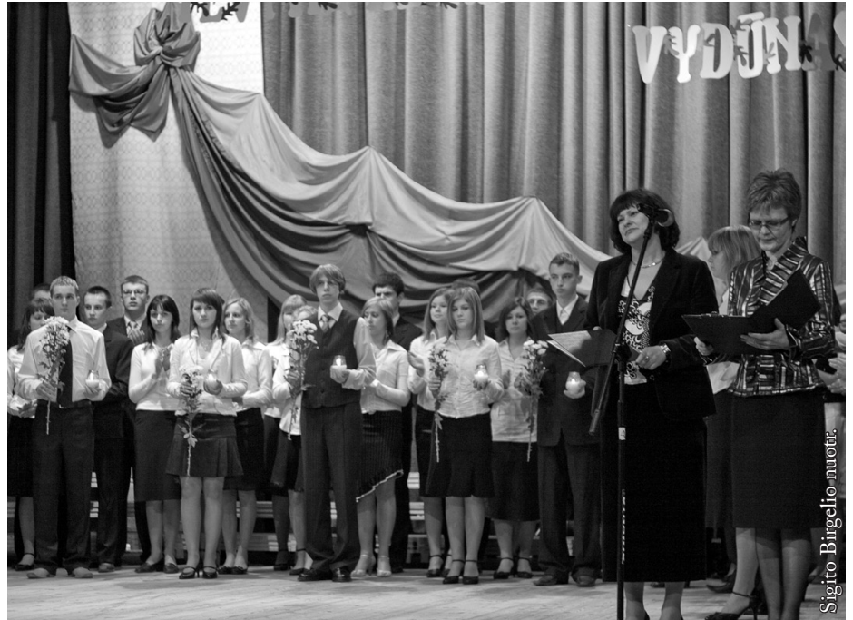
Kovo 11-oji 2008 m.

I. M.: Visi sunkumai kyla dėl to, kad mūsų mokykla yra maža ir ji ilgą laiką mažėjo dėl reformos ir demografijos. Tai lemia taip pat finansavimą. Tai gi neįmanoma užtikrinti norimo darbo krūvio tiek mokytojams, tiek aptarnaujančiam personalui. Nors kartais tas darbo krūvis ir nemažėja,