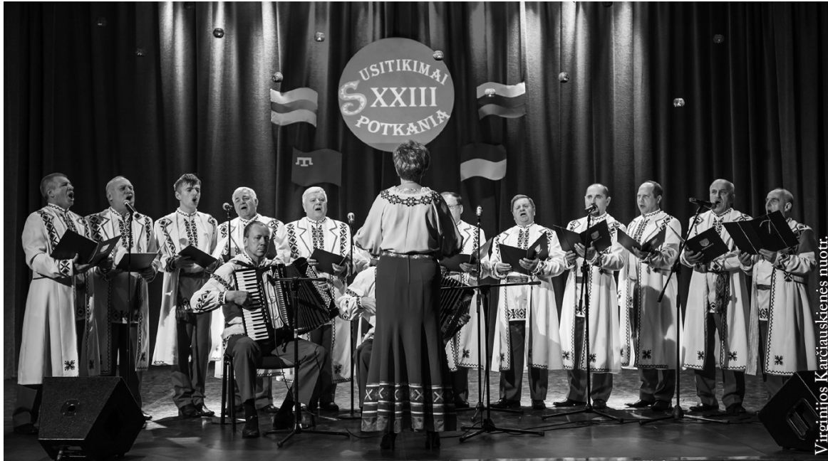
Baltarusių vyrų ansamblis „Kuranty“