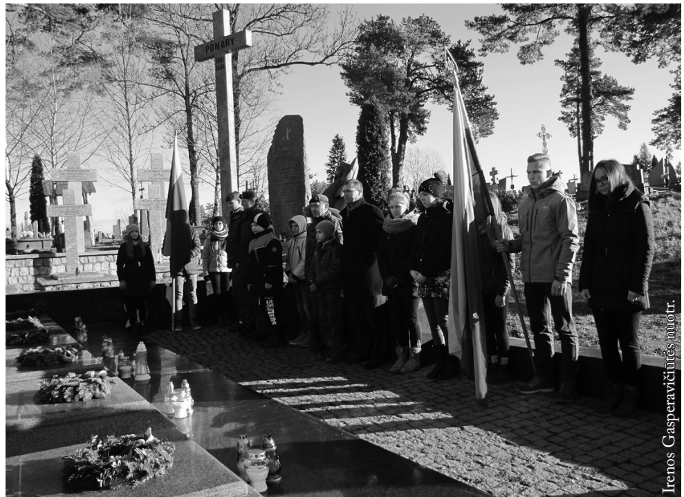
Prie Lietuvos savanorių kapų Berznyke

Punsko Dariaus ir Girėno mokyklos bei Seinų lietuvių „Žiburio“ gimnazijos mokinių grupės, nešinos Lietuvos valstybės vėliavomis, su Marijampolės kariais nuvyko į Berznyko kapines, čia prie Lietuvos savanorių kapų padėjo gėlių, uždegė žvakutes. Vėliau taip pat pagerbė