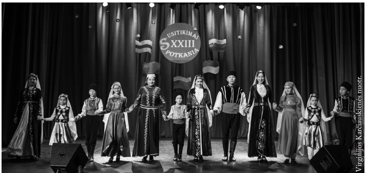
Totorių vaikų ir jaunimo ansamblis „Buńczuk“

Svečių gretose eilinį kartą galėjome grožėtis savo veiklos 17-metį atšventusiu Lenkijos totorių vaikų ir jaunimo ansambliu „Buńczuk“. Žodis „bunčiukas“ reiškia medinę lazda, užsibaigiančią rutuliu arba smaigaliu, papuoštu ašutais ir sidabriniais šepetėliais. Seniau jis buvo naudojamas Azijos tautų (turkų,