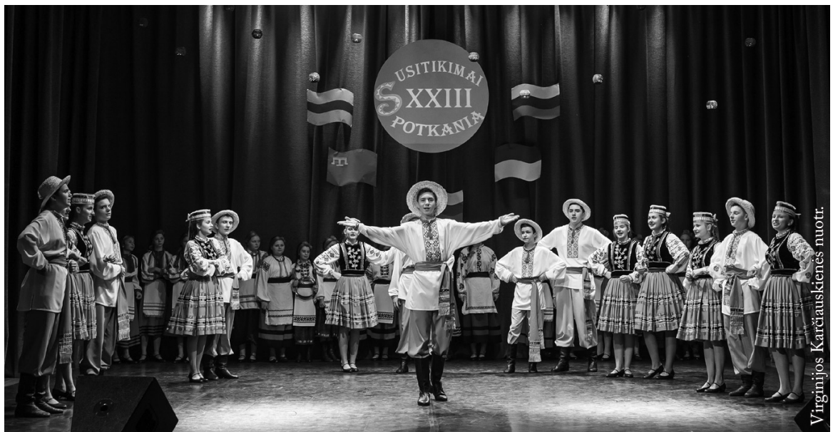
Ukrainiečių dainų ir šokių ansamblis „Ranok“

Baltarusių tautai šį kartą atstovavo vyrų ansamblis „Kuranty“, veikiantis Bielsk Podlaski kultūros namuose. „Kuranty“ baltarusių k. reiškia varpus. Vyrų balsai – tarsi varpai aidi ir skamba atliekant įvairių tautų dainas. Be baltarusiškų, jie dainuoja taip pat rusiškas, ukrainietiškas ir lenkiškas. Nors gyvuoja 13 metų, bet koncertavę daugiau kaip 250 kartų. Įdomu buvo stebėti, kaip 16 balsingų įvairaus amžiaus vyrų scenoje