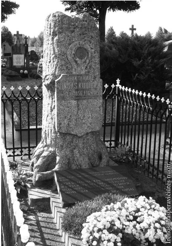
V. Kudirkos kapas Kudirkos Naumiestyje

Rašytojas susirgo džiova. Paastrėjus jos požymiams, turėjo vykti gydytis į Krymą bei Adrijos pajūrį. 1897 m. iš tolimų kraštų sugrįžo į mylimą tėvynę. Apsigyvenęs Naumiestyje, toliau kūrė, nors jo jėgos greitai seko. Norėjo kuo skubiau pabaigti suplanuotus darbus. Net paskutiniaus gyvenimo metais rūpinosi „Varpo“ reikalais, rašė straipsnius. Dr. Staugaitis pasakojo: „Kiek kartų teko man apsilankyti pas V. Kudirką, visados didžiai susigrauzdavau V. Kudirkos išvaizda: aukštam kambary, lovoje guli sudžiūvęs kaip šešelis žmogus, stiprios, milžiniškos dvasios su degančiomis akimis ir vis rašo ir rašo!“ Vos gyvas rašytojas dar atrodė rusams pavojingas – visą laiką jį sekė. Šis žymus žmogus, ligos pakirstas, mirė 1899 m. lapkričio 16 d. V. Kudirką palaidojo jam artimi žmonės Naumiesčio kapinėse. Ant kapo buvo pastatytas nukirsto medžio formos akmeninis paminklas, ant kurio