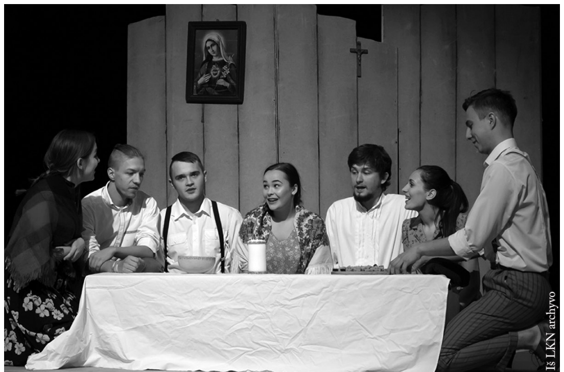
„Kregždės“ spektaklis „Obuolių kritimas“ Birštone

Tegul Kalėdų naktį tylią Atsėlina vaikystės pasaka šventa, O dovanų krepšelyje tebūna: Ramybė, santarvė ir sveikata!