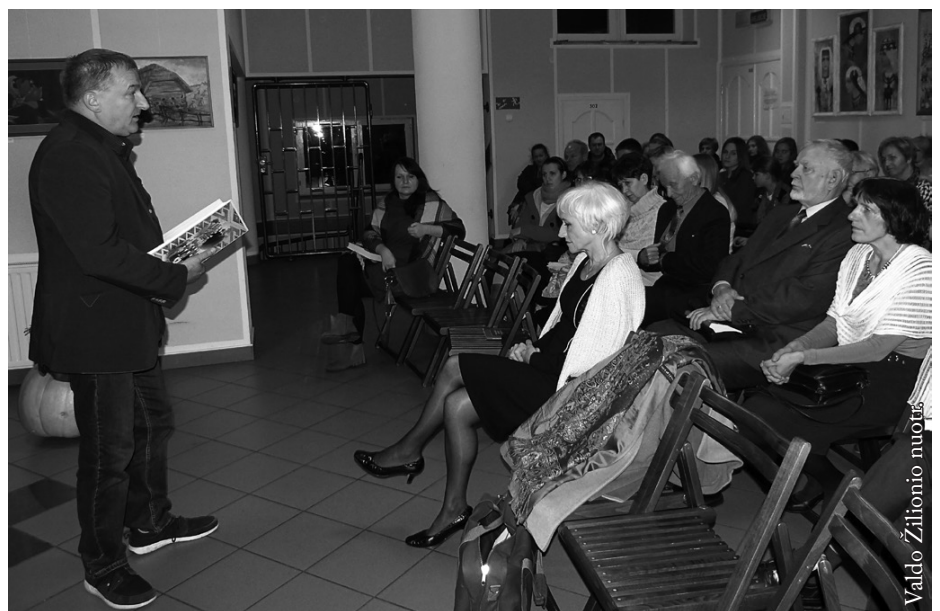
Rudens literatūriniai skaitymai