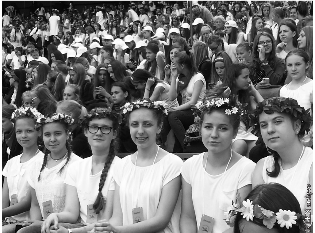
„Balsynėlis“ Moksleivių dainų šventėje Vilniuje

Tarptautiniame vaikų teatrų festivalyje), Pietų Korėjoje – „Vyčiai“ (dalyvavę Pasaulio šokių festivalyje).