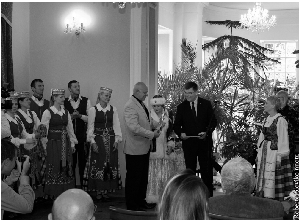
Palenkės vaivadijos maršalkos apdovanojimai

Didžiausiu pasirodymų ar koncertų skaičiumi gali pasigirti kapela „Klumpė“ (21 kartas), „Vyčiai“ (16 kartų), „Kregždė“ (11 kartų), „Dzūkija“ (9 kartai), „Puniukai“ (8 kartai), „Kregždutė“ (8 kartai), klijimo teatras (7 kartai), „Jotva“ (6 kartai), „Balsynėlis“ (4 kartai), dramos studija (2 kartai). Visi ansambliai kaip paprastai atsakingai, nuosekliai ir su didele meile ruošėsi LKN 60-mečio jubiliejui, „Jotva“ šiais metais atšventė savo 65-metį, kapela