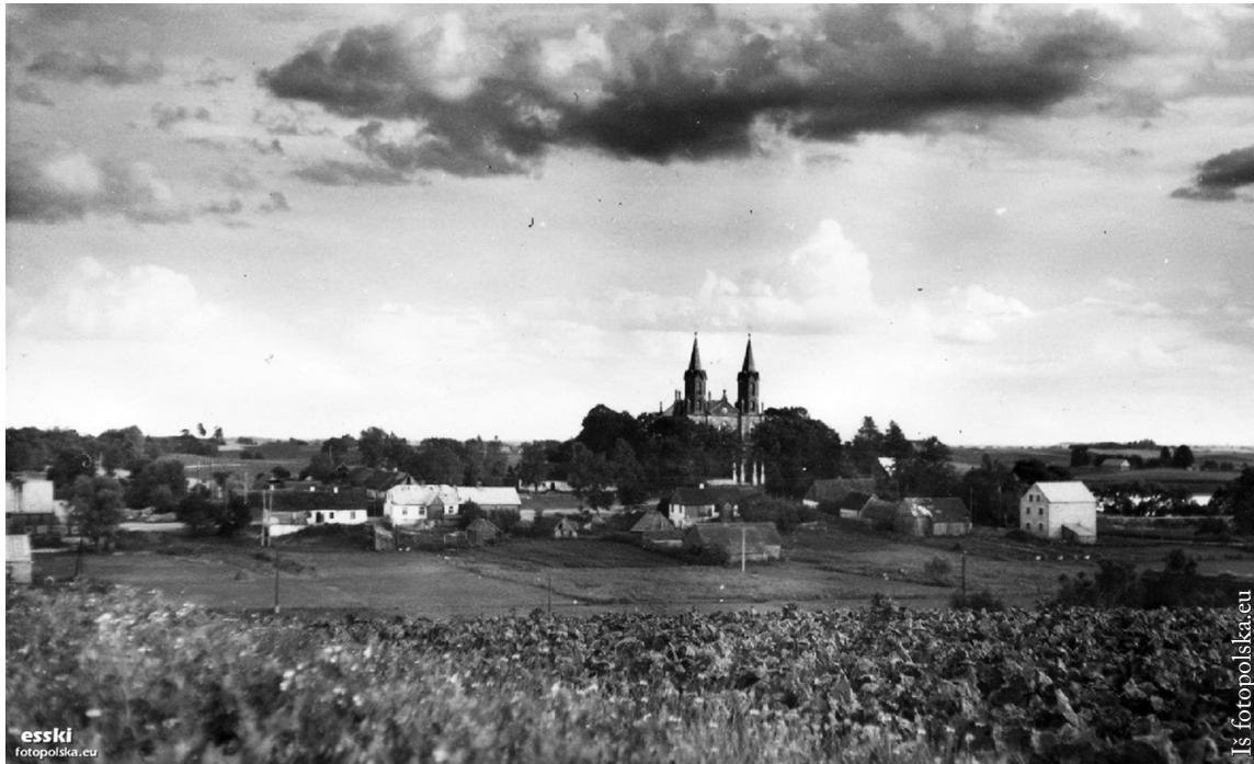
Punkskas 1970 m.

technika. Aš dar prisimenu arklių traukiamą vežimą geležiniais ratais, kuriuo teko ir važiuoti ankstyvoje vaikystėje. Prisimenu, kaip labai kratė važiuojant „bruku“ (akmenimis grįstu keliu). Paskui atrodė labai patogiu važiuoti „gumoviakais“, arklių traukiamais vežimais guminiiais ratais. Dar apie 1970-uosius metus į Punksko bažnyčią daug žmonių suvažiuodavo arkliais, sustatydavo juos, pririšę prie vežimų ar rogių, akmenimis grįstoje aikštėje prie bažnyčios, aikštėje prie dabartinių šarvojimo namų ar kitose vietose. Tuo metu daug žmonių į bažnyčią, ypač į rytines šv. Mišias, suvažiuodavo autobusu. Jis, kol atvažiuodavo iki Vaitakiemio, būdavo toks perpildytas, kad dažnai ir nesustodavo mūsų stotelėje. O jei pasitaikydavo geras vairuotojas, sulipdavom visi, bet stovėdavom susigrūdę kaip silkės statinėje.