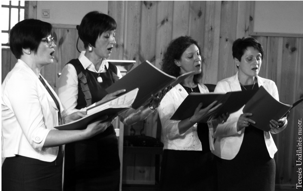
Kvartetas Žagarių bažnyttéléje Bažnytinių chorų šventės metu

per Sumą. Liūdnoka buvo per rytines šv. Mišias – per jas giedodavo pats vargonininkas, šiek tiek padedamas susirinkusių bažnyčioje žmonių. Norėjosi, kad bent psalmes kas nors padėtų vargonininkui giedoti, kad kunigui dažniau kas patalkintų skaitant skaitinius.