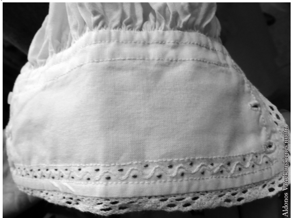
Marškinių rankogalio pavyzdys

Lietuvos nacionalinio muziejaus atstovai sudarė galimybę aplankyti parodą, kurioje puikavosi visų Lietuvos regionų eksponatai. Mane labiausiai domino dzūkiškas kostiumas. Nors aplinkiniuose muziejuose nemažai senovinės aprangos detalių, bet visą kostiumą surasti būtų sunkoka. Tautinio kostiumo specialistai pabrėžė, kad per mažai turime eksponatų muziejuose, todėl nereikia jų tik atkurti, galima interpretuoti, bet nenuklystant nuo regiono ypatumo.