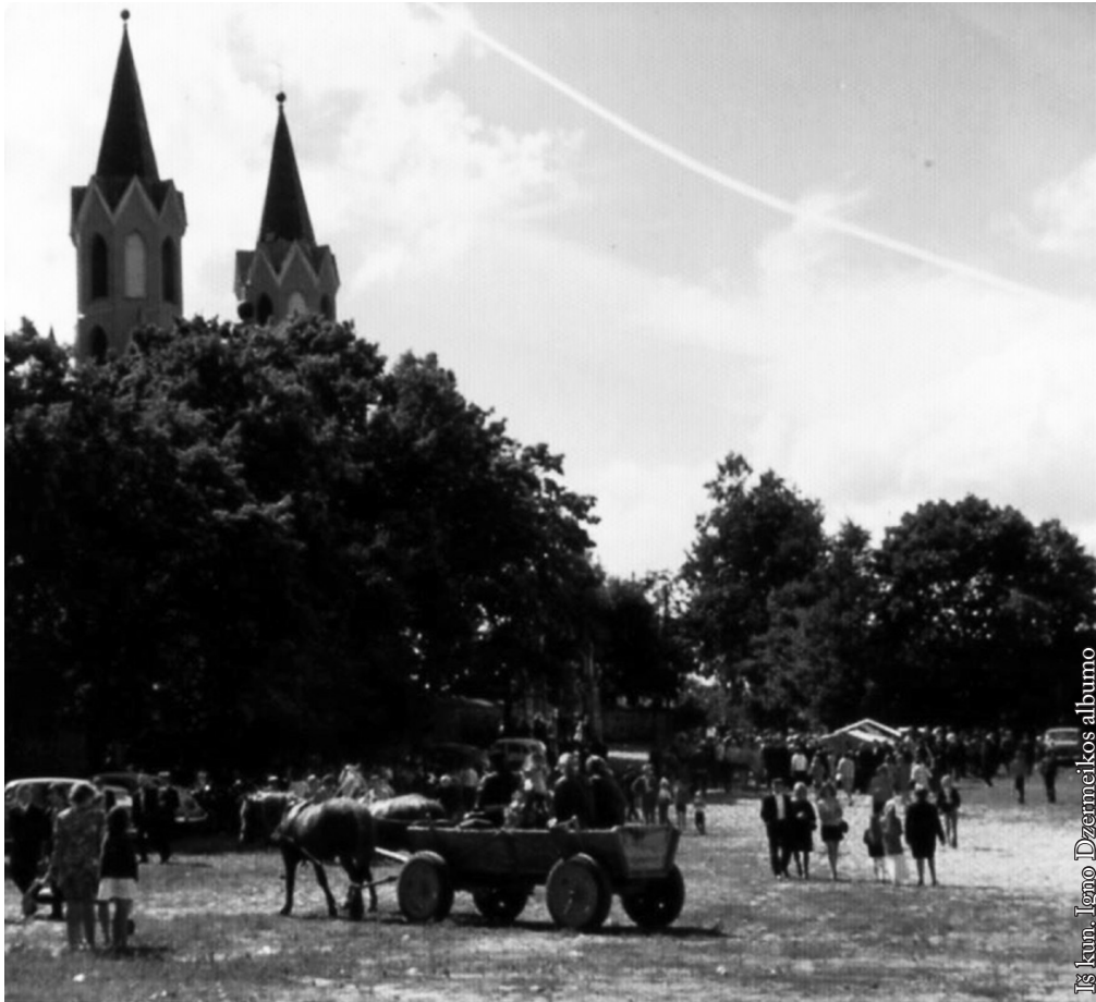
Punksas 1975 m.