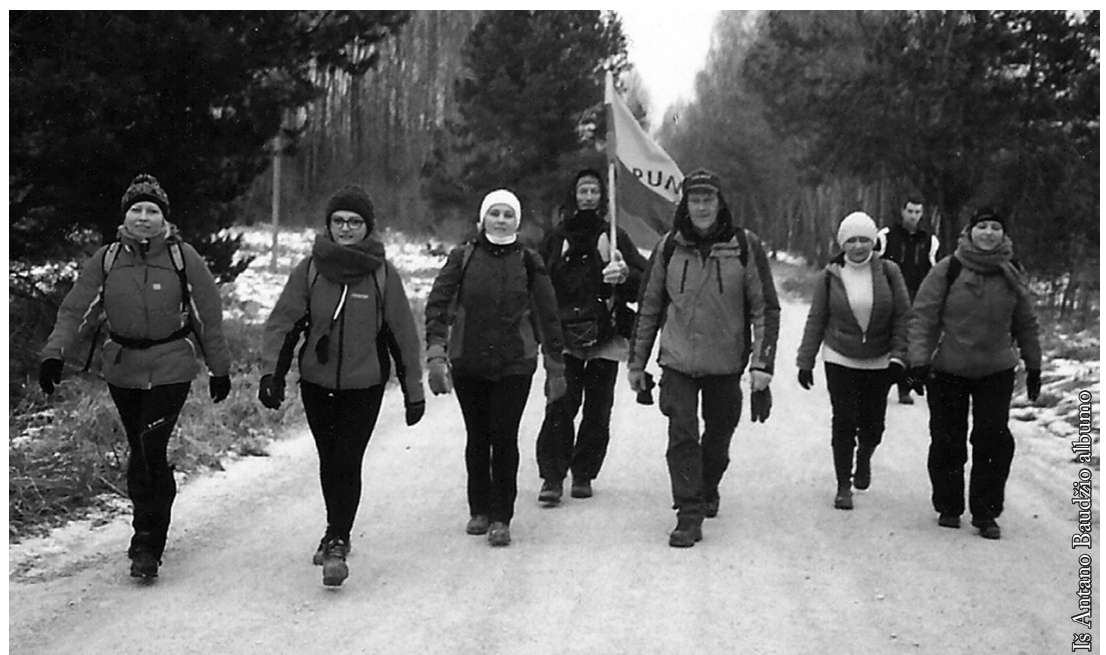
Punska krašto žygeiviai

Punskiečiai ragina ir kitus dalyvauti žygiuose. Plačiau pasiskaityti apie kasmet rengiamus Lietuvoje pėsčiųjų žygius galima interneto tinklalapyje https://pesciujuzygiai.lt/ .