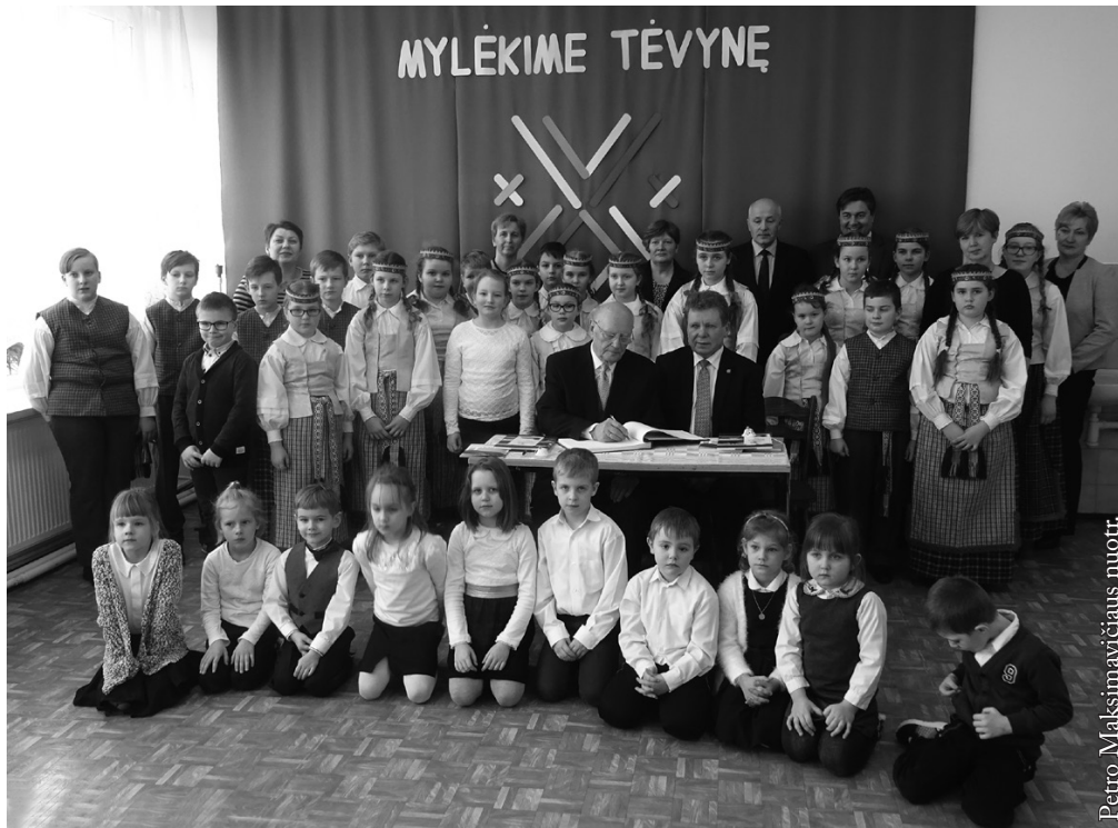
Signatarai Vidugirių mokykloje

Kovo 11-ąją minime kitaip. Gal todėl, kad daugelis mūsų šią datą prisimename arba buvome tų įvykių liudininkai. Su Vasario 16-osios akto signatarais jau negalime pasikalbėti, pasiklausti jų liudijimų apie ano meto įvykius, ko nors paklausti. Kitaip yra su Kovo 11-osios akto signatarais. Daugelis jų dar gyvi ir aktyviai dalyvauja Lietuvos valstybės gyvenime, kiti rašo memuarus, užsiima visuomenine veikla. Galime juos pasikviesti, pabendrauti, išgirsti jų pasakojimus apie tai, kaip Lietuvaėjo valstybingumo atkūrimo link.