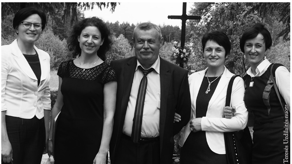
Žagariuose 2016 m. gegužės mėn.