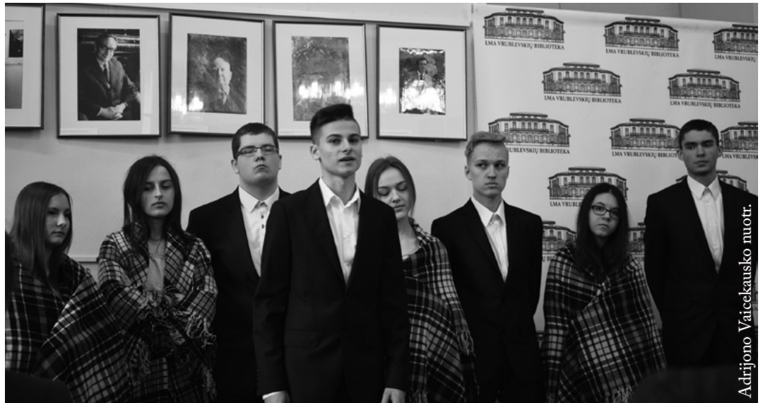
„Žiburio“ trečiųjų poetinė kompozicija „Sugrįžimai“

B alandžio 28 d. nuo 11 iki 15 val. Lietuvos mokslų akademijos Vrublevskių bibliotekoje, Žygimantų g. 1, vyko Knygų dovanų mugė ir susitikimai su bibliotekos bičuliais. Šiais metais knygas dovanavo Bažnytinio paveldo muziejus, Lietuvos nacionalinis muziejus, Nacionalinis muziejus Lietuvos Didžiosios Kunigaikštystės valdovų rūmai, Lietuvių kalbos institutas, Lietuvių literatūros ir tautosakos institutas, Lietuvos istorijos institutas, Lietuvos mokslų akademija, Gamtos tyrimų centras, Lietuvos rašytojų sąjungos leidykla, LMA Vrublevskių biblioteka, Punsco „Aušros“ leidykla. Knygų dovanų mugės lankytojų aukos už patikusias knygas buvo skirtos Seinų „Žiburio“