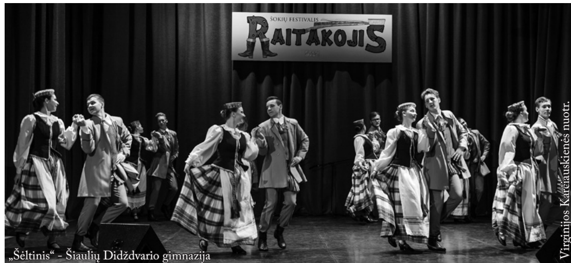
„Šėltinis“ – Šiaulių Didždvario gimnazija