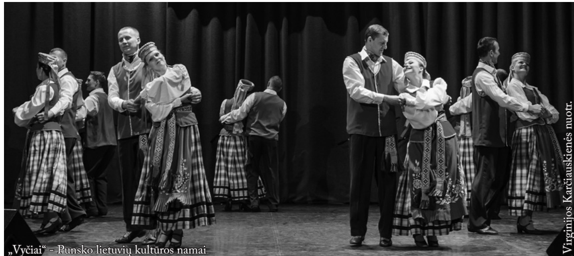
„Vyčiai“ - Punsko lietuvių kultūros namai