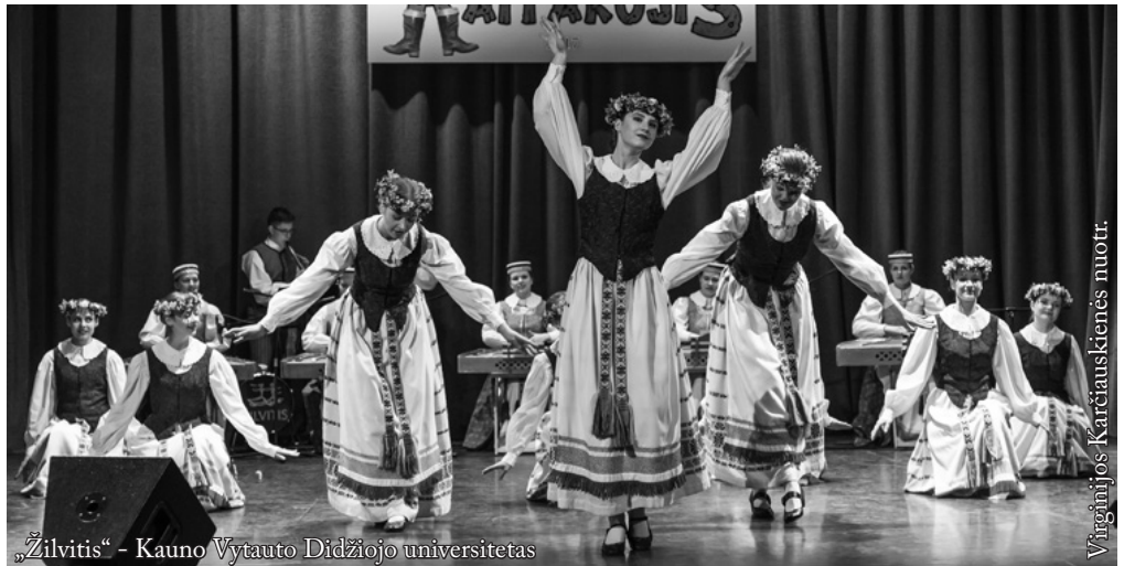
„Žilvitis“ - Kauno Vytauto Didžiojo universitetas