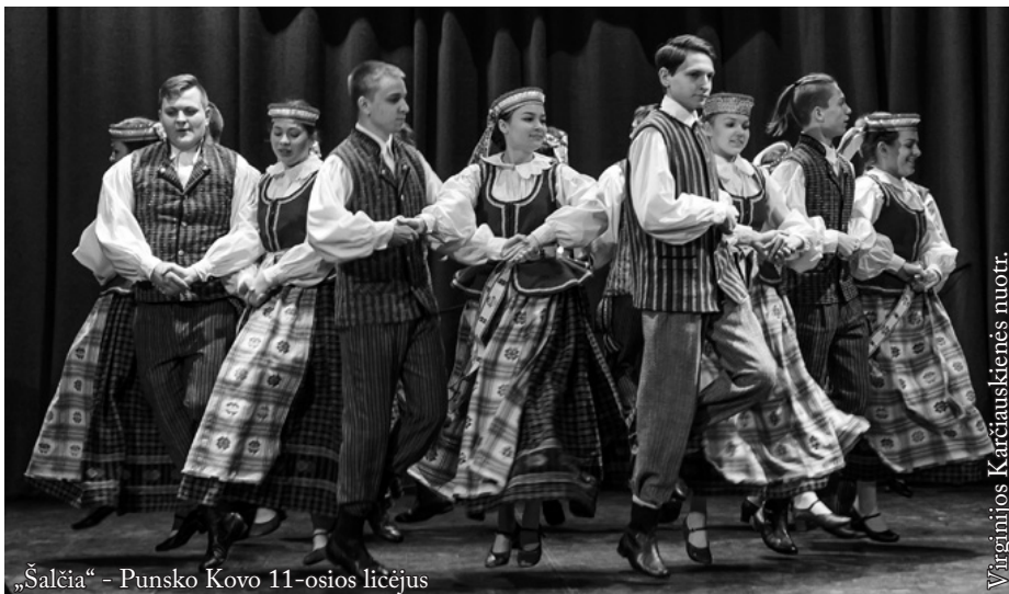
„Šalčia“ – Punsko Kovo 11-osios licejus