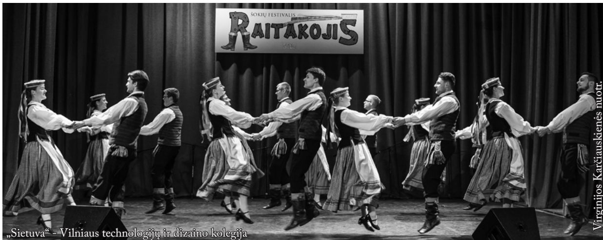
„Sietuva“ - Vilniaus technologijų ir dizaino kolegija