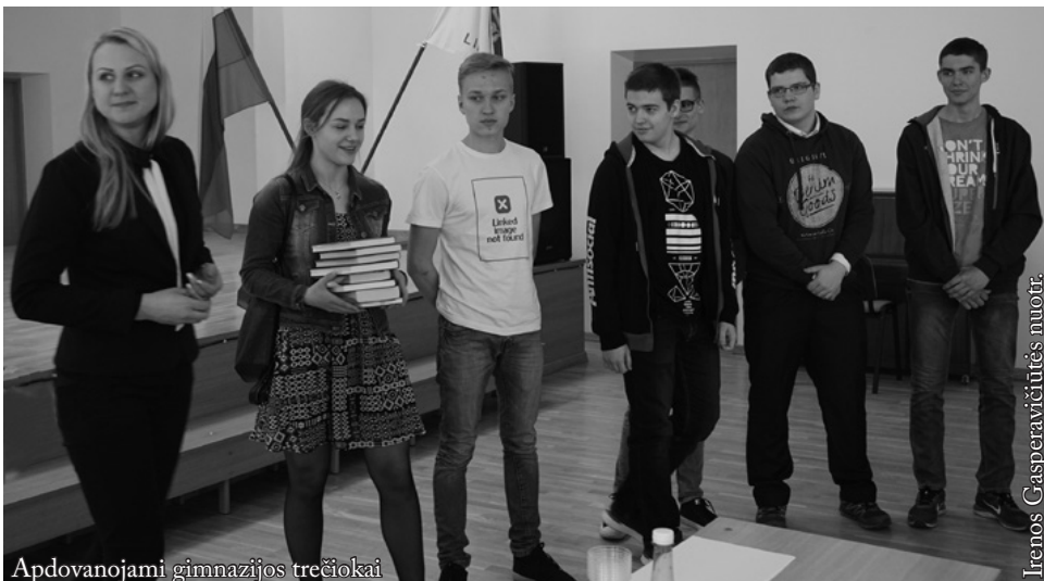
Apdovanojami gimnazijos trečiokai

Sveikiname visus laureatus ir dalyvius. Visada verta išbandyti savo jėgas.