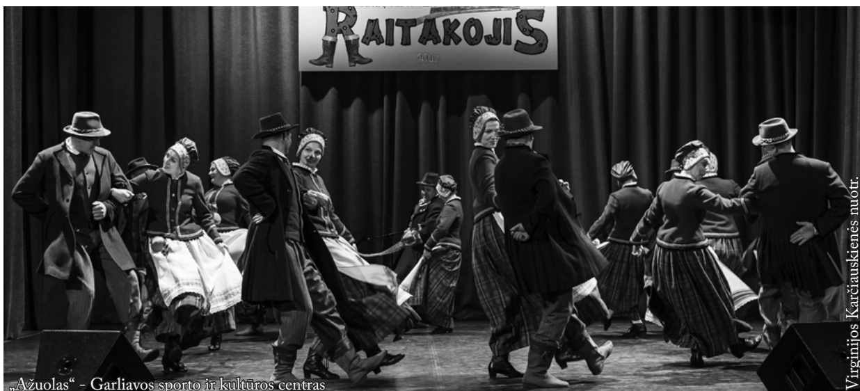
„Ažuolas“ - Garliavos sporto ir kultūros centras