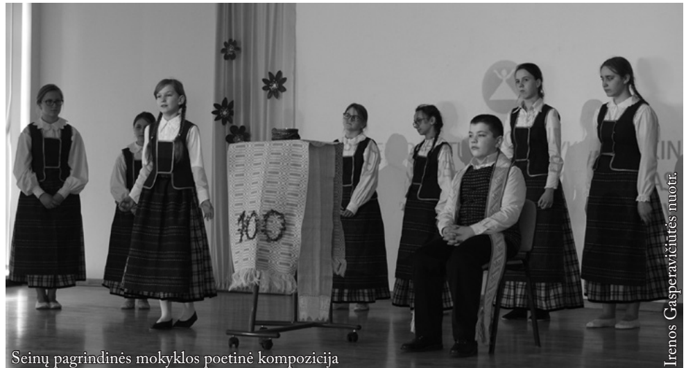
Seinų pagrindinės mokyklos poetinė kompozicija

Šiais metais konkurse dalyvavo Pelesos, Rimdžiūnų, Rygos lietuvių, Punsko Dariaus ir Girėno gimnazijos, Seinų lietuvių „Žiburio“ mokyklos, Vilniaus lietuvių namų, Karaliaučiaus krašto šeštadieninių