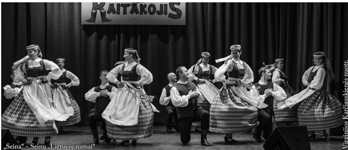
„Seina“ - Seinų „Lietuvių namai“

Festivalį rėmė Lenkijos vidaus reikalų ir administravimo ministerija bei Lietuvos Respublikos užsienio reikalų ministerija.