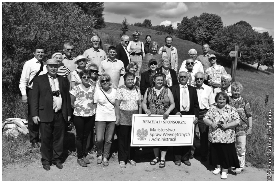
Išvykos „Jotvingių keliais“ dalyviai

Renginio rėmėja – Lenkijos Respublikos vidaus reikalų ir administravimo ministerija.