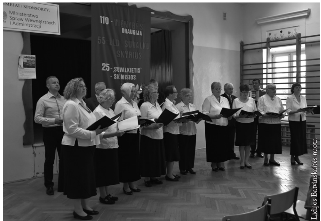
Suvalkų ansamblis „Ančia“