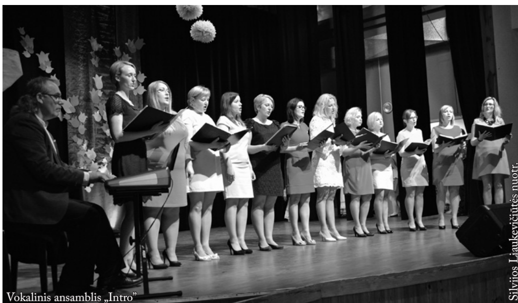
Vokalinis ansamblis „Intro“