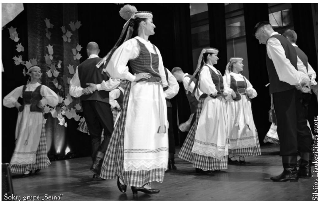
Šokių grupė „Seina“