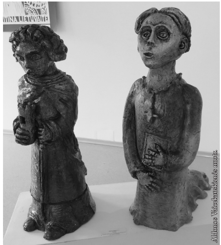
I vietos laureato skulptūros