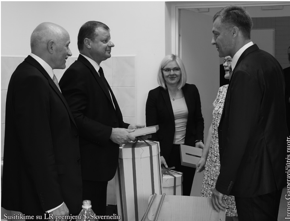
Susitikime su LR premjeru Š. Skverneliu