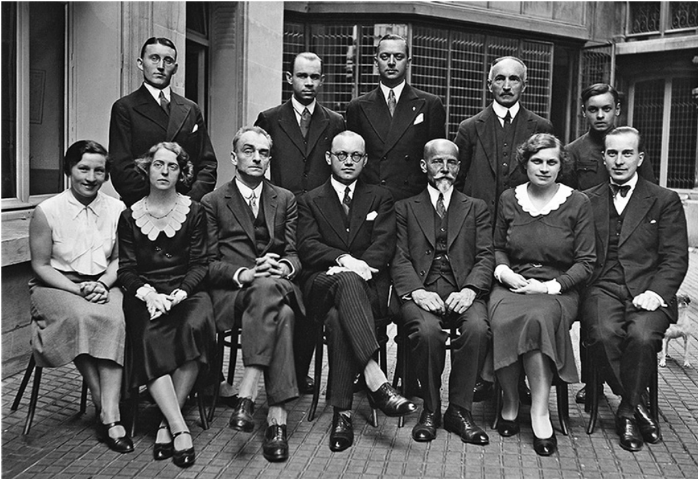
Lietuvos atstovybė Paryžiuje. Oskaras Milašius trečias iš kairės

tarptautinis Lietuvos valstybingumo pripažinimas, susitarimas su Lenkija dėl sienų, Lietuvos narystė Tautų Sąjungoje, Klaipėdos krašto prijungimas prie Lietuvos. Ne viską pavyko išspręsti. Ypač daug darbo teko atlikti 1920 m. rudenį, kai Seinuose, Berznyke ir gretimose apylinkėse vyko lenkų ir lietuvių ginkluoti susirėmimai. O. Milašius, siekdamas sustabdyti karinius veiksmus, įteikė ne vieną griežtą notą Tautų Sąjungai ir Santarvės vyriausybėms. Vilniaus klausimas Milašiui buvo pats skaudžiausias, asmeninis. Prancūzijos valdžios argumentai dėl Vilniaus tautinės sudėties buvo nuolatos linksniuojami. Tačiau Milašius stengėsi apeiti siauras etnines pozicijas ir įrodinėjo Lietuvos geopolitinę svarbą ir vaidmenį Rytų Europoje. Pasak jo, Lietuva gali būti visavertė ir patikima valstybė tik su Vilniumi. Tai Milašius rašė savo notose, kartojo pokalbiuose Prancūzijos užsienio reikalų ministerijoje. Tai buvusi nuosekli pozicija, kurią Milašius jau buvo išsakęs 1918 m. prancūzų žurnale „L’Affranchi“. Straipsnyje, pavadintame „Lietuva“, jis aptarė