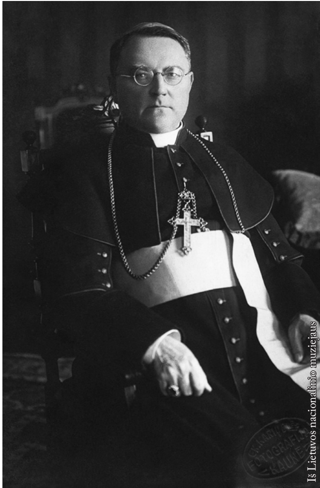
Vysk. Justinas Staugaitis

kaip 350 straipsnių. Sukūrė trijų tomų romaną „Tiesiu keliu“. Rankraštyje liko jo apysaka „Tarp jausmų ir pareigos“.