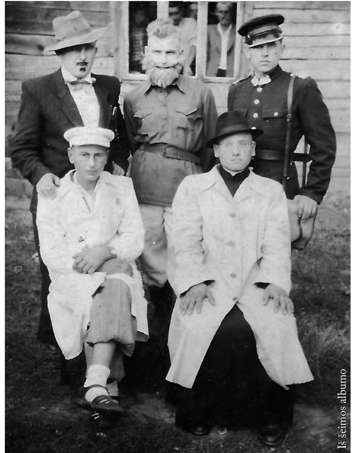
Is šeimos albumo