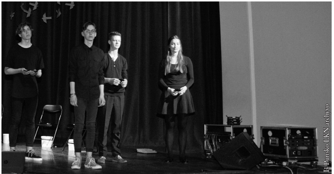
10-ojo tortadienio akimirka

Kregžde, kregždute, Nunešk ant sparnų svajonę mažutę. Skriski, plasnoki, Ne liety, o džiaugsmą padovanoki.