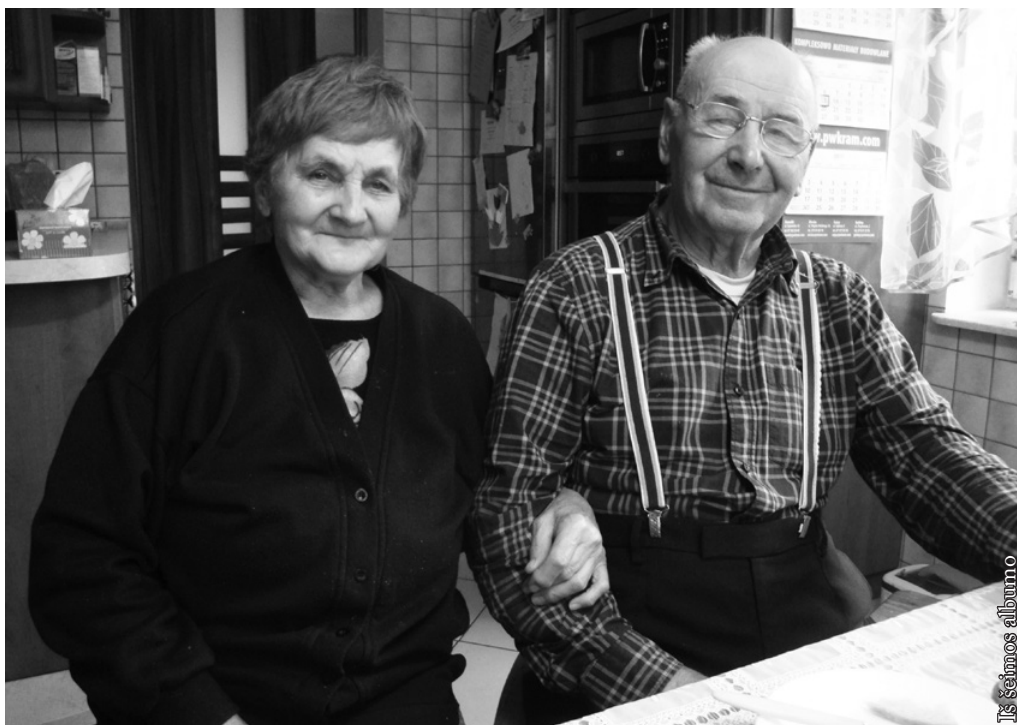
Is šeimos albumo