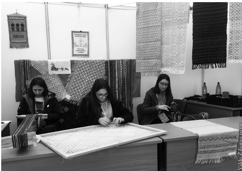
Punsko licėjaus moksleivės