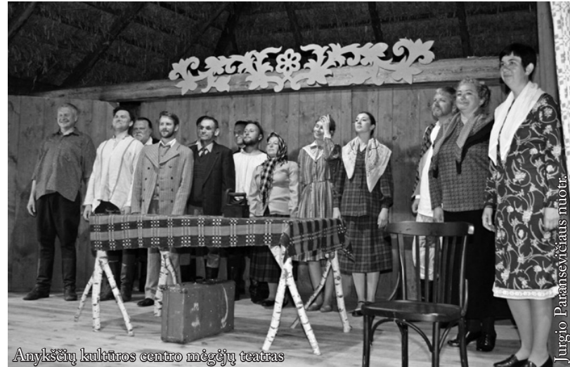
Anykščių kultūros centro mėgėjų teatras