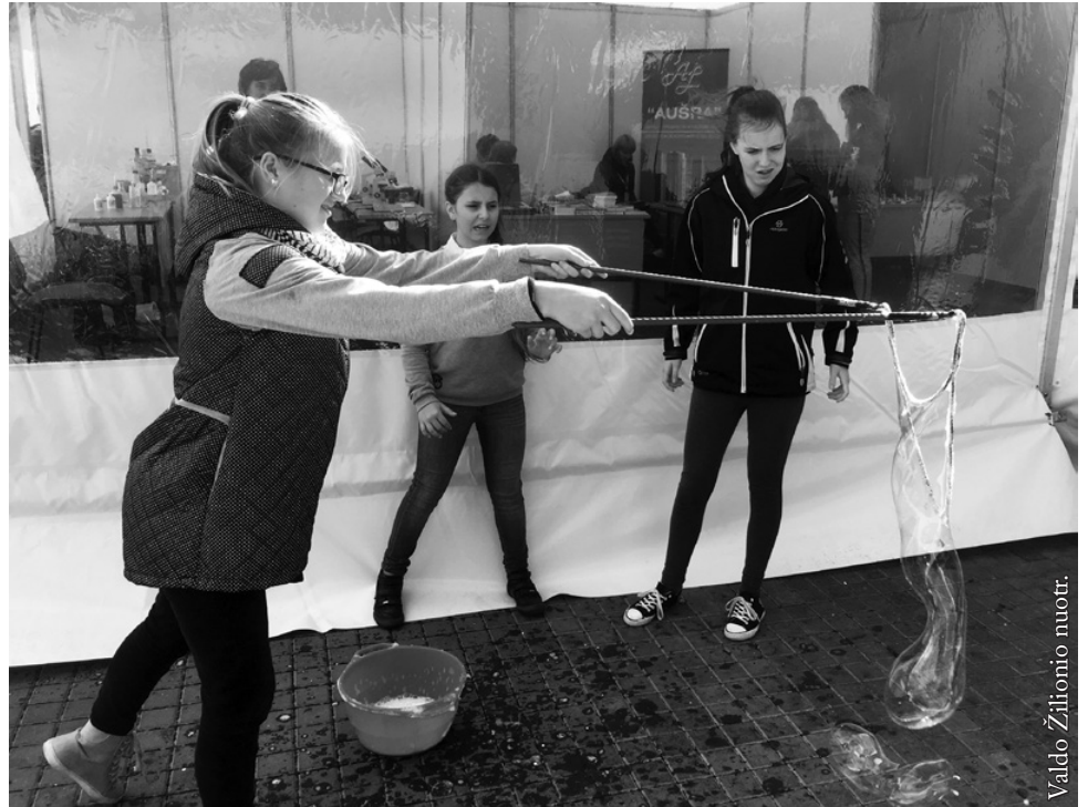
Seinų lietuvių „Žiburio“ septintokės

Ne tik demonstravome eksperimentus, bet ir lankėme kitus festivalio dalyvius. Mums labai patiko virtualiosios realybės akiniai, nes su jais galima buvo „leisti parašutu“,