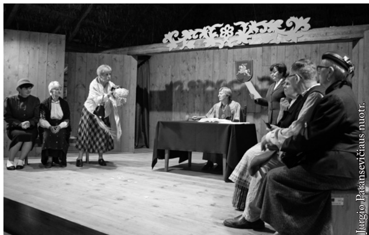
Jurgio Paransevičiaus nuotr.