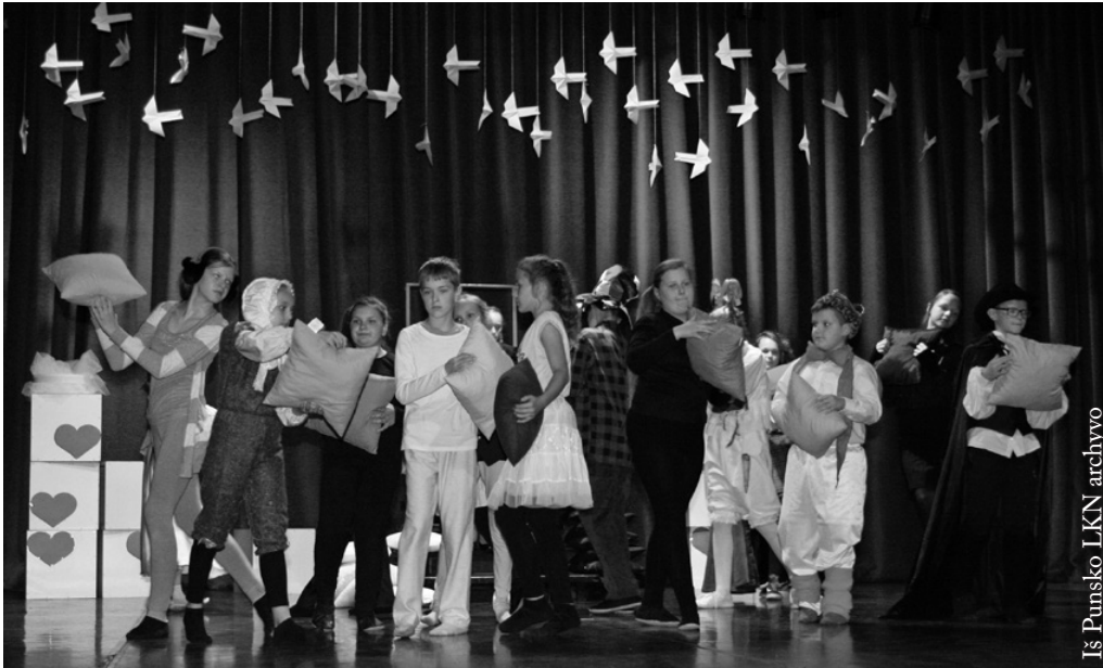
„Kregždutė“ 10-ajame tortadienyje