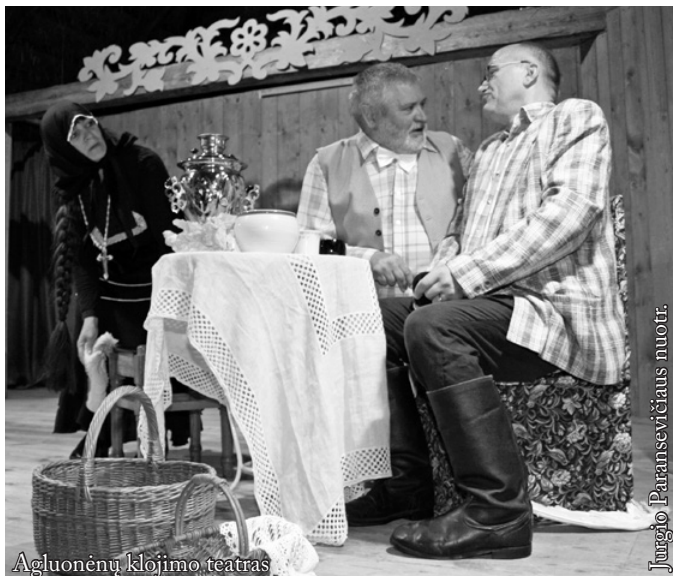
Agluonėnų klotimo teatras