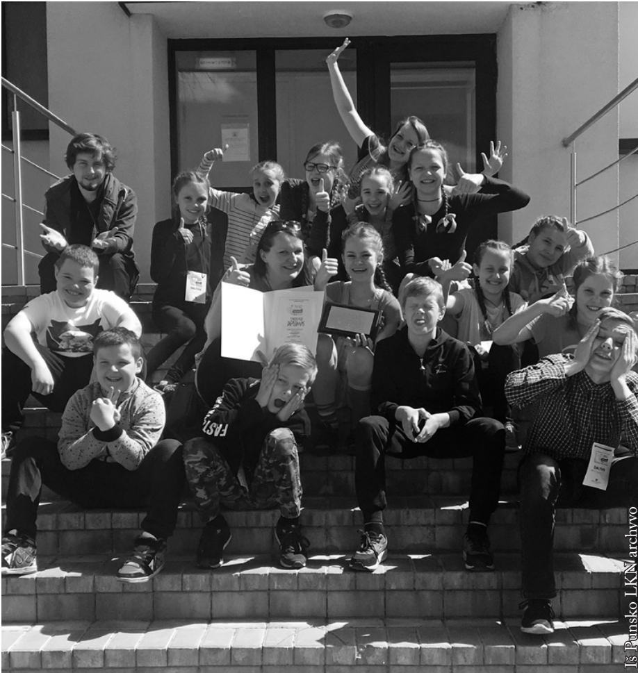
„Kregždutė“ su diplomu Rokiškyje