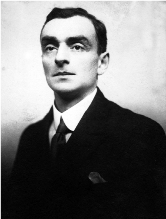
Oskaras Milašius 1920 m.