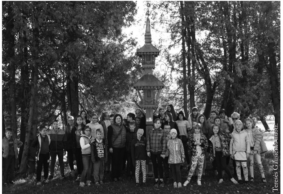
Užulėnyje prie 2016 m. PLB dovanoto kopyltstulpio Lietuvos prezidentams

Kita diena buvo skirta Lietuvos istorijai. Aplankėme Ukmergės kraštą. Buvome Lietuvos pirmojo prezidento Antano Smetonos gimtinėje ir jo rezidencijoje Užulėnyje. Labai patiko