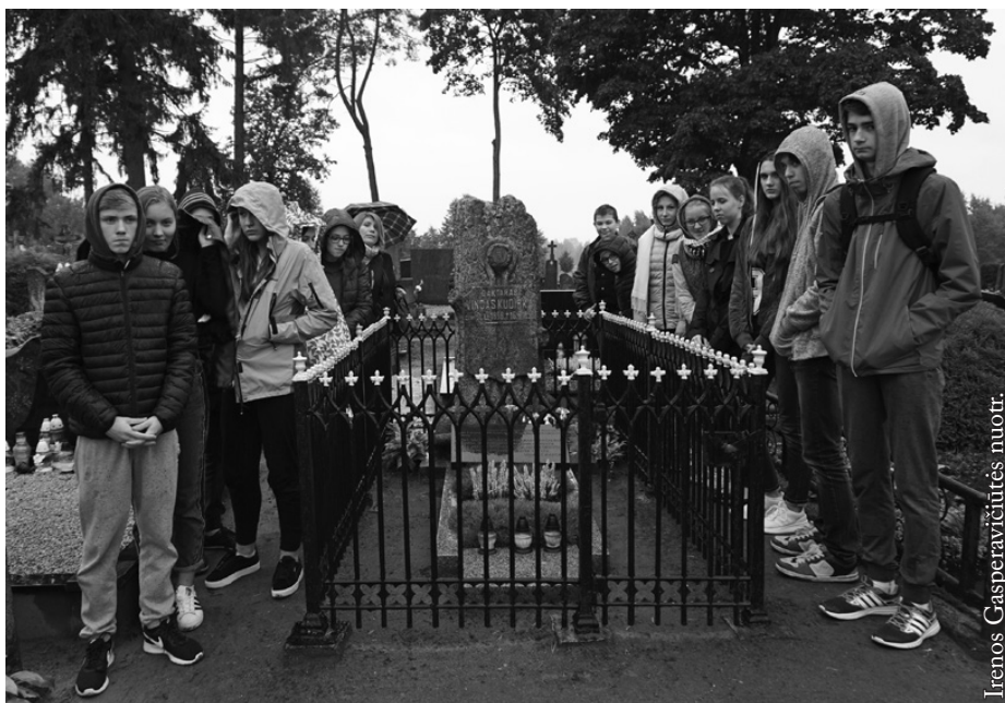
Prie Vinco Kudirkos kapo

Pirmiausia gidė parodė mums muziejaus salę, pasakojančią apie miesto praeitį, paaiškino, kad seniau miestas vadinosi Vladislavovas nuo jį įkurdinusio karaliaus vardo, tik vėliau tapo Naumiesčiu, o dar vėliau (jau po Vinco Kudirkos mirties) – Kudirkos Naumiesčiu. Šalia miesto teka Širvintos upelis, kuris skiria Rusiją (Kaliningrado sritį) nuo Lietuvos. Kadaise čia ėjo Rytprūsijos siena, o kitoje upelio pusėje stovėjęs miestas Širvinta su gražia mūrine bažnyčia ir