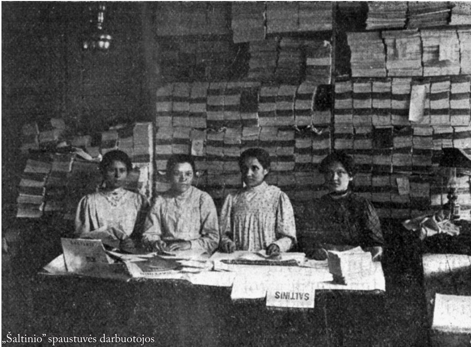
„Šaltinio“ spaustuvės darbuotojos