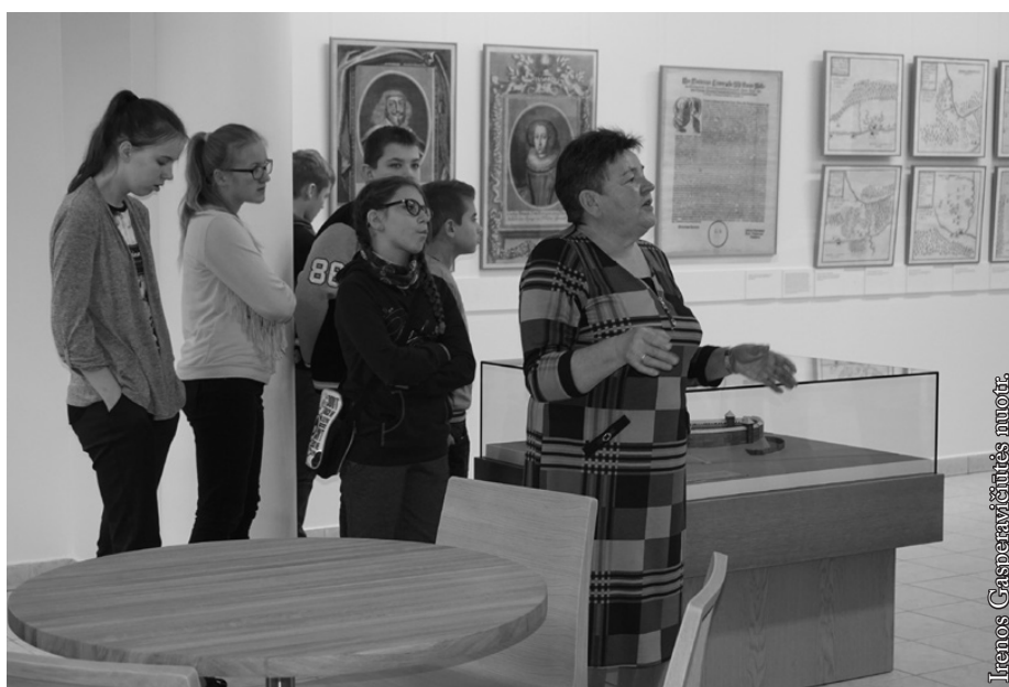
Vinco Kudirkos muziejuje

Jei kas dar nesate buvę Kudirkos Naumiestyje, nuvykite. Jis visai netoli, o įdomu pamatyti garsaus varpininko paminklą, muziejų ir jo kapą. Nesigailėsite.