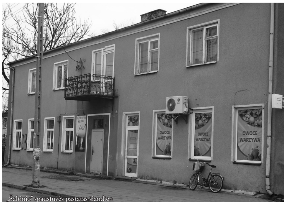
„Šaltinio“ spaustuvės pastatas šiandien

Nors pats J. Staugaitis to neakcentuoja, Seinai suvaidino jo gyvenime didelį vaidmenį. Seinų kunigų seminarija buvo jam svarbi ir reikšminga tautinio atgimimo kalvė. Čia formavosi jo mąstysena, pasaulėjauta, pasiryžimas dirbti Dievui, tautai ir tėvynei. Nepaprastai svarbus buvo laikmetis, praleistas Seinuose redaguojant „Vadovą“. Jis subrandino J. Staugaitį dirbti politinį darbą, aukotis atgimusiai Lietuvai.