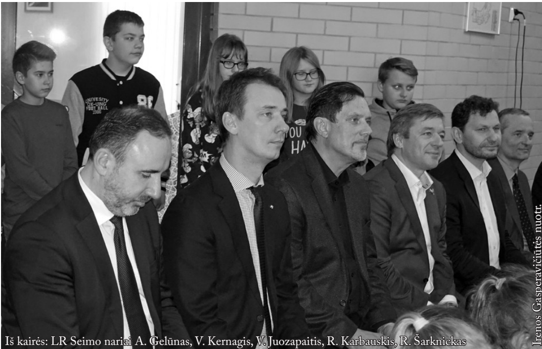
Iš kairės: LR Seimo nariai A. Gelūnas, V. Kernagis, V. Juozapaitis, R. Karbauskis, R. Šarknickas