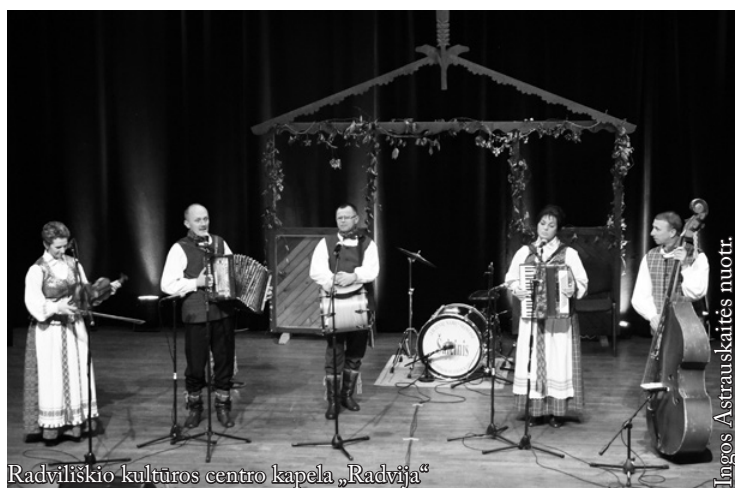
Radviliškio kultūros centro kapela „Radvija“