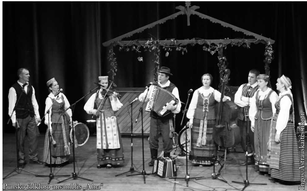
Punsko folkloro ansamblis „Alna“