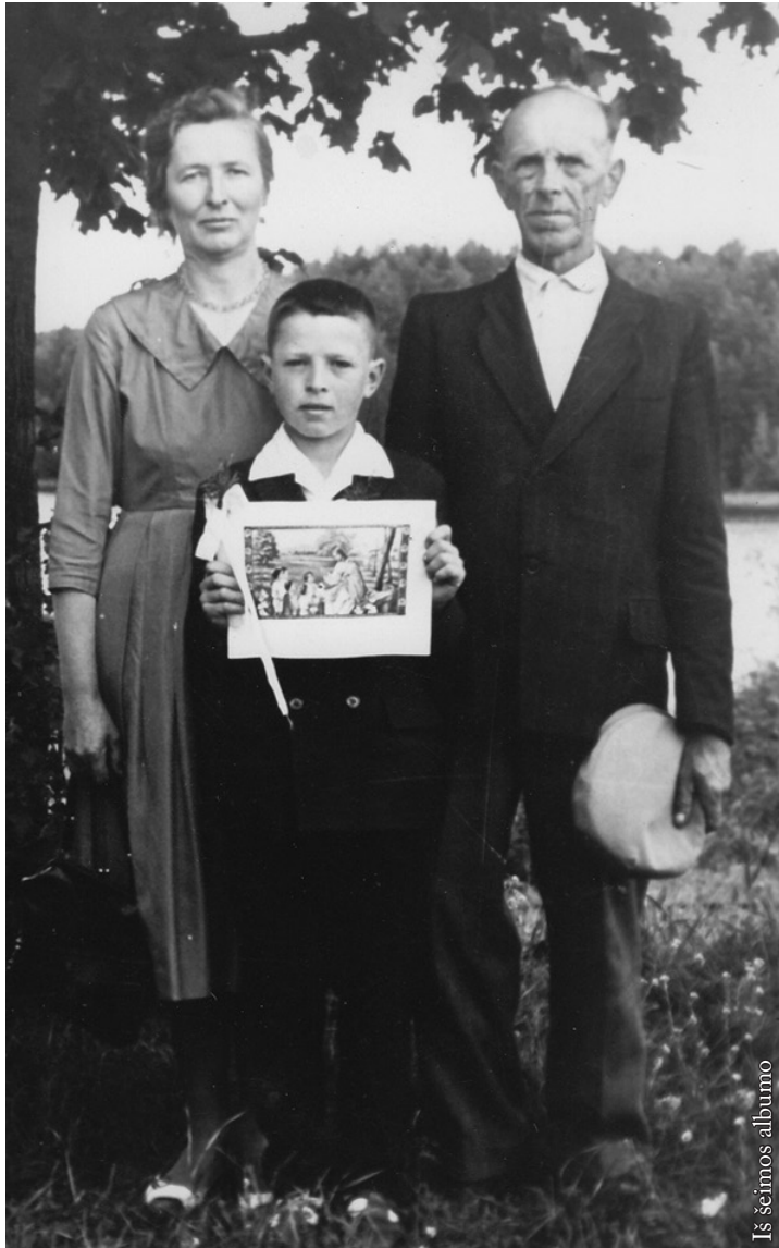
Iš šeimos albumo