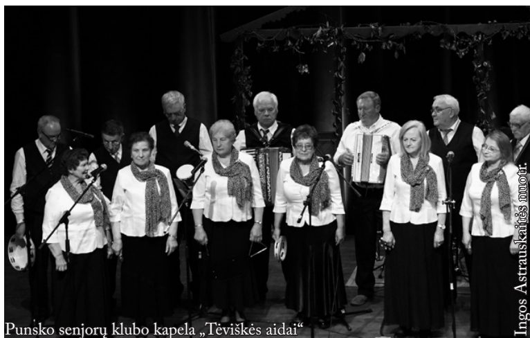
Punsko senjorų klubo kapela „Tėviškės aidai“