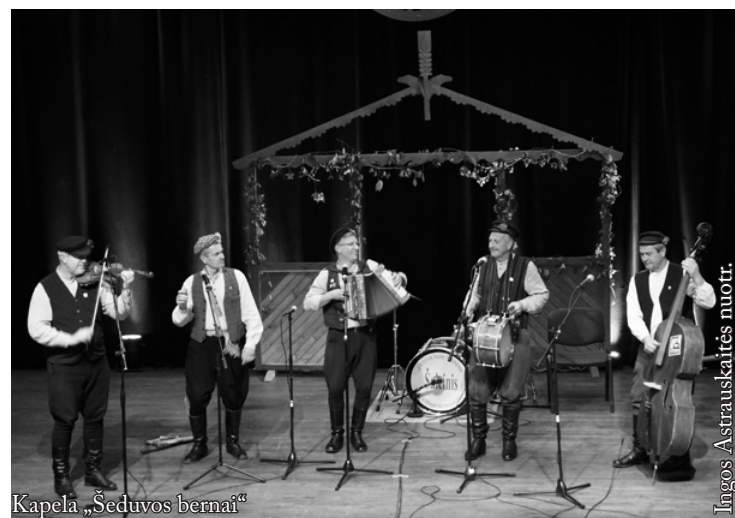
Kapela „Šeduvos bernai“