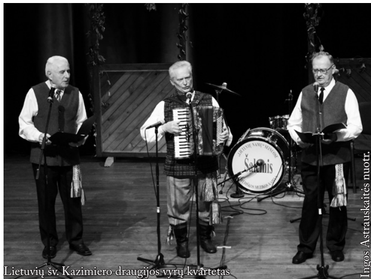
Lietuvių šv. Kazimiero draugijos vyrų kvartetas