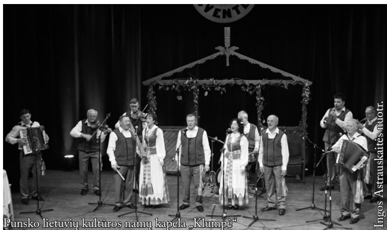
Punsko lietuvių kultūros namų kapela „Klumpė“