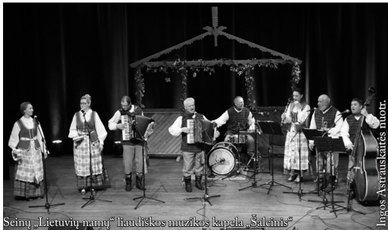
Seinų „Lietuvių namų“ liaudiškos muzikos kapela „Šalcinis“