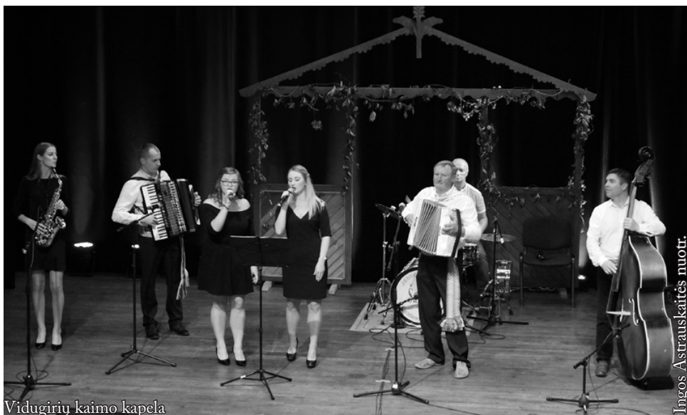
Vidugirių kaimo kapela

Kapelų šventėje vyko taip pat vaišės, pabendravimas su daina ir muzika. Visi dalyviai apdovanoti padėkomis, gėlėmis ir renginio rėmėjų dovanomis. Visų kapelų muzikantai linksmino ir bendravo su publika, grojo ir dainavo, o žiūrovai iš visos širdies pritarė kapelų atliekamoms dainoms, palaikė plojimais ir palin-gavimais. Tikiuosi, kad ši tradicinė šventė Seinuose dar ne vienus metus džiugins Seinų, Punsko ir Suvalkų krašto žmones.