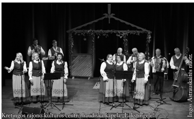
Kretingos rajono kultūros centro liaudiška kapela „Lakštingelė“