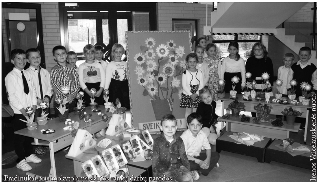
Pradinukai prie mokytojams skirtos rankų darbų parodos

Jūs mūsų vaikams padedate statyti gyvenimo pamatus ir atverti plataus ateities kelio duris. Būkite tie, kurie moko ne tik taisyklių, dėsnių ir formulių, bet ir perduoda savo dvasios šilumą, ugnį, požiūrį, sugeba kasdien atrasti jau atrastuose dalykuose ką nors netikėta ir neatskleista.“