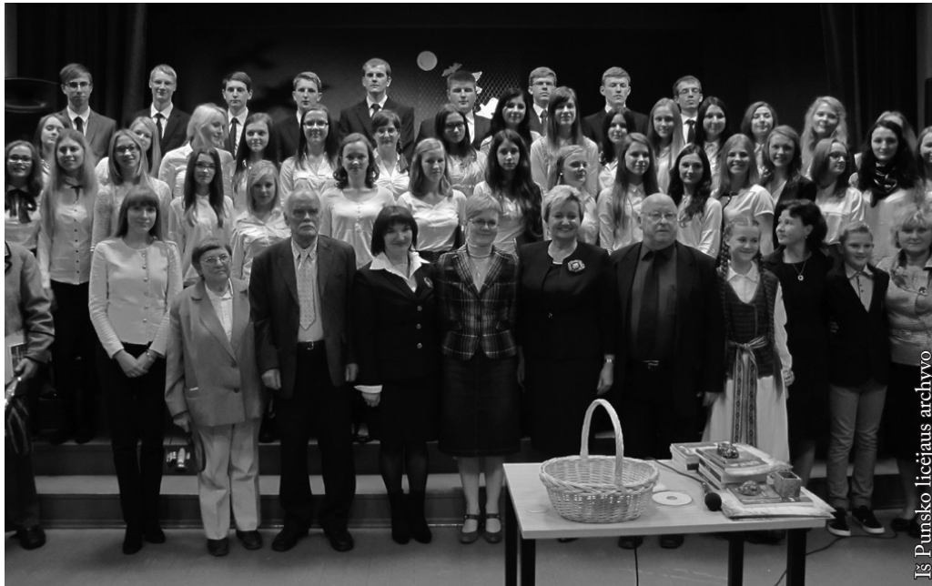
„Pašešupiai” Druskininkuose 2014 m.

nuo gabumų, rastų sau vietą chore. Teigė, kad dainuoti gali visi, tik reikia norėti ir skirti tam daug dėmesio bei darbo. Kartais mažiau gamtos apdovanoti vaikai, bet norintys ir besistengiantys gali išugdyti dainavimą geriau negu tie, kurie jo visai nelavinę. O juk dainuojantis žmogus propaguoja gėrį, meilę, grožį.