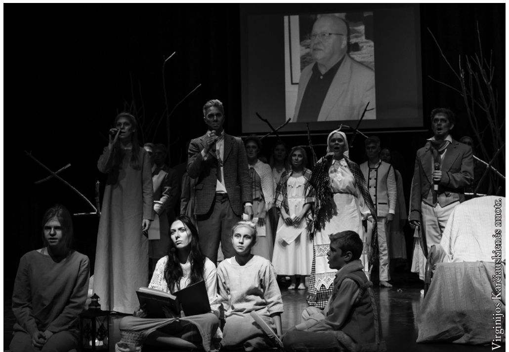
Maestras J. Pavilonis minimas per Vėlinių koncertą Punske