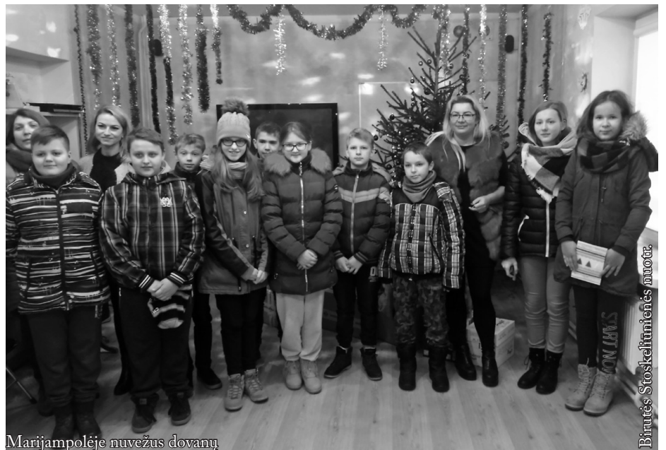
Marijampolėje nuvežus dovanų

Išvyka man labai patiko. Įdomūs buvo užsiėmimai „Multicentre“. Vaikų namuose pasidarė liūdnoka. Nors vaikams nėra ten bloga, tačiau jie neturi savo tėvelių.“