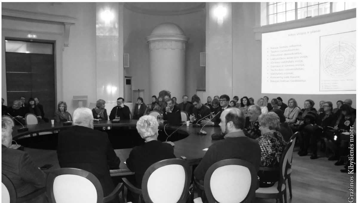
Metų paskaitos dalyviai

1933 m. Mstislavas Dobužinskis dalyvavo kuriant lietuvišką herbą, vėliavą, ordinus, pašto ženklus. Lietuvos simbolių kūrėjas manė, kad vėliavos spalvos turi atitikti istorinius reikalavimus. Jis siūlė geltoną, raudoną ir baltą arba baltą, raudoną ir geltoną vėliavą, atitinkančią jo kurto