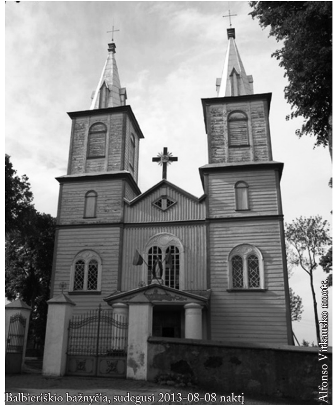
Balbieriškio bažnyčia, sudegusi 2013-08-08 naktį