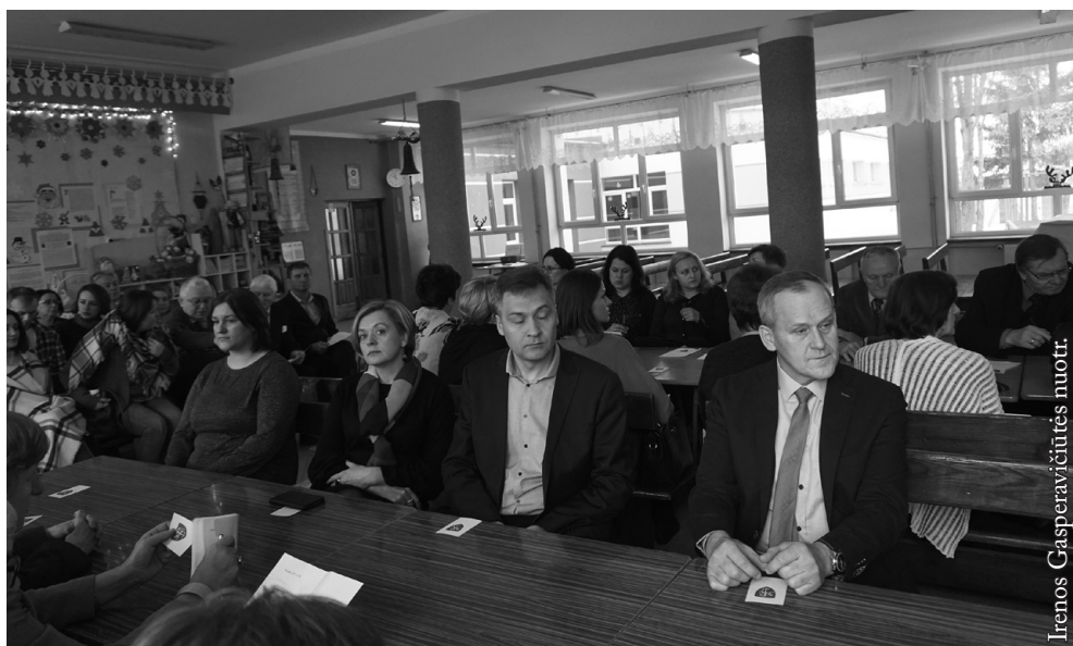
LLB tarybos posėdžio dalyviai