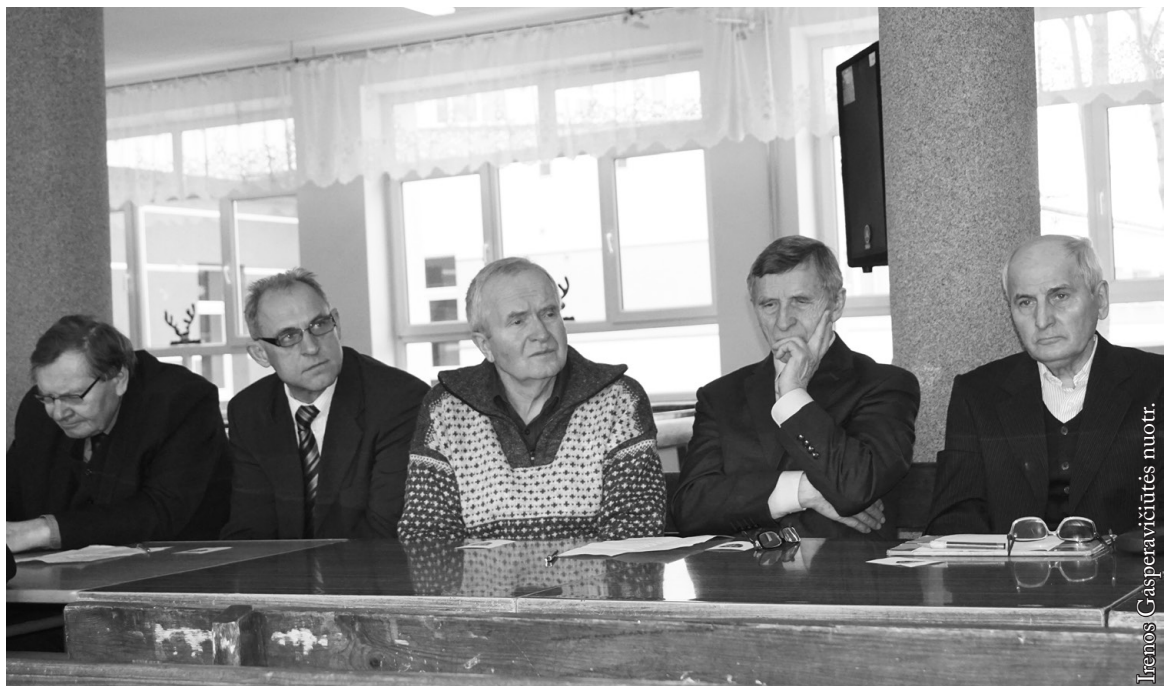
LLB tarybos posėdžio dalyviai