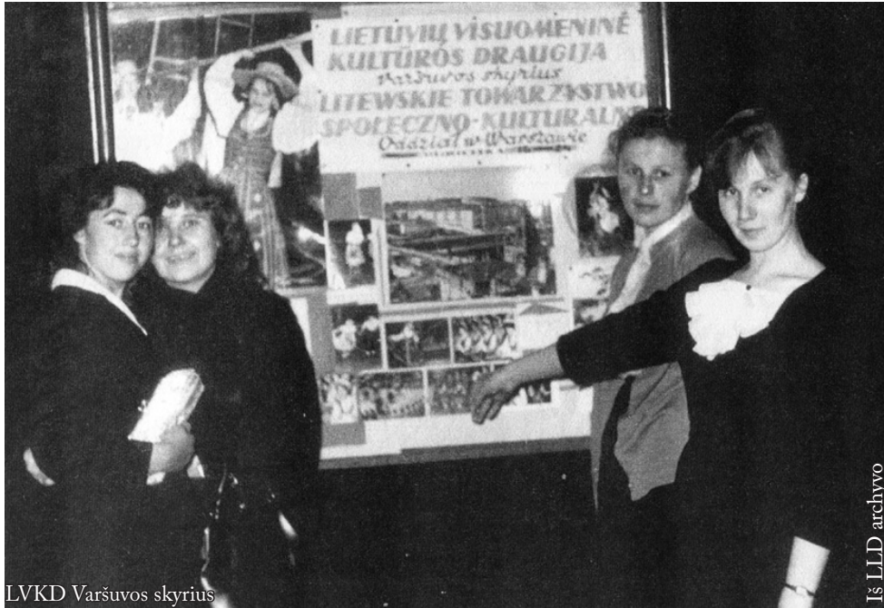
LVKD Varšuvos skyrius