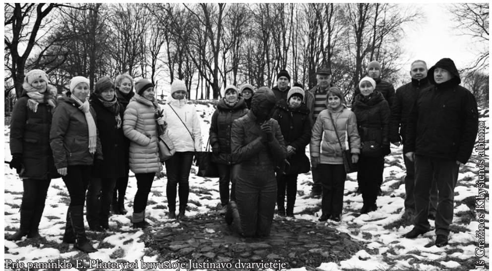
Prie paminklo E. Pliaterytei buvusioje Justinavo dvarvietėje

Dėkojame organizatoriams už turiningą šeštadienį, praleistą vaizdingoje Dzūkijoje mielų žmonių būryje.