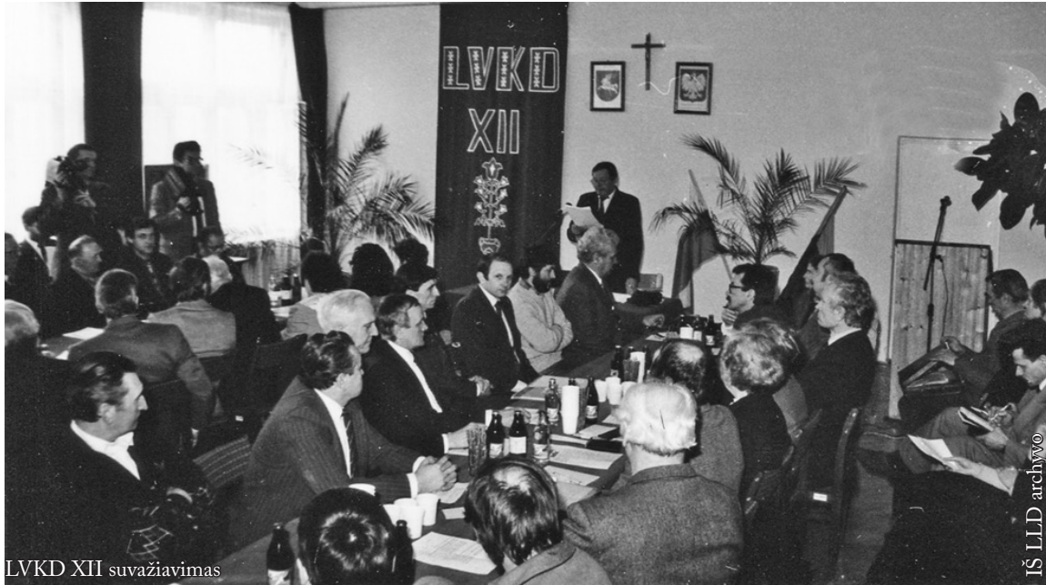
LVKDO XII suvažiavimas