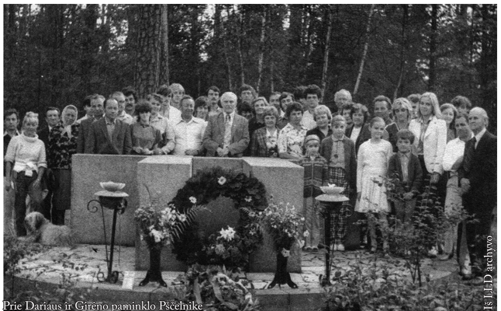
Prie Dariaus ir Girėno paminklo Pšcelnike

Žvelgiant iš laiko perspektyvos ir vertinant lietuvių draugijos narių nueitą kelią, galima pastebėti keletą dalykų. Įkurta Lietuvių visuomeninė kultūros draugija, vėliau persitvarkiusi į Lenkijos lietuvių draugiją, koordinavo organizacinį lietuvių gyvenimą, ji buvo svarbus veiksnys, jungęs ir konsolidavęs lietuvių bendruomenę, prisidėjęs prie lietuvių tapatybės puoselėjimo. Tačiau reikia prisiminti, kad draugija veikė komunistinio režimo metais, todėl nebuvo galima išvengti politinės kontrolės, ideologinės priežiūros, veiklos varžymo. Vis dėlto nepaisant prieštarų veiklos aplinkybių, draugijos nariai plėtojo autentiškos, kiek tomis sąlygomis buvo galima, savarankiškos tautinės veiklos kryptį, ją savotiškai pratęsdami į už „geležinės uždangos“ buvusią Lietuvą. Draugijos vaidmuo lietuvių bendruomenės gyvenime vertintinas pozityviai, atlikti darbai svarbūs jungiant tris lietuvių bendruomenei svarbius dėmenis – praeitį, dabartį ir ateitį.