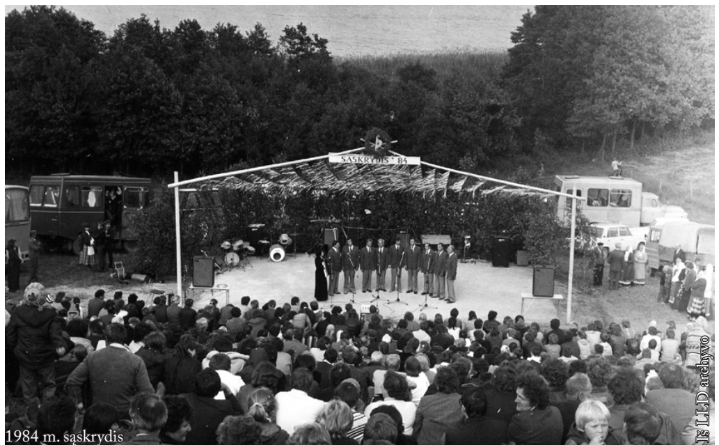
1984 m. sąskrydis

Tačiau bene pati svarbiausia ir reikšmingiausia draugijos veiklos kryptis – lietuvių švietimas. Kartu tai ir pasididžiavimas, ir didžiausias rūpestis. Nuo pirmųjų draugijos veiklos metų