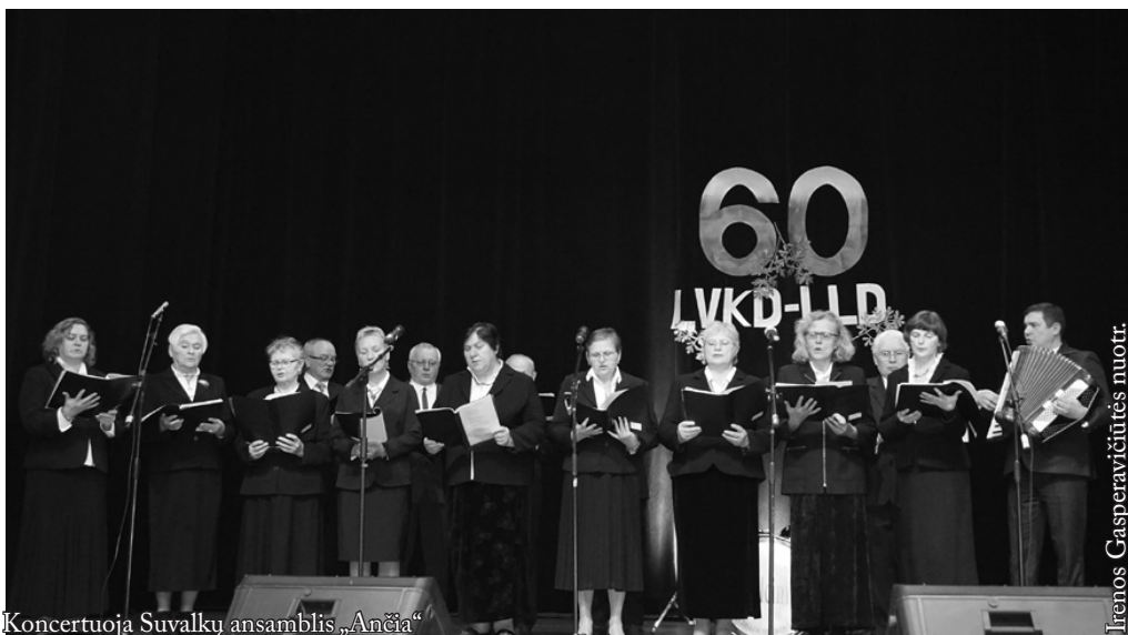
Koncertuoja Suvalkų ansamblis „Ančia“

Lenkijos lietuvių draugija – pati seniausia Lenkijos lietuvių organizacija, užsiimanti tiek kultūrine, tiek leidybine veikla, nuolatos besirūpinanti Lenkijos lietuvių teisine padėtimi. Jos veikla mums yra įprastinė, bemaž akivaizdi, todėl net nepamąstome apie jos egzistavimą. Tačiau jeigu jos pritrūktų, pajustumė stygių. Prisdėkime tad, kiek kas galime, darbu ar bent geru žodžiu prie draugijos veiklos, kad galėtume minėti dar ne vieną jos veiklos jubiliejų.