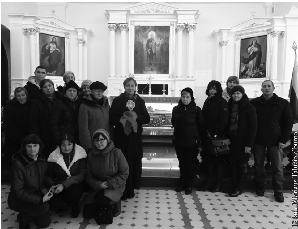
Punsko piligrimai po šv. Mišių Kaišiadorių katedroje prie pal. Teofiliaus sarkofago su kankinio relikvija