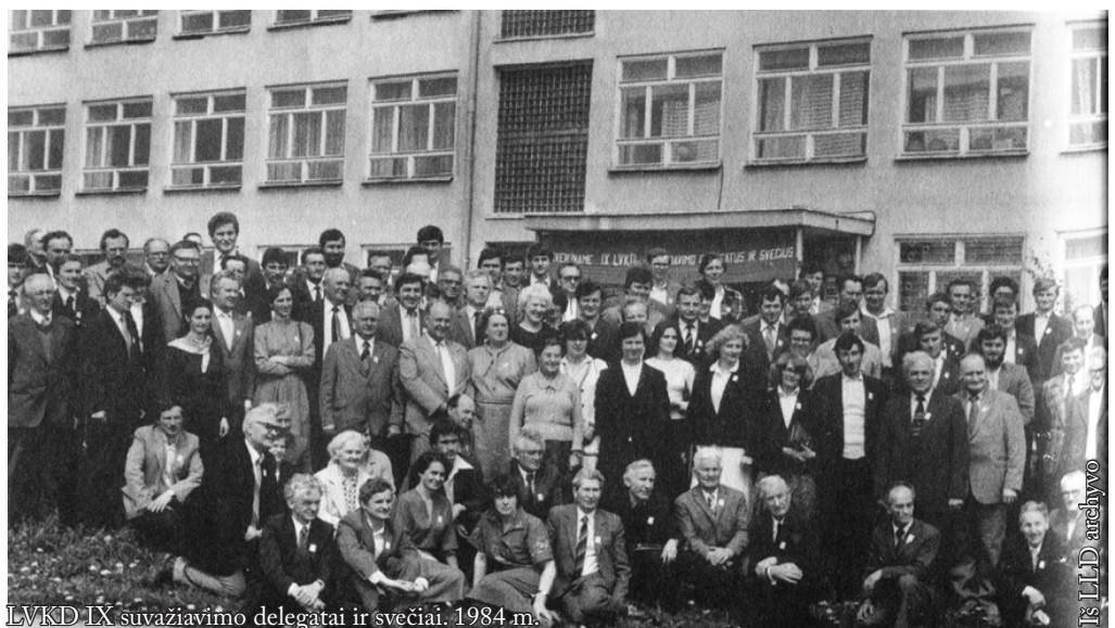
LVKD IX suvažiavimo delegatai ir svečiai. 1984 m.