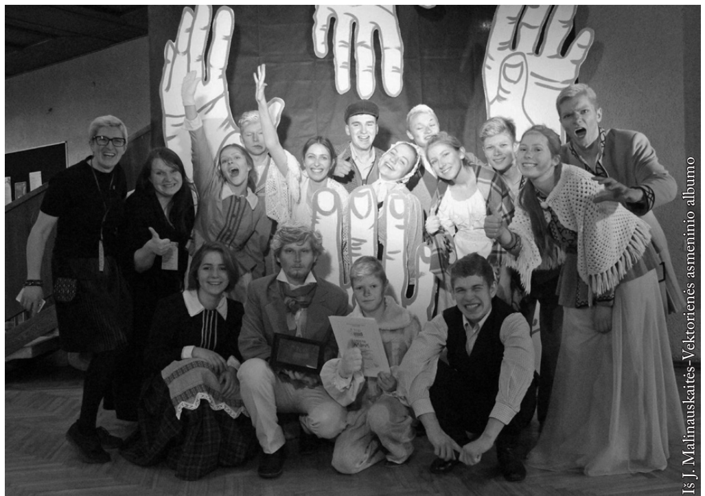
„Kregždė“ Pasvalyje – diplomų įteikimas