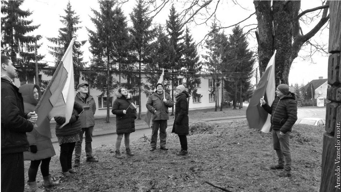
Viena iš „100 akimirų Lietuvai“

dirba puikiai. Visa tai susiję – augina profesionalų teatrą. Žodžiu, mums, lietuviams, šioje srityje pasisekė. Nuo 2017 m. priklausau ir Lietuvos mėgėjų teatro sąjungos tarybai. Tikiuosi, kad tokiu būdu pavyks ne tik plėsti savo žinių spektrą, ugdyti ir auginti teatro žmones, bet ir atverti bendradarbiavimo vartus, užmegzti ryšius su kitais Lietuvos ir pasaulio lietuvių teatrais.