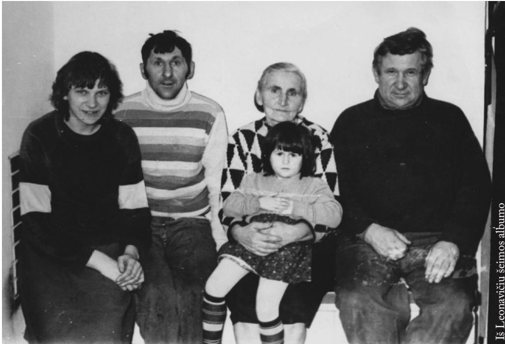
Iš Leonavičių šeimos albumo