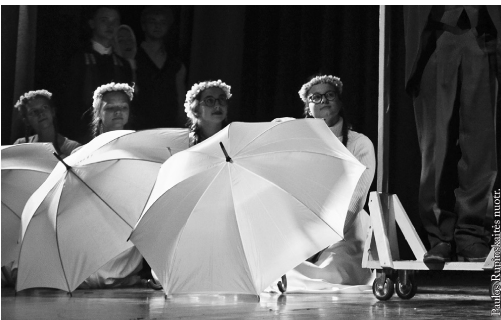
„Kregždės“ spektaklio akimirka