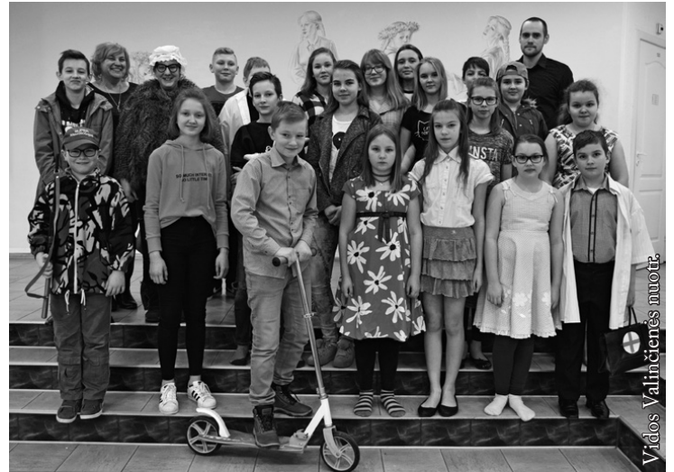
Vidugirių mokyklos „Šmaikštuoliai“