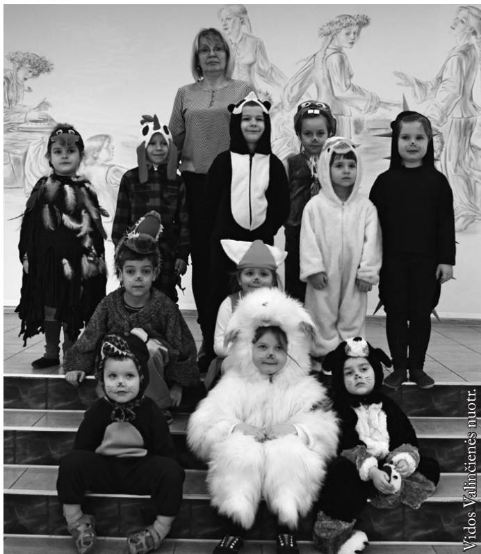
Lazdijų mokyklos-darželio „Kregždutės“ teatras

Marijampolės „Ryto“ pagrindinė mokykla →