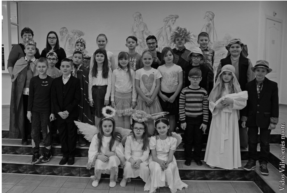
Punsko Dariaus ir Girėno mokyklos „Dzūkucai“