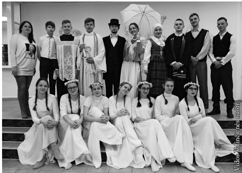
Punsko LKN jaunių teatras „Kregždė“

Marijampolės „Ryto“ pagrindinė mokykla →