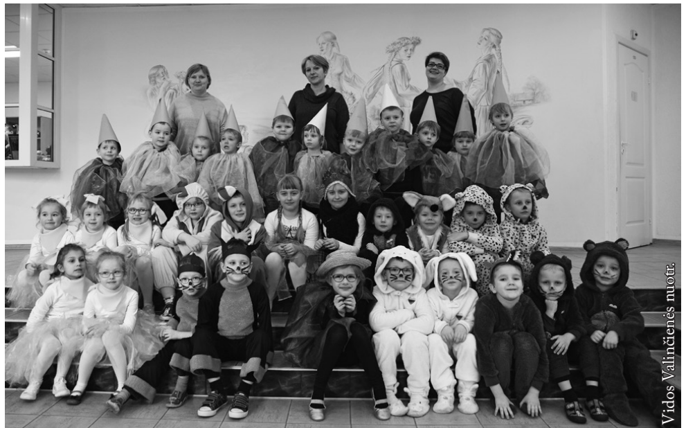
Seinų lietuvių „Žiburio“ darželinukai

Šventės vedėjai – Punsko lietuvių kultūros namų „Kregždutės“ teatro vaidintojai. Festivalį organizavo Lenkijos lietuvių draugija ir Seinų „Lietuvių namai“. Šventės rėmėja – Lenkijos vidaus reikalų ir administracijos ministerija.