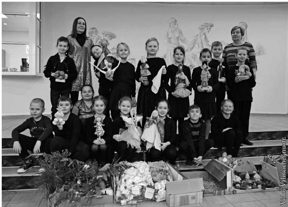
Punsko Dariaus ir Girėno pagrindinės mokyklos „Laisvalaikio kertelė“