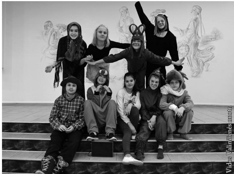
Seinų lietuvių „Žiburio“ mokyklos „Dusalukas“ (IV kl.)