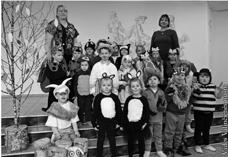
Punsko savivaldybės vaikų darželio „Boružėlė“