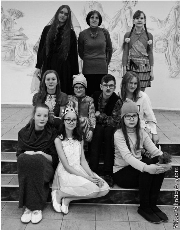
Seinų lietuvių „Žiburio“ mokyklos „Dusalukas“ (V-VI kl.)