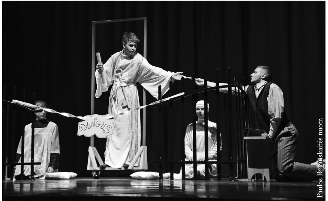
„Kregždės“ spektaklis „Tarp žemės ir dangaus“

Praėjusiais metais mūsų krašte vyko Vaikų ir jaunimo teatrų apžiūra „Šimtakojis“, surengta kartu su Lietuvos nacionaliniu kultūros centru. Vaikų teatras „Kregždutė“ 2017 metais padovanojo žiūrovams du spektaklius: „Pepė“ pagal Astridos Lindgren apysaką „Pepė Ilgakojinė“ bei „Alisą stebuklų šalyje“. Pirmą kartą „Kregždutės“ istorijoje spektaklis „Pepė“ tapo „Šimtakojo 2017“ laureatu. Taip