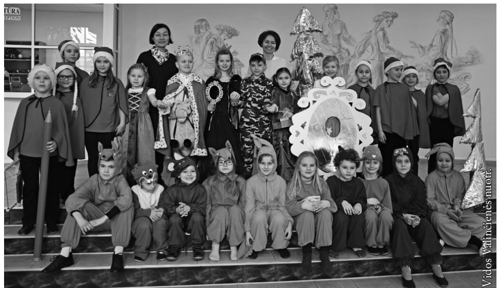
Seinų lietuvių „Žiburio“ mokyklos teatras „Šakar makar“