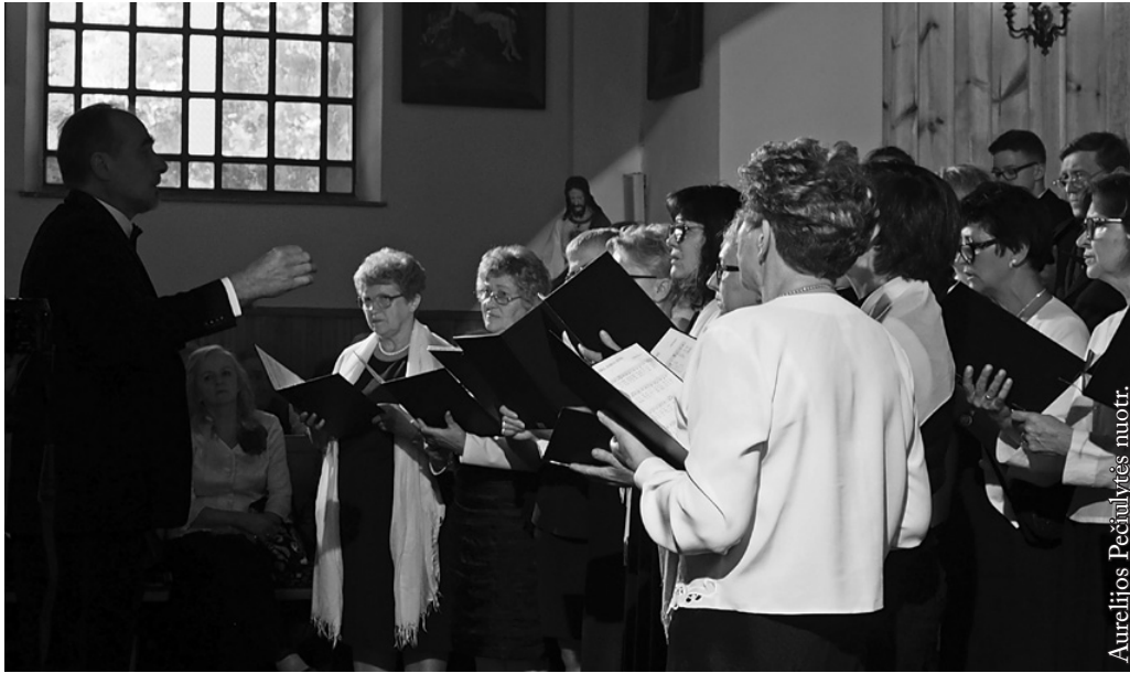
Žagarių bažnytinis choras