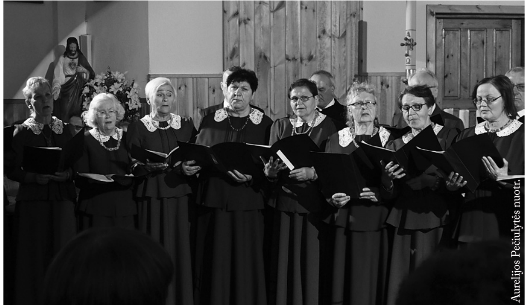
Suvalkų lietuvių choras „Ančia“

Po pamaldų priešais altorių rikiavosi bažnytinių chorų dalyviai ir giedojo Marijos garbei. Kodėl būtent Marijai? Todėl, kad gegužė, pats gražiausias metų mėnuo, yra skirtas Dievo Motinai pagerbti.