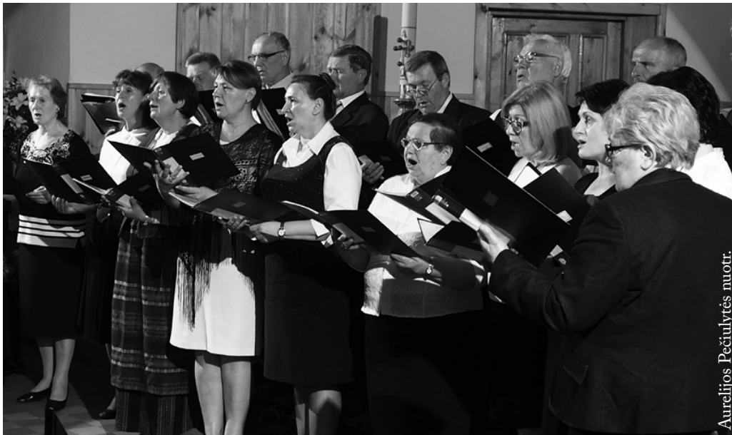
Punsko bažnytinis choras