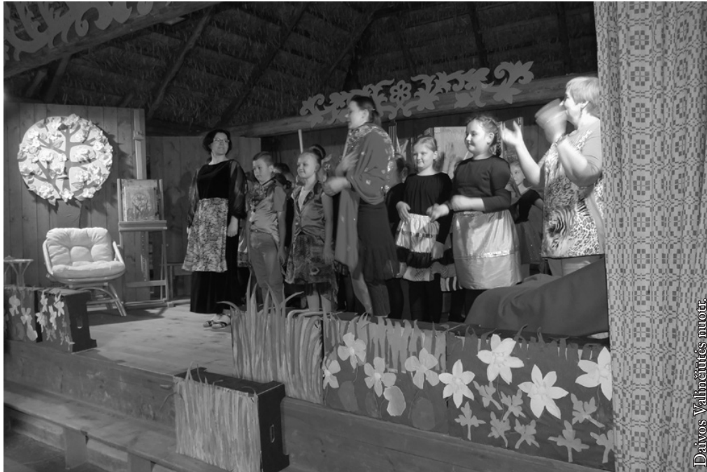
Laisvalaikio kertelės dalyvių spektaklis

bendravo, žaidė krepšinį, padėjo pažinti Punkską ir jo apylinkes.