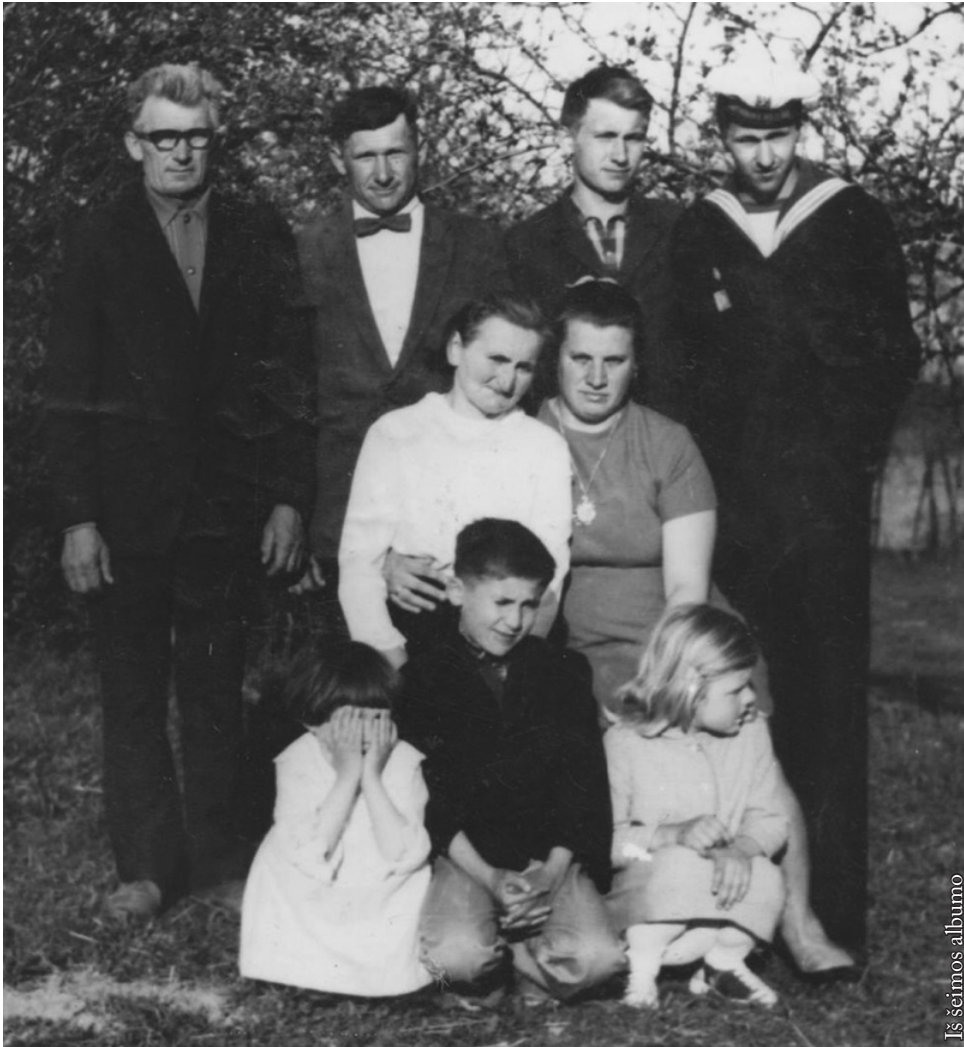
Iš šeimos albumo