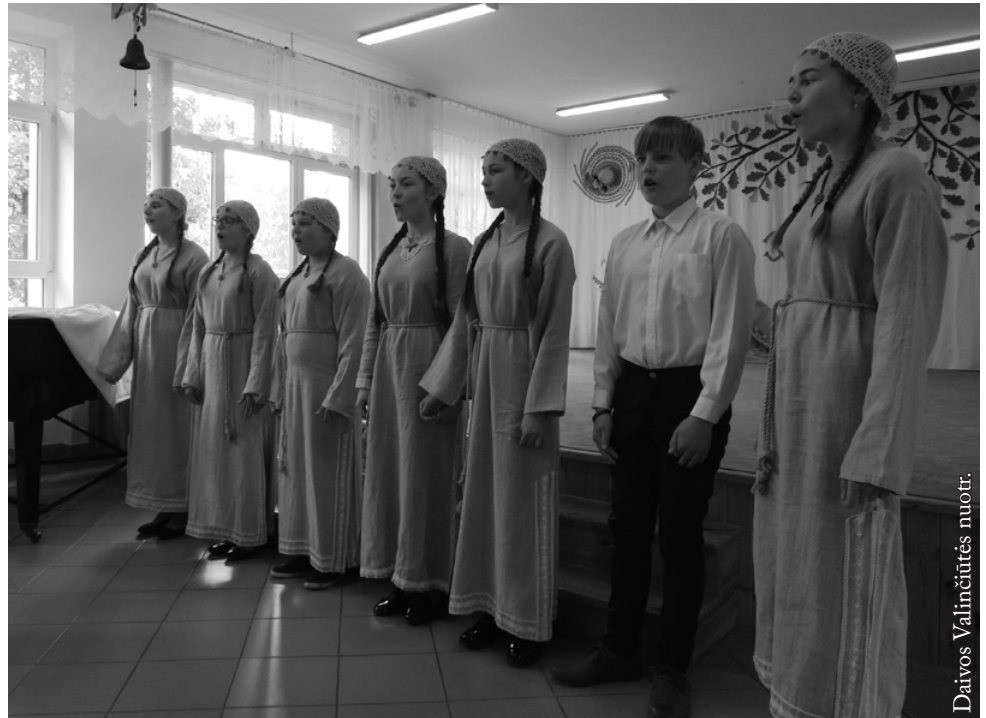
Pagėgių moksleivių meno programėlė

Šių metų gegužės 15–18 dienomis Punske vyko Punsko valsčiaus suorganizuota vaikų stovykla. Joje kartu su Punsko pagrindinės mokyklos ir gimnazijos mokiniais, mokyklos ir bibliotekos darbuotojais bei šio krašto pensininkais dalyvavo Pagėgių savivaldybės viešosios bibliotekos atstovės bei Pagėgių sporto ir meno mokyklos mokiniai su auklėtoja. Renginys buvo įgyvendintas vykdant dalinai Europos regioninės plėtros fondo finansuojamą projektą Nr. LT-PL-2S-113 „Pagėgių ir Punsko bibliotekų ir kultūros paslaugų patrauklumo skatinimas“, kuris esąs Interreg V-A Lietuva-Polska programos dalis. Projekto partneriai: Pagėgių savivaldybės viešoji biblioteka ir Punsko valsčius. Susitikę dalyviai lankė Punską, mūsų mokyklą ir jos biblioteką, susipažino su mūsų krašto kultūrine veikla, bendraudami su punskiečiais pasidalijo savo