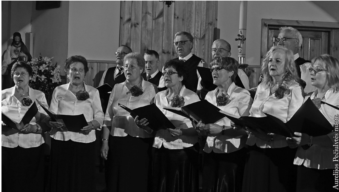
Punsko senjorų klubo kolektyvas „Tėviškės aidai“