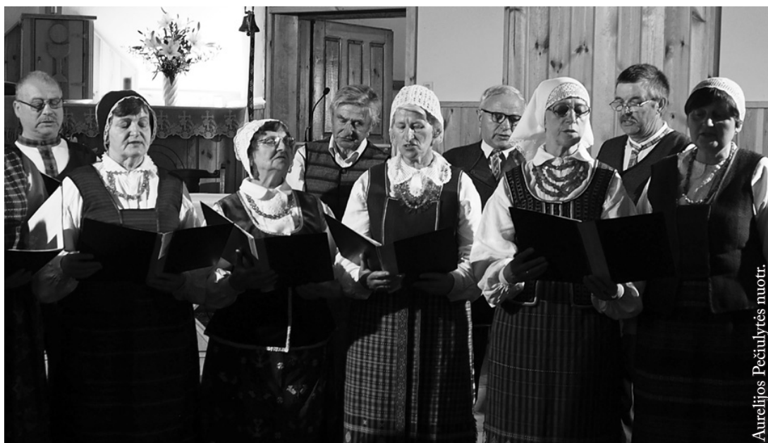
Lenkijos lietuvių etninės kultūros draugijos etnografinis ansamblis „Gimtinė“