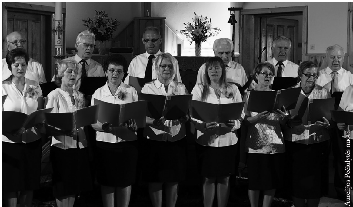
Seinų lietuvių bažnytinis choras

Visuomet malonu klausytis šventės šeimininko – Žagarių bažnytinio choro, kurio dalyviai tai nuolatiniai Žagarių bažnytėlės lankytojai bei kaimynystėje