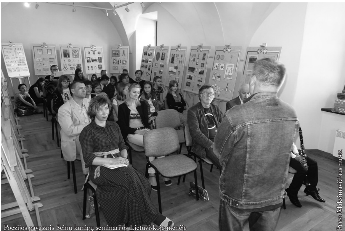
Poezijos pavasaris Seinų kunigų seminarijos Lietuviškoje menėje

Ugnį paeiliui sriubčiojant putojančios kibirkštys Lankšiom adatom aitriai sminga Ir tirpsta po oda virpantis plienas. Ausys virsta geležinkelio stotimis Guluos ant kilimo, sitaip siūbuoja Ir dunda, kvepia anglim ir švilpukais Tada, kai traukiniai švelniai trinasi šonais Apsitraukiu žole, kaip kailiu. Vystantys akių vokai lipnūs žiedlapiai. Akmuo, iš po traukinio spriegtas Čekstelėdamas dryksteli mano kailį Kruvinom signalinėm vėliavėlėm Aguonom laukinėm pasrūva Iki ryto laižaus, kol užmiegu.