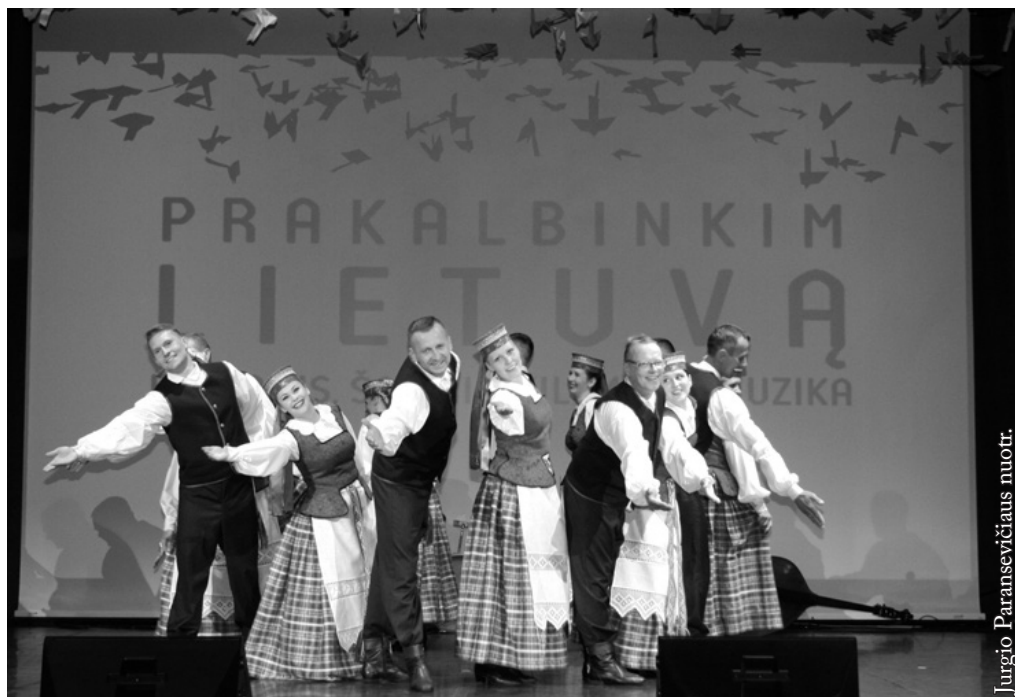
„Vyčių“ atliekama „Šelmių polka“