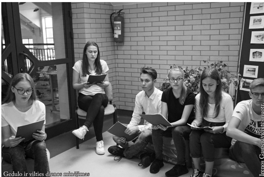
Gedulo ir vilties dienos minėjimas