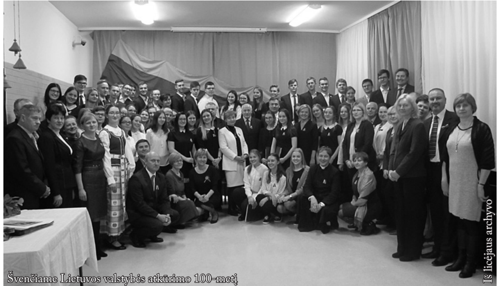
Švenčiame Lietuvos valstybės atkūrimo 100-metį