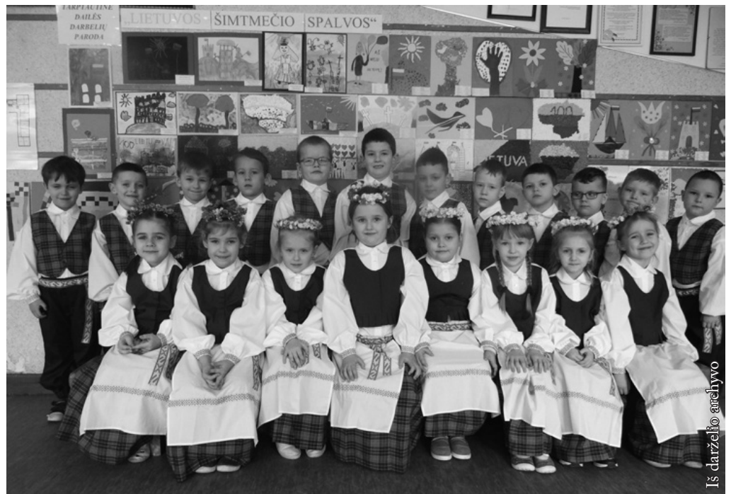
Vaikai pasipuošę dzūkiškais tautiniais drabužėliais

dieną. Šventės „Mano spalvotas pasaulis – mes 100-mečio vaikai“ metu smagiai pabendravome su bendramžiais iš Seinų „Žiburio“ vaikų darželio.