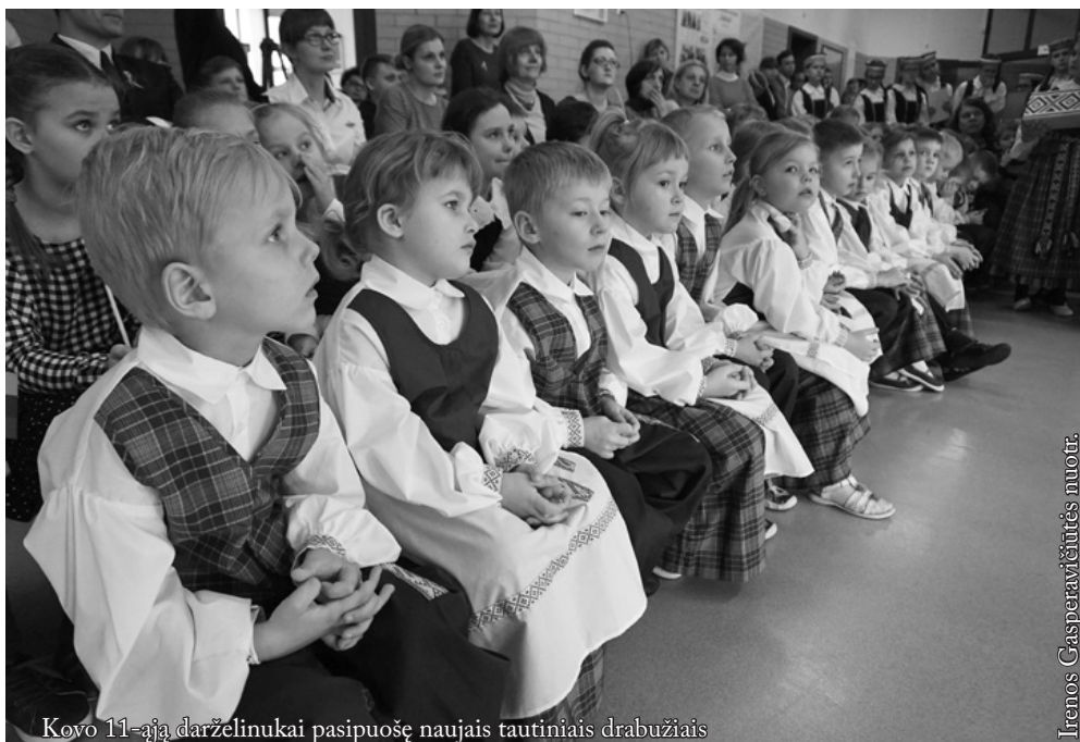
Kovo 11-ąją darželinukai pasipuošė naujais tautiniais drabužiais