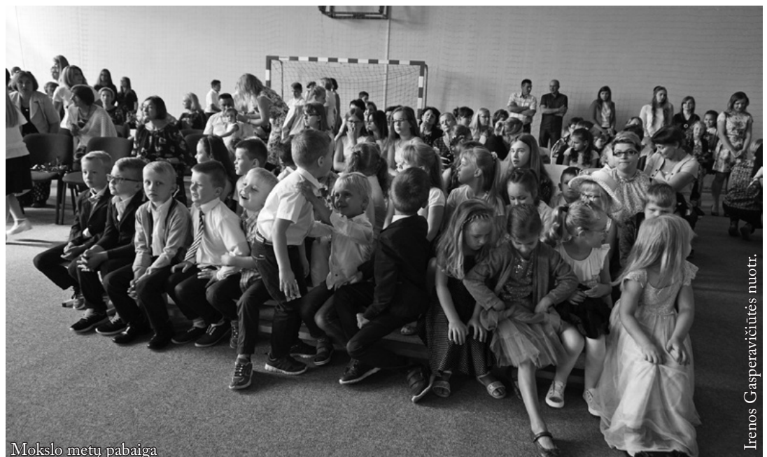
Mokslo metų pabaiga

Šiais mokslo metais ypač daug dėmesio skyrėme skaitymo skatinimui. Pirmąjį pusmetį pirmokams pagal pageidavimą bibliotekoje buvo skaitomos knygelės. Skaityti skatinome eksponuodami naujai įsigytas knygas atskiroje lentynoje bibliotekoje, vėliau koridoriuje. Veikė skaitymo kameliai I aukšte jauniausiems skaitytojams, antrame vyresniems. Bibliotekos mokytoja, kaip ir kiekvienais metais, surengė perskaitytų