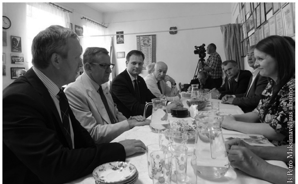
Suvalkų „Vienybės“ klube

Pagrindinis, svarbiausias vizito momentas buvo apsilankymas Suvalkų