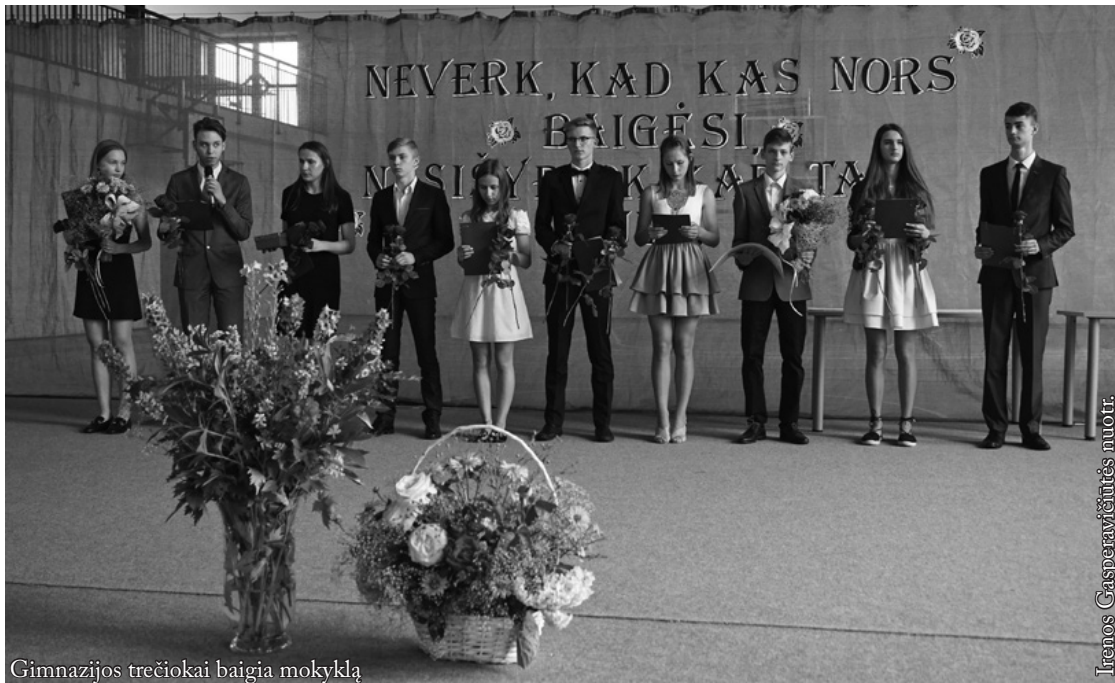
Gimnazijos trečiokai baigia mokyklą