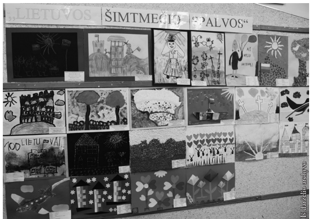
Paroda „Lietuvos 100-mečio spalvos“