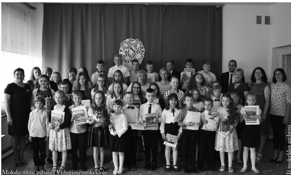
Mokslo metų pabaiga Vidugirių mokykloje

Galima pasidžiaugti labai gerais mokinių rezultatais ir geru lankomumu. Šeštoje