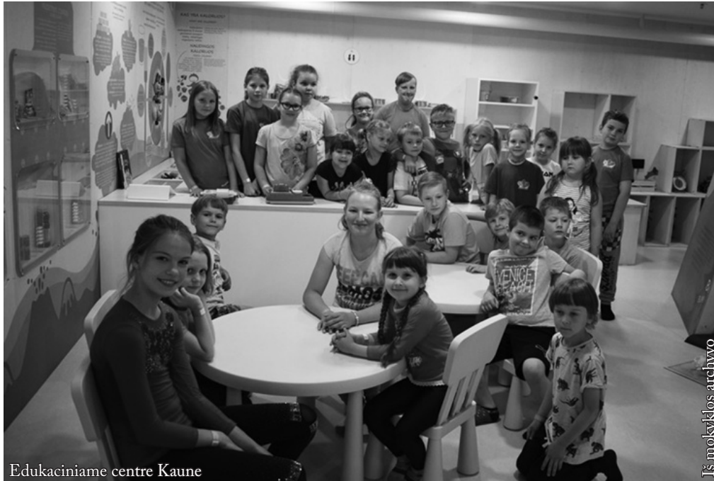
Edukaciniame centre Kaune