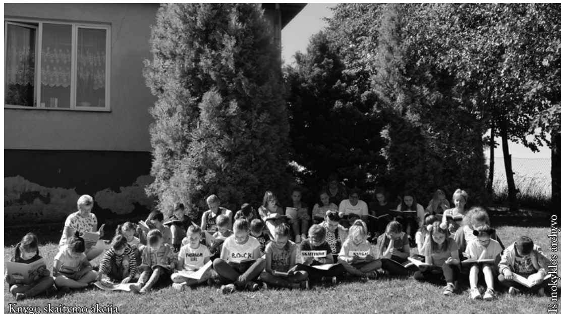
Knygų skaitymo akcija