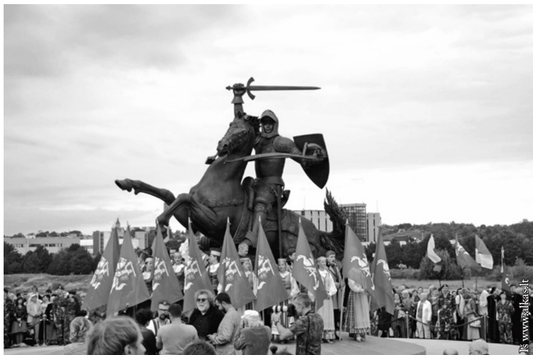
Kaune iškilmingai atidengta Vyčio skulptūra – „Laisvės karys“

Kol valdžios atstovų populiarumas krenta žemyn lyg lietus, mes laukiame tikro lietaus. Juk be jo nebus grybų, o štai uogos šiomet buvo ankstesnės pora savaičių. O koks gi dzūkas be grybų?..