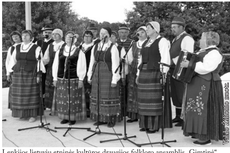
Lenkijos lietuvių etninės kultūros draugijos folkloro ansamblis „Gimtinė“