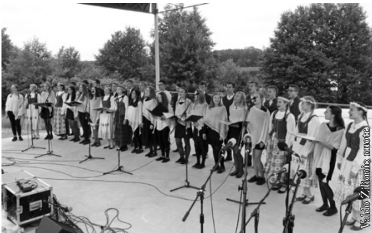
Punsko Kovo 11-osios licėjaus jaunimo mišrus choras „Pašešupiai“