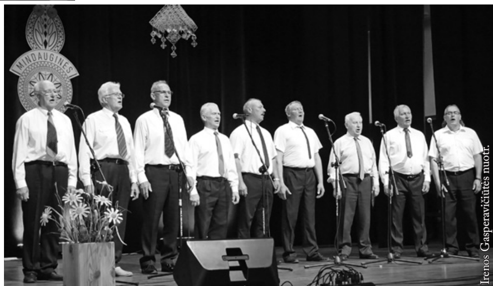
Vyrų vokalinis ansamblis

Mindaugines švęsti pradėta liepos 6 d. giedant himną prie vysk. Antano Baranausko paminklo. Kitą dieną „Lietuvių namuose“ pirmiausia nuo 15 val. kieme vyko amatų mugė, čia galima buvo įsigyti medžio, vytelių ar molio gaminių, o vakare koncertų salėje surengtas vietinių ansamblių koncertas. Tiesą sakant, nepamenu, kada Seinų „Lietuvių namuose“ mačiau tiek daug žiūrovų.