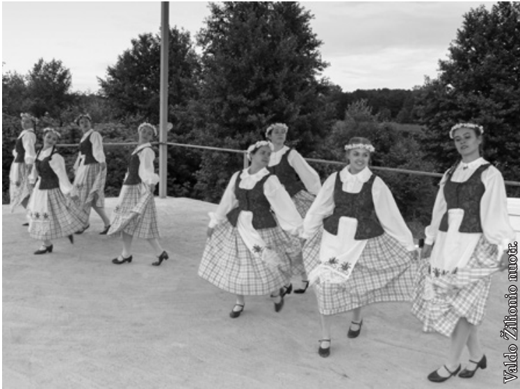
Punsko lietuvių kultūros namų choreografinis sambūris „Jotva“