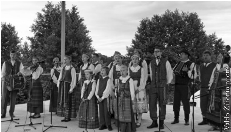
Lenkijos lietuvių etninės kultūros draugijos ansamblis „Alna“