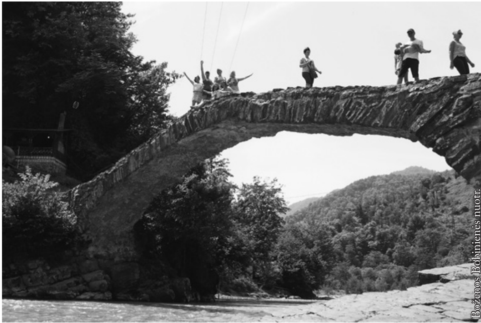
Makhuntseti akmeninis tiltelis