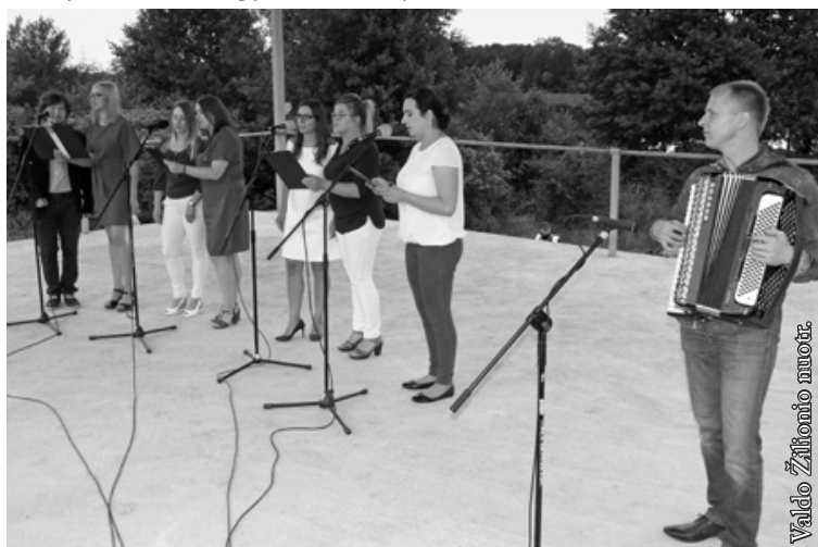
Suvalkų vokalinis ansamblis