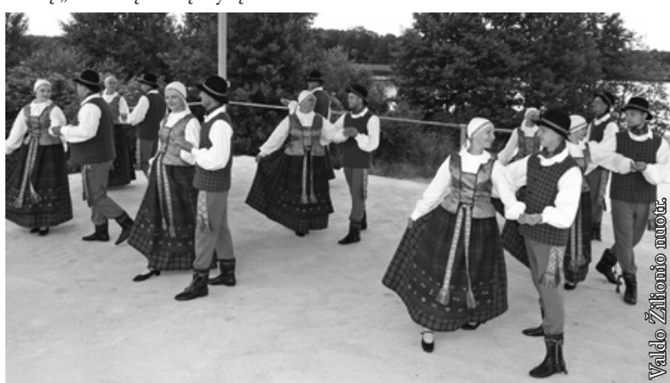
Seinų „Lietuvių namų“ vyresniųjų liaudiškų šokių grupė „Seina“