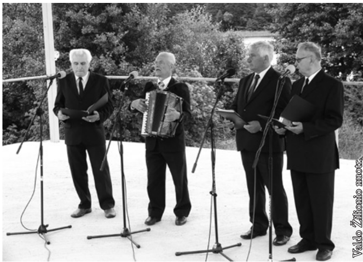
Lietuvių šv. Kazimiero draugijos vyrų kvartetas