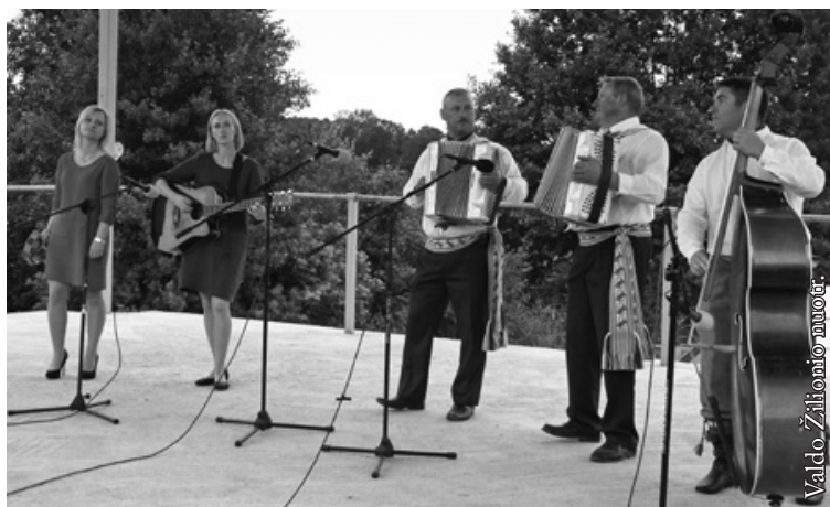
Vidugirių kaimo kapela