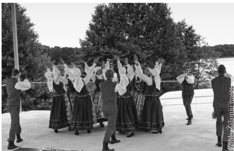
Punsko Kovo 11-osios licėjaus tautinių šokių grupė „Šalčia“