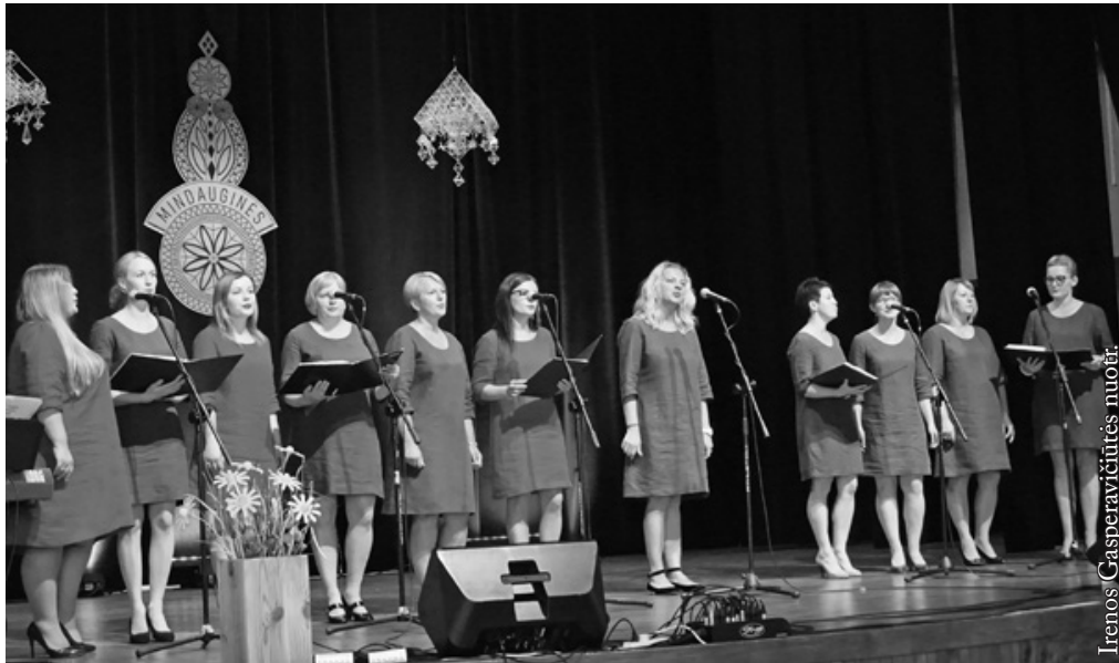
Moterų vokalinis ansamblis „Intro”