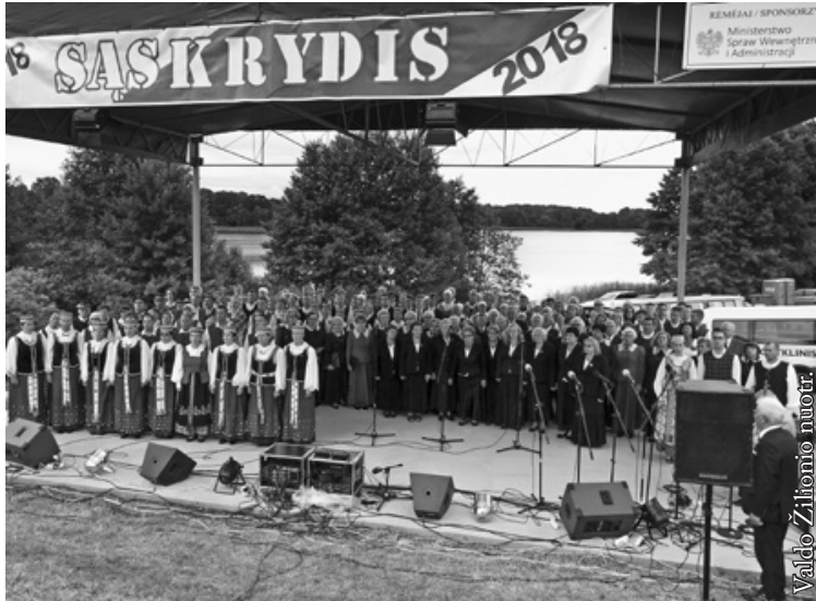
Visi ansambliai gieda Lietuvos himną