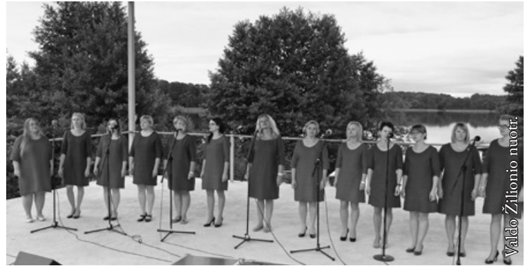
Seinų „Lietuvių namų“ vokalinė grupė „Intro“