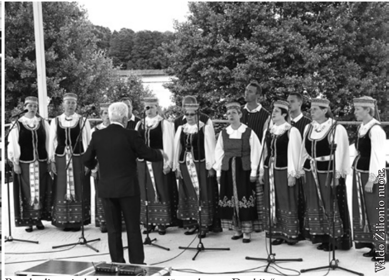
Punsko lietuvių kultūros namų mišrus choras „Džukija“