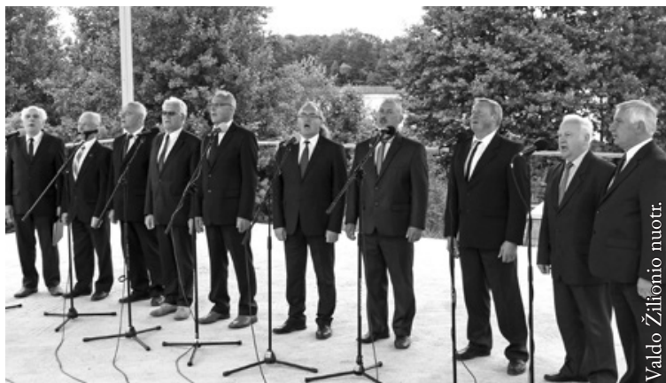
Seinų „Lietuvių namų“ vyrų vokalinis ansamblis