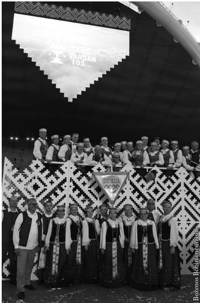
„Varsa” ir „Dzūkija”