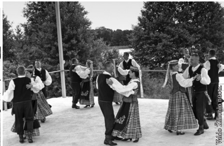
Punsko lietuvių kultūros namų šokių grupė „Vyčiai“