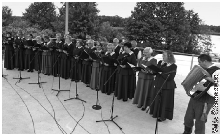
Lenkijos lietuvių draugijos Suvalkų skyriaus ansamblis „Ančia“