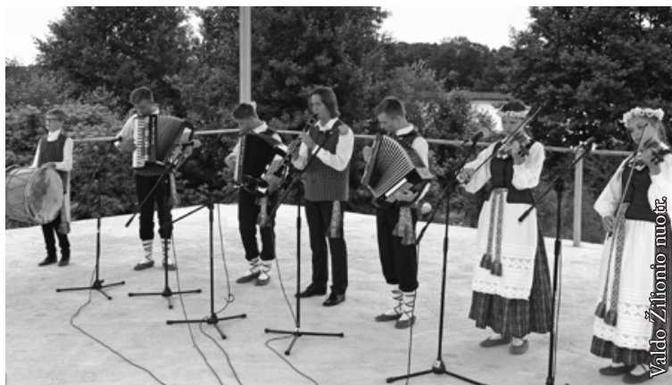
Punsko lietuvių kultūros namų vaikų kapela „Puniukai“