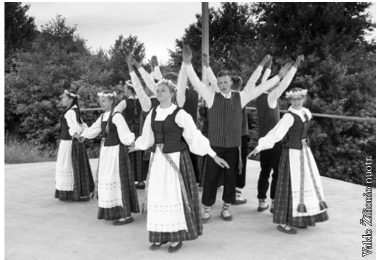
Punsko lietuvių kultūros namų vaikų meno studija „Puniukai“