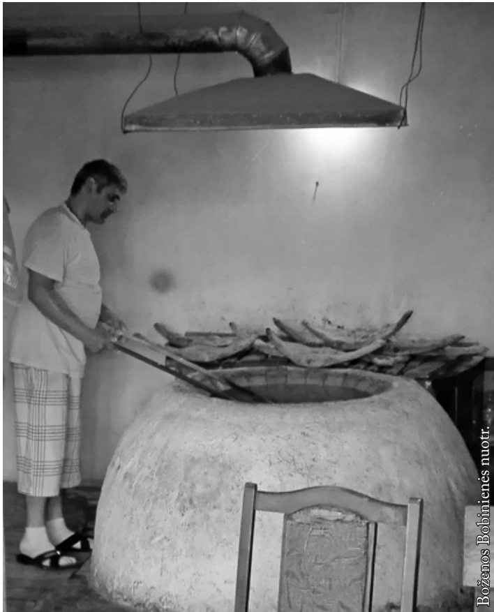
Gruziniškos duonos (lavašo) kepyklėlė Kabulečio mieste