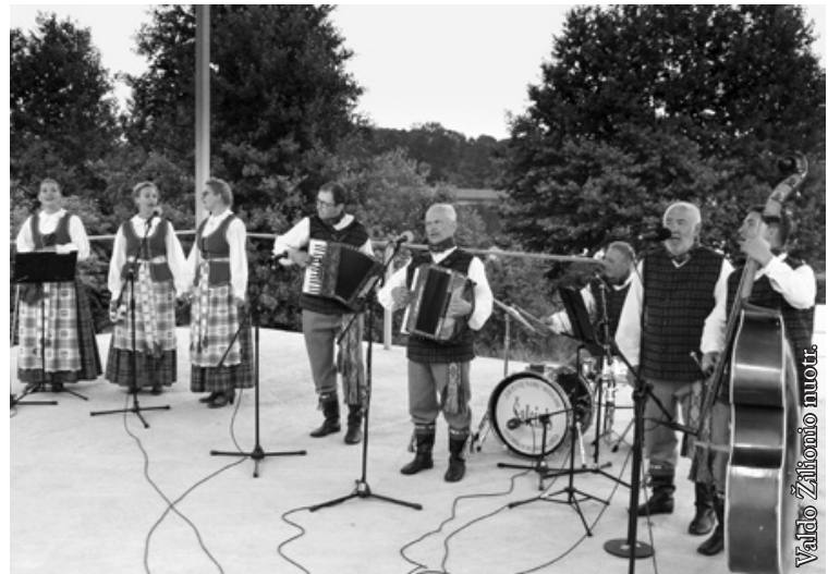
Seinų „Lietuvių namų“ liaudiškos muzikos kapela „Šalcinis“

B irželio 24 d. Burbiškių kaime prie Galadusio ežero įvyko tradicinis ansamblių sąskrydis, kurį suorganizavo Lenkijos lietuvių draugija. Kaip ir kasmet sąskrydžio metu išvydome ir išgirdome didelį būrį Punsko, Seinų ir Suvalkų lietuvių ansamblių. Šiais metais jų buvo net 18. Šiame būryje atsirado 3 naujos grupės: Seinų „Lietuvių namų“ vokalinė grupė „Galadusis“ ir vyrų vokalinis ansamblis, taip pat Suvalkų vokalinis ansamblis.