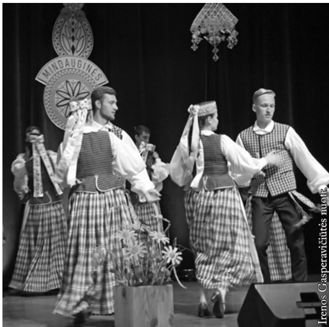
„Lietuvių namų“ šokių grupė „Seina”

Taigi šiemet nuspręsta kitaip – pereiti po stogu. Šiais metais pasirinktas kiek kitoks šventės formatas.