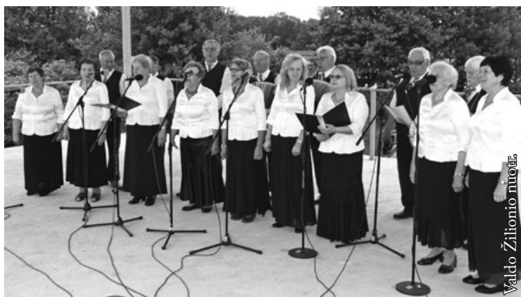
Punsko senjorų klubo ansamblis „Tėviškės aidai“