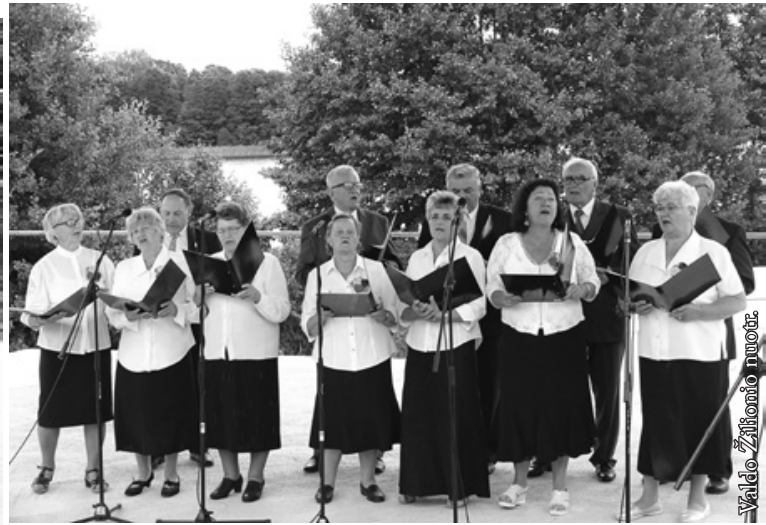
Seinų „Lietuvių namų“ vokalinė grupė „Galadusis“