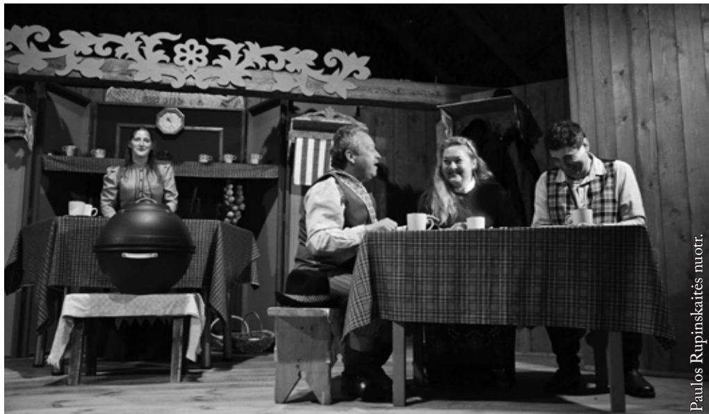
Birštono kultūros centro mėgėjų teatras