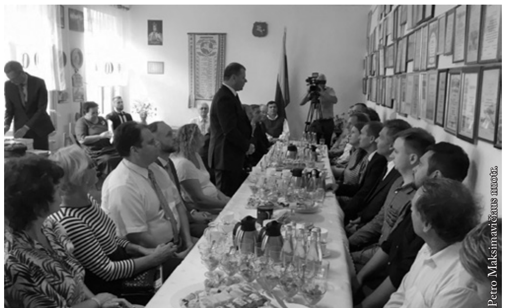
Susitikimas su Lietuvos Ministru Pirmininku S. Skverneliu Suvalkų „Vienybės“ klube