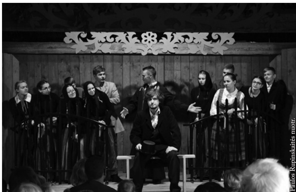
Punsko LKN jaunių teatras „Kregždė“