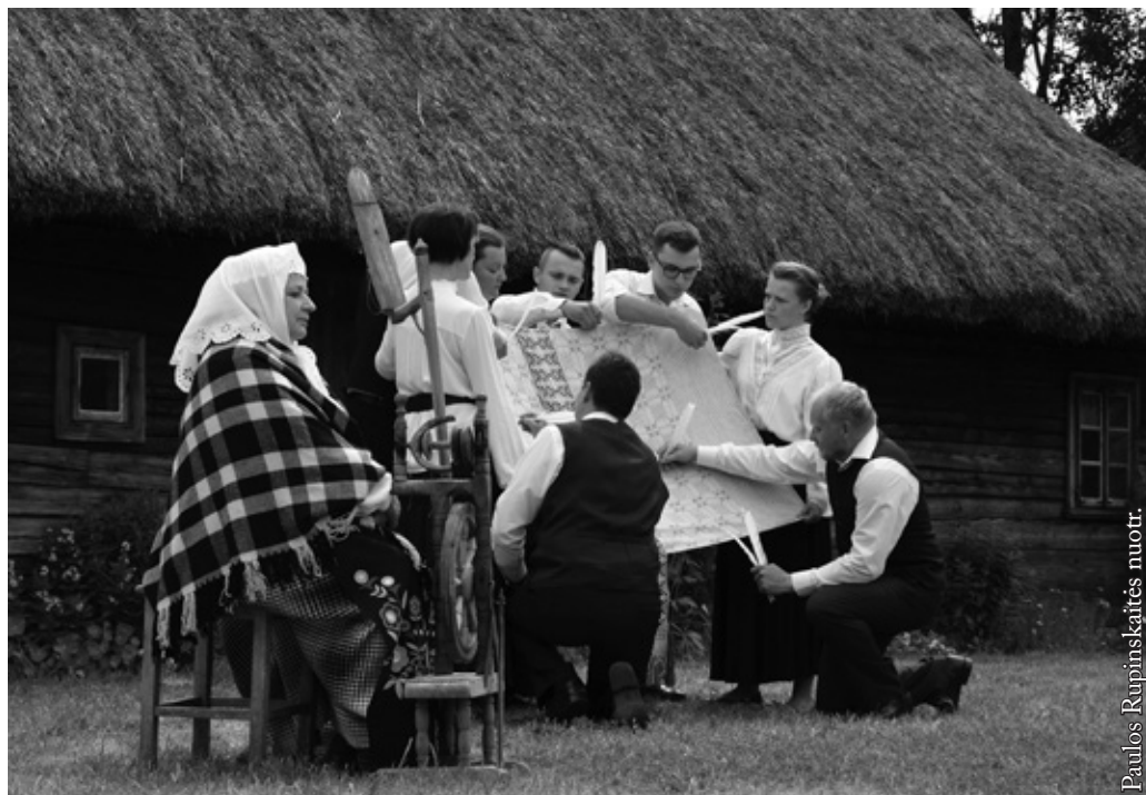
Punsko LKN klojimo teatras