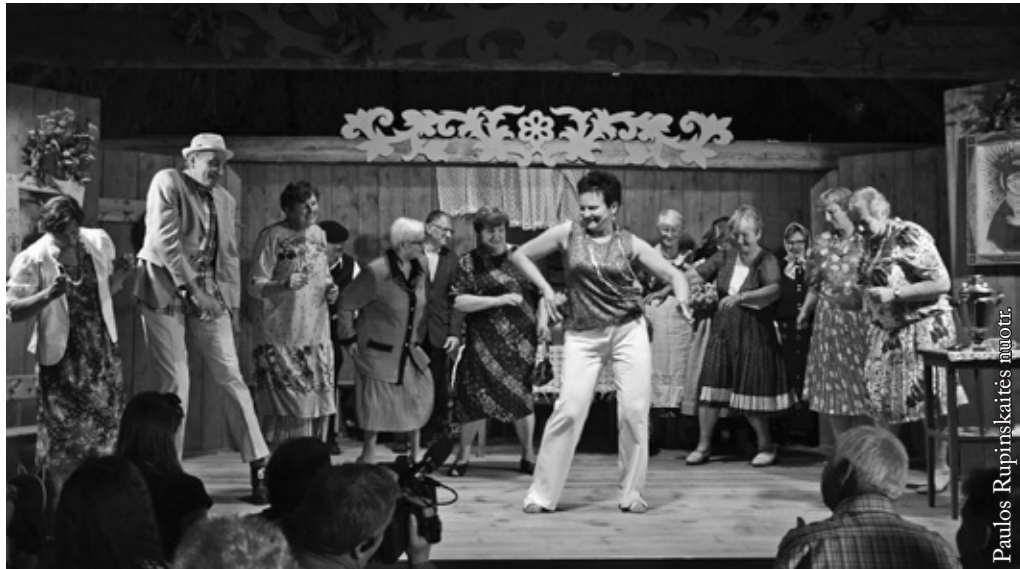
III amžiaus universiteto teatrinis kolektyvas

Visiems vadovams linkiu neuilsti darbuose – tegyvuoja seno lietuviško teatro tradicijos mūsų krašte, tegul lietuviškas žodis skamba ne tik namuose, gatvėje, bet ir scenoje, o artistams nebijoti „pažaisti“ kartu kuriant gražius sceninius stebuklus.