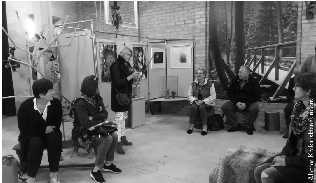
Lankome Raganų ekspoziciją

G yvenimas, pasak Vydūno, tai kelionė tobuluman. „Gyvenimas – judėjimas, o žmogus – aukščiausia gamtos pakopa, nes jis vienintelis apdovanotas sąmone, kurios laipsnis ir dydis žmonėse nevienodas. Tauta turi padėti žmogui tobulėti, o žmogus turi save įprasminginti tautoje.“ Toks ir buvęs Seinų ir Punsko lietuviškų mokyklų mokytojų, Punsko licėjaus mokinių ir Punsko valsčiaus darbuotojų rugsėjo 14 d. kelionės į Pagėgius tikslas – „tobulėti iš vidaus“ bei bent trumpai pakeliauti lietuvių filosofo, rašytojo, dramaturgo, publicisto, kultūros veikėjo Vydūno takais. Jo skelbtos taurios idėjos aktualios ir šiandien. Iš jų