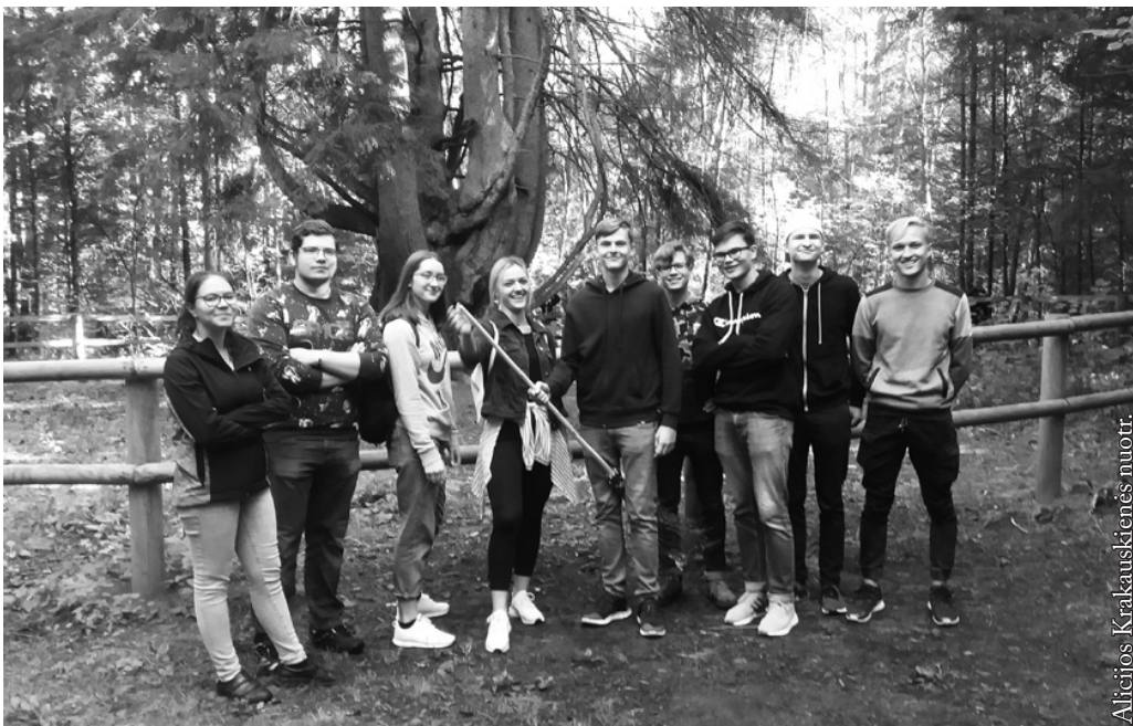
Prie Raganų eglės Vilkyškių miške