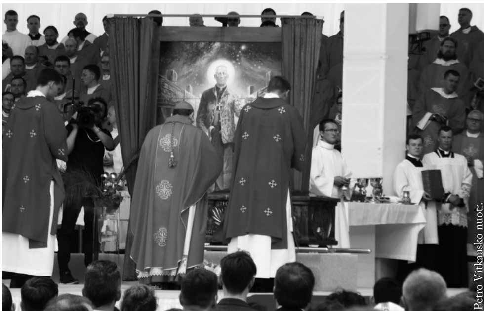
Arkivyskupo Teofiliaus Matulionio beatifikacija Vilniuje 2017 m. birželio 25 d.