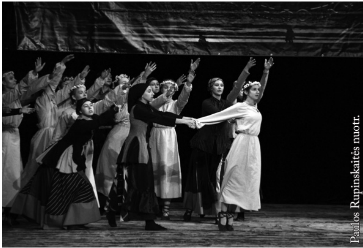
Paulos Rupinskaitės nuotr.