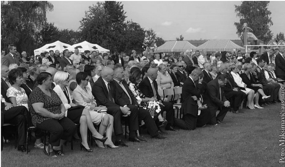
Derlinių dalyviai ir svečiai

iki galo tai tiesa. Nuolatos tarpusavy besiginčijantys, elementarios asmeninės kultūros stokojantys tarybos nariai tikriausiai nesukurs nieko gero, tačiau pakenkti gali labai. Visų pirma šie ginčai persikelia į plačiąją visuomenę, ją radikalizuoja, o tai gimdo papildomų problemų. Paprastai visuomenės nuomonių radikalizavimasis gimdo kraštutines reakcijas, kurios pereina į ideologiją. Ten, kur nėra sutarimo ir pažangos buitiniuose reikaluose, atsiranda pasaulėžiūros, tautiniai elementai. Seiniškiai tai gerai žino. Nebejotina šis rinkimų į savivaldybių tarybas laikotarpis išryškins ir šias tendencijas. Todėl suprastami jų kilmę turime reaguoti ramiai ir nepasiduoti galimoms provokacijoms. Tokia yra rinkimų kampanijos prigimtis.