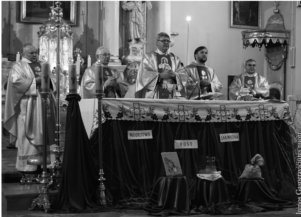
Vasario 16-osios šv. Mišios Seinų bazilikoje

o istorijoje ne visada draugiškai klostėsi jų tarpusavio santykiai kartais meta šešėlį ir šiandien. Ar teko tai pajusti? Ar sunku buvo rasti savo vietą tokioje situacijoje? Kokiu principu vadovavotės bendraudamas su lenkais ir lietuviais?