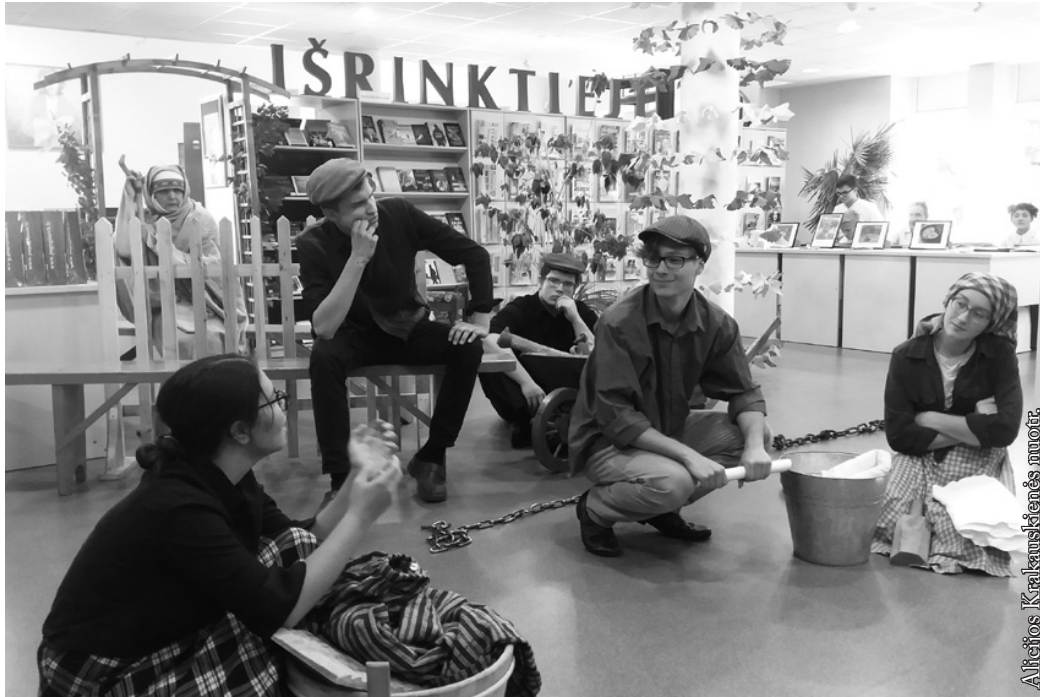
Punsko Kovo 11-osios licėjaus būrelio spektaklis „Vergai ir dykiai“

į fotografavimą pasitelkiant išmaniają technologiją, kuri leidžia kiekvienam telefonu neribotai fotografuoti bet kada ir bet kur. Tik ar tokios nuotraukos turi išliekamąją vertę? Kaip šimtmečiams išsaugoti skaitmeninėse laikmenose įrašytus vaizdus? Net patiems mokslininkams nelengva į šiuos klausimus atsakyti. Įdomi taip pat buvo fotomenininkės parengta edukacinė fotografijos darbų paroda „Žaidimų galerija. Išrinktieji“. Pasitekusi lietuvių meno kūrinius ji sukūrė dėlionės vaikams ir suaugusiems. Paskaite apie menininkus jos sudarytame fotoalbume „Išrinktieji“, sužinome apie Lietuvos šiuolaikinius kūrėjus. Pasak žurnalistės, užuot pirkę Kinijoje pagamintas dėlionės, galime pasigaminti savas ir tokiu būdu šviesti jaunuomenę. Per žaidimus skiepyti žinias apie savo kraštą ir jo žmones.