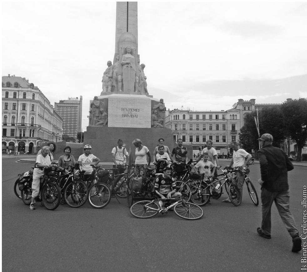
Dviračių žygio dalyviai Rygoje

šimtmečiui ir Didžiojo tūkstantmečio taikos žygio aplink pasaulį dvidešimtmečiui paminėti.