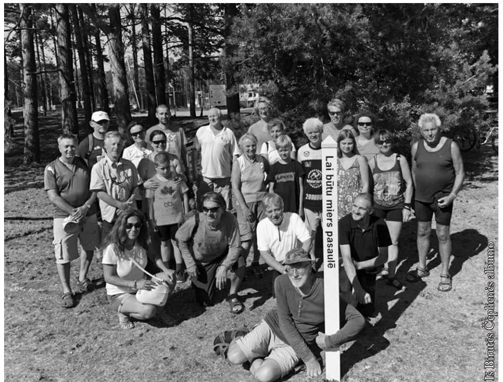
Prie laisvės stulpelio Latvijoje

Šiomet Lietuvos BaltiCCycle komanda surengė tarptautinį žygių dviračiais aplink Baltijos šalis, skirtą Baltijos šalių nepriklausomybės