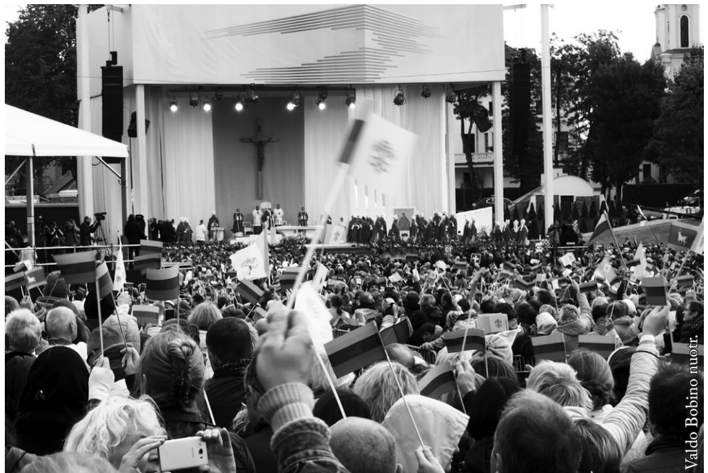
Šimtą tūkstantinė minia atsisveikina popiežių Pranciškų

Susitikimuose su popiežiumi Pranciškumi dalyvaavo per 200 Punsko parapilietėjų. 85 iš jų – tai mūsų krašto jaunimas, kuris su Šventuoju Tėvu susitiko rugsėjo 22 d. Vilniaus Katedros aikštėje.