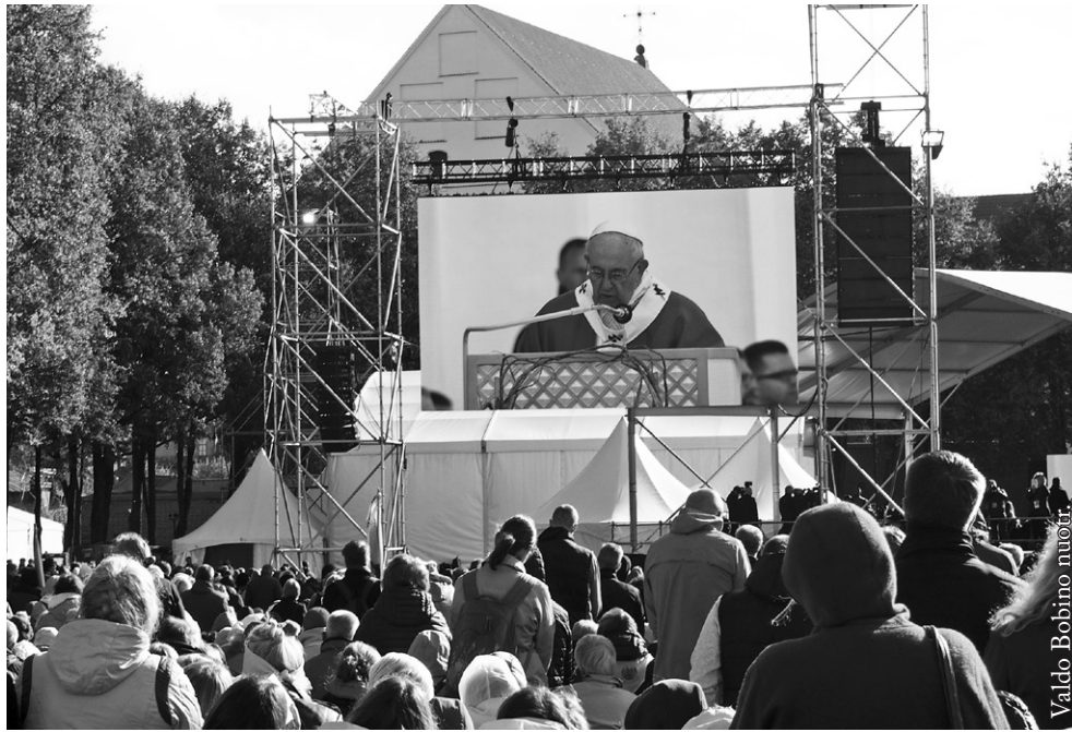
Popiežiaus Pranciškaus homilija

trispalves vėliavėles. Su kiekvienu popiežiaus atsisveikinimo žodžiu visi spontaniškai jomis mojuojame. Pranciškus neatsisveikina su minia pateitiška, įmantria fraze, kaip paprastai daro aukšto rango žmonės. Palaiminęs jis tiesiog lietuviškai palinkisi visiems gero sekmadienio ir skanių pietų. Šito šilto palinkėjimo visiems su kaupu užtenka. Pranciškus eiliną kartą įrodo savo paprastą, žmogišką būdą, normalumą, tikrumą. Žmonės juo pasitiki, nes jis kalba pasilenkdamas prie kito, žiūrėdamas tiesiai į akis, kalbėdamas tiesiai į širdį. Nevengia padėkoti šimtą tūkstantinei miniai už tai, kad atvyko į šį susitikimą.