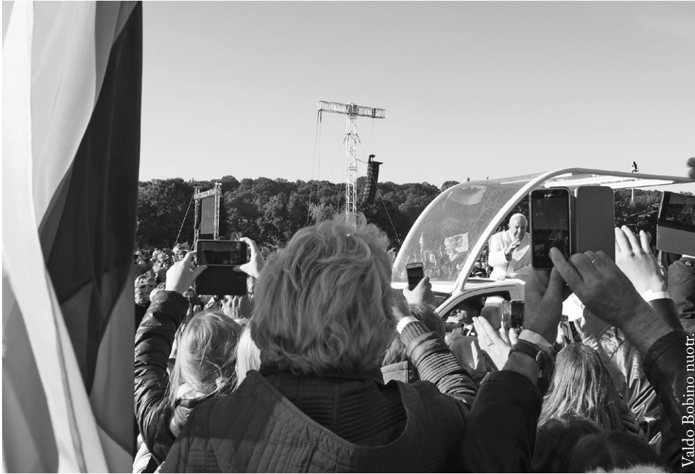
Šventasis Tėvas sveikinasi su Santakoje susirinkusiais pilgrimais

iš tolo pamatome papamobilį. Apima džiaugsmo ir nerimo jausmas, į akis skverbiasi ašaros. Štai tikrai matome popiežių Pranciškų, kaip paprastai mojuojantį, laiminantį, besišypsantį. Matome jį iš tolo, bet juntame iš jo sklindančią šviesą, ramybę, džiaugsmą. Rodos, nuo seno jį pažįstam, sutinkam kaip savą, artimą žmogų. Žavi jo paprastumas, kuklumas. Jis tiesiog tuo spinduliuoja. Pakanka akimirkos – ir išvelgiame jame atvirą, šiltą žmogų, o ne išdidžią asmenybę.