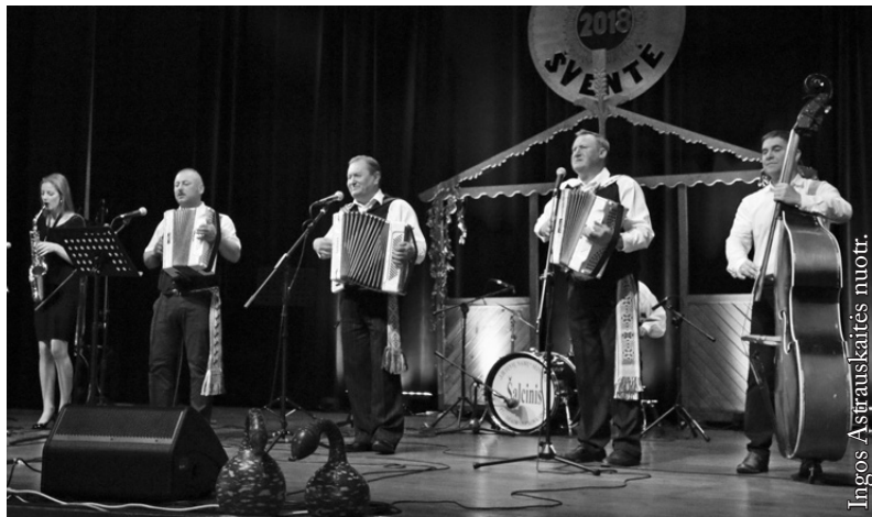
Vidugirių kaimo kapela