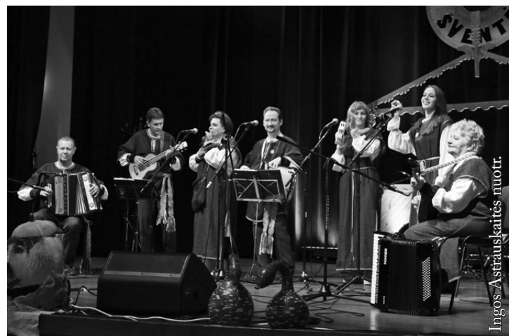
Utenos kultūros centro Sudeikių skyriaus liaudiškos muzikos kapela „Seliavytė“