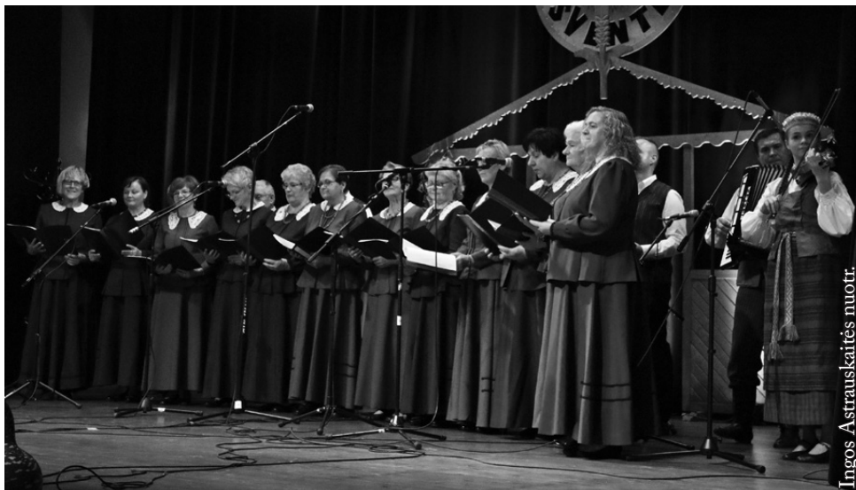
Lenkijos lietuvių draugijos Suvalkų skyriaus ansamblis „Ančia“

Gerą nuotaiką žiūrovams dovanojo Marijampolės kultūros centro Baraginės skyriaus jaunimo kapela „Svaja“. Kolektyvas susibūrė 1999 m. Pradžioje jo veikloje aktyviai dalyvavo 10–15 saviveiklininkų nuo 7 iki 60 m. amžiaus. Nuo 2005 m. kolektyvas pasikeitė iš pagrindų ir tapo vien jaunimo kapela, kurios amžiaus vidurkis būdavo 20–25 m. Per savo veiklos metus „Svaja“ koncertavo respublikiniuose renginiuose ir konkursuose, Lenkijos, Kaliningrado srities klausytojams. Ne kartą atstovavo savo regionui televizijos projektuose, „Grok, Jurgeli“ konkurso atrankose ir finaliniuose etapuose, Dainų šventėse. Kolektyvas