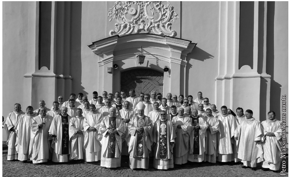
Vilkaviškio vyskupijos kunigai prie Seinų bazilikos

Seinų vyskupijos praeitis glaudžiai susijusi su Vilkaviškio vyskupijos