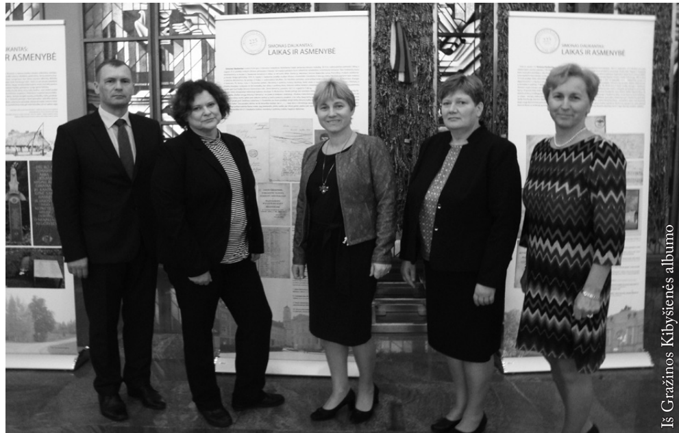
Mūsų krašto mokytojai - konferencijos dalyviai

Konferencijos atidaryme sveikinimo žodį tarė Seimo Pirmininkas Viktoras Pranckietis. Jis sakė, kad būti mokytoju yra iššūkis, o būti originaliu mokytoju – sudėtinga. Nors S. Daukantas ir Vydūnas gyveno skirtingais laikotarpiais, juos vienijo mokytojų ir lietuvių. Nors jie abu