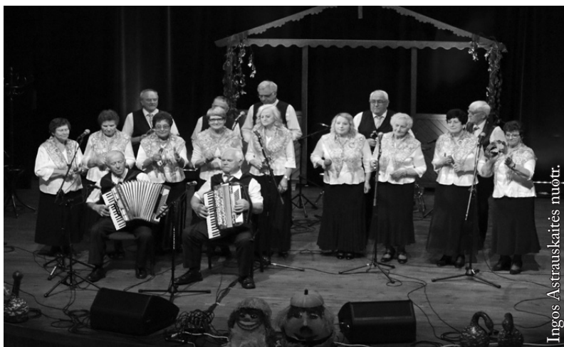
Punsko senjorų klubo kapela „Tėviškės aidai“