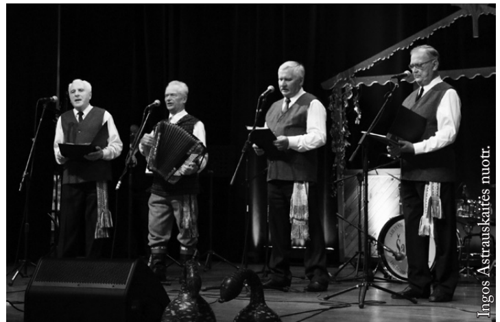
Lietuvių šv. Kazimiero draugijos vyrų kvartetas