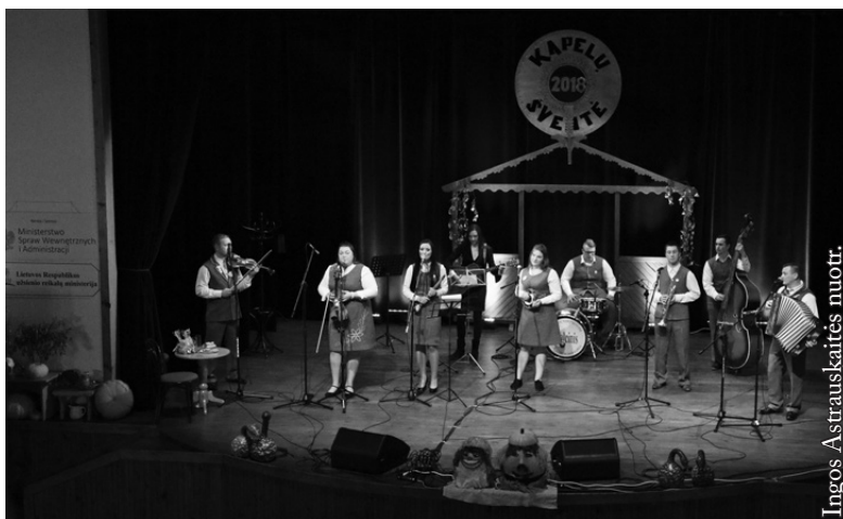
Marijampolės kultūros centro Baraginės skyriaus jaunimo kapela „Svajna“

Ačiū visiems už kartu sukurtą nuostabią šventę.