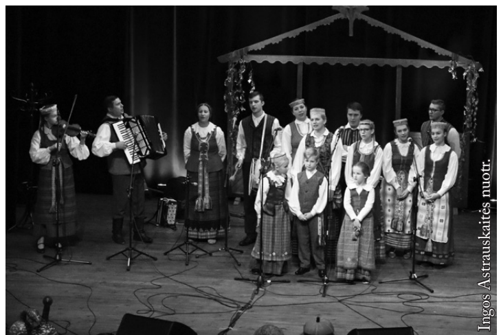
Lenkijos lietuvių etninės kultūros draugijos folkloro ansamblis „Alna“