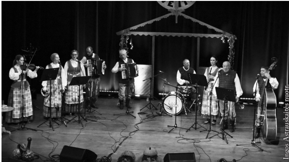
Seinų „Lietuvių namų“ liaudiškos muzikos kapela „Šalcinis“

pagrindinius prizus. Liaudiškos muzikos kapela „Ūkininkas“ daug koncertuoja Lietuvoje ir užsienyje: dalyvavo tarptautiniuose festivaliuose Portugalijoje, Ispanijoje, Prancūzijoje ir kt. Paprasčiau būtų paminėti, kurioje Europos valstybėje nekoncertuota. 2006 m. kapela grojo pasaulinėse artojų varžybose Airijoje. Nuo pat savo įsikūrimo „Ūkininkas“ dalyvavo visose Dainų šventėse, studentų šventėse „Gaudeamus“. 2009 m. kolektyvas buvo apdovanotas „Aukso paukšte“. Kapela labai dažnai koncertuoja su ASU tautinių šokių kolektyvu „Sėja“. 2010 m. kartu su „Sėja“ laimėjo I vietą konkurse „Kadagys“, o kapela pripažinta absoliučiai geriausia instrumentine grupe Lietuvoje. 2011 m. koncertavo Juodkalnijoje, 2012 m. vasarą Italijoje, 2013 m. Portugalijoje. 2014 m. kaimo muzikantų ir kapelių