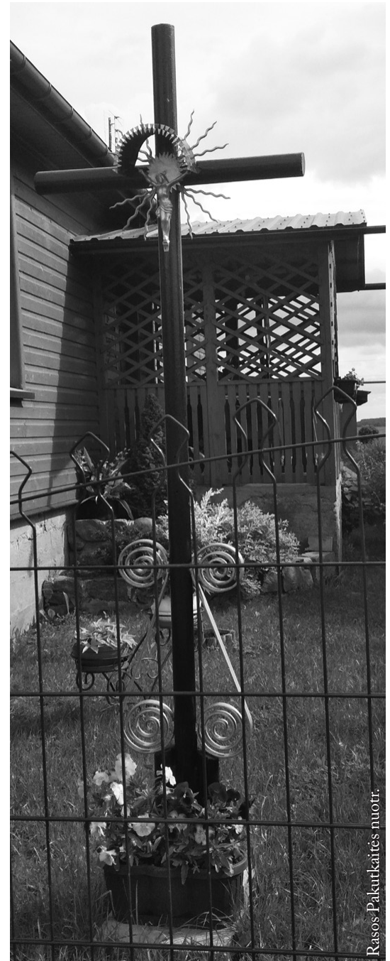
Kryžius prie Vaškių sodybos