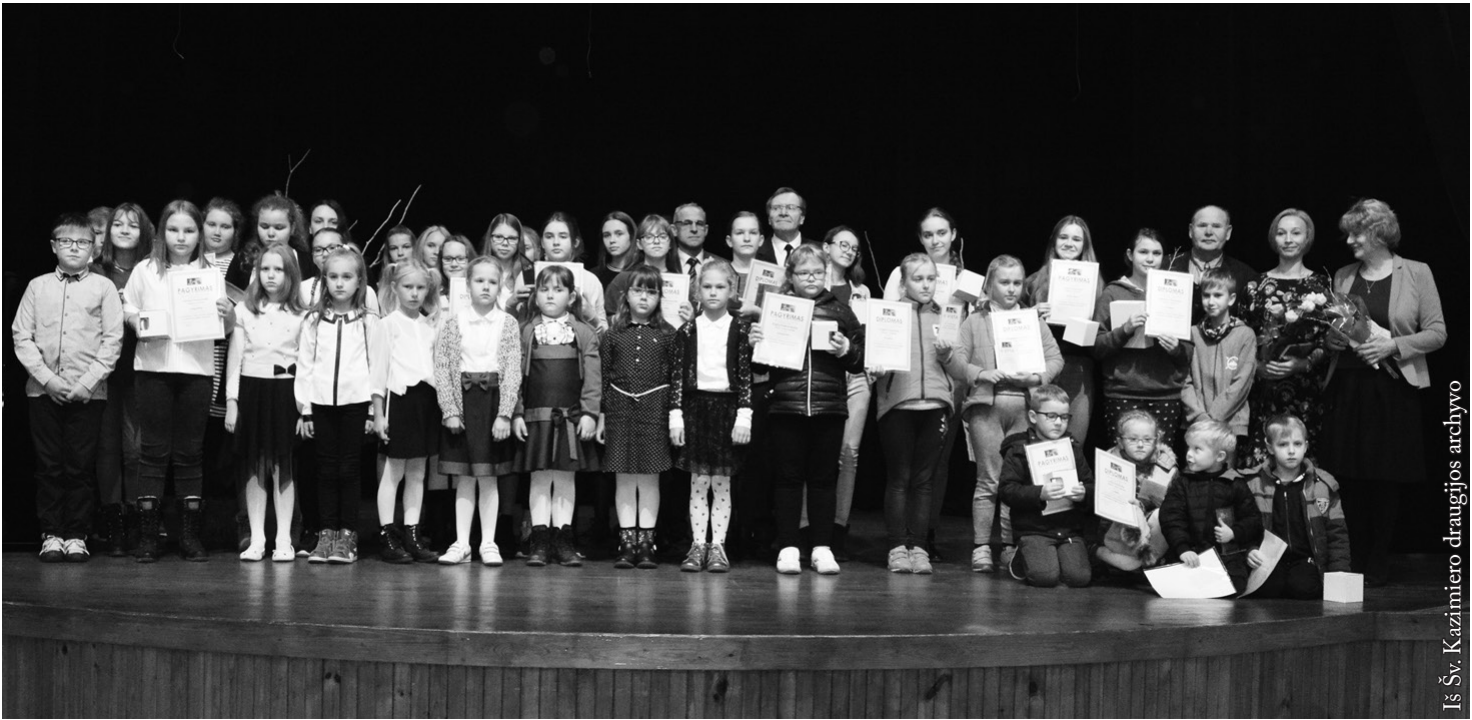
Iš Šv. Kazimiero draugijos archyvo