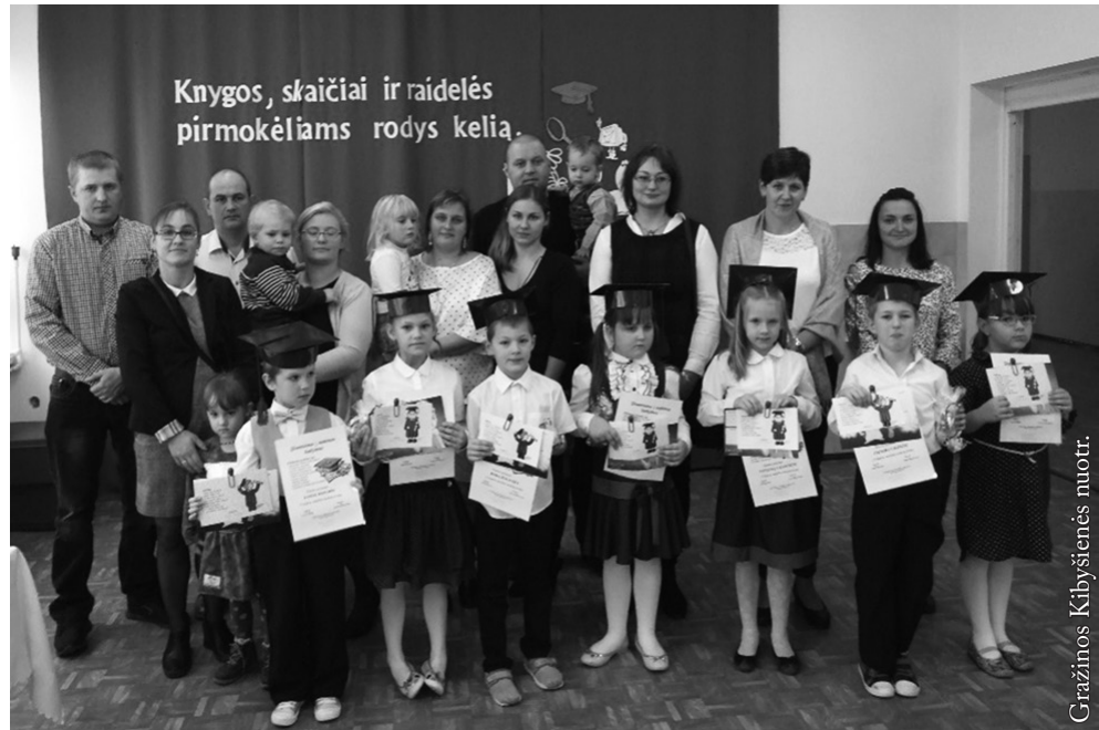
Pirmokai ir jų tėveliai

Renginys prasidėjo trumpa pirmokų programėle. Vaikučiai nuostabiai deklamavo eilėraštukus, kuriais sveikino skaičius ir raideles, džiaugėsi, kad jau išmoko nemažai raidelių ir sugeba parašyti pirmą žodį bei sakinį. Įrodė, jog dainuodami moka suskaičiuoti iki 10 bei pagroti įvairiais instrumentais. Skambiomis dainomis sužavėjo visus žiūrovus, net ir savo jaunesnius broliukus ir sesutes. O kad