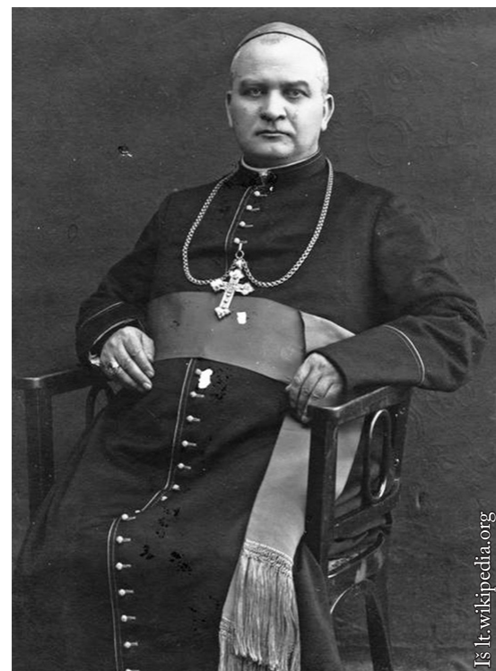
Palaimintasis Jurgis Matulevičius-Matulaitis MIC

Netrukus po bažnytinės teritorijos administracinio teritorinio pertvarkymo, tai yra naujų vyskupijų įsteigimo (tuomet vietoje likusios Seinų vyskupijos dalies Lietuvoje buvo įsteigta Vilkaiviškio vyskupija), Lietuvos Seimo rinkimus netikėtai laimėjo Katalikų Bažnyčia nepalan-