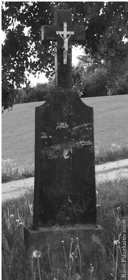
Senas Žagarių kryžius (buv. Ragožių kaimo)