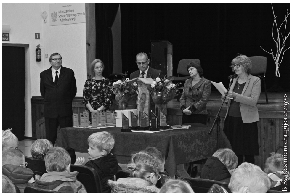
Šv. Kazimiero draugijos konkurso vertinimo komisija ir rengėjai

Nutilus instrumentams prasidėjo ilgai lauktas momentas – konkurso rezultatų paskelbimas. Konkursui pristatyta 17 eilėraščių ir 78 piešiniai iš Seinų lietuvių „Žiburio“ mokyklos, Vidugirių pagrindinės mokyklos,