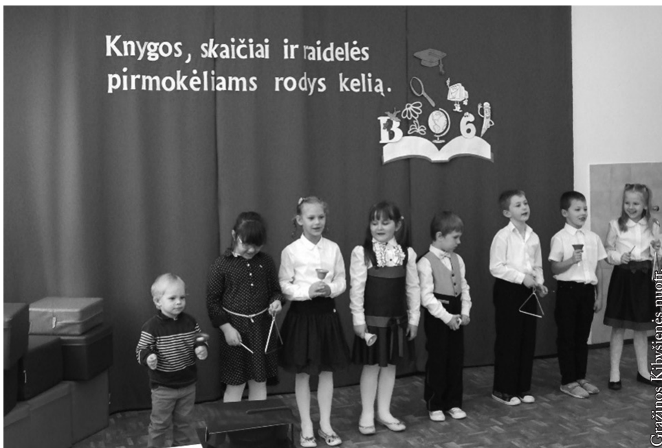
Mūsų pirmokėlių pasirodymas

Šventę užbaigė bendra nuotrauka. Labai džiaugiamės, kad prie Vidugirių mokyklos moksleivių brolijos prisijungė septyni šaunūs mokinukai. Po šios šventės jie išdidžiai gali save vadinti mokiniais.