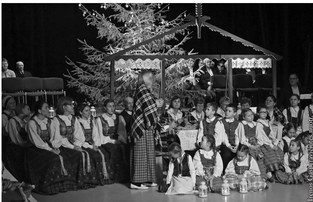
Adventinio vakaro dalyviai

Renginį rėmė Lenkijos Respublikos vidaus reikalų ir administracijos ministerija.