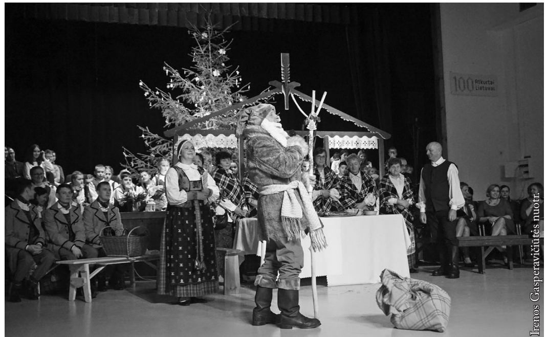
Kalėdų Senelis aplanko vaikus

Nuo to laiko nemažai vandens nutekėjo, keitėsi renginio forma, vieta, bet ir lietuvių padėtis Seinuose, ir patys lietuviai. Šimetis vakaras subūrė tiek žmonių,