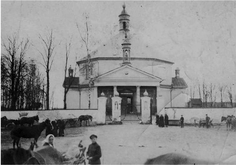
Griškabūdžio bažnyčia 1923 m.

savo šalies garbingą praeitį, todėl daug laiko praleido besimokydamas vokiečių ir prancūzų kalbų.