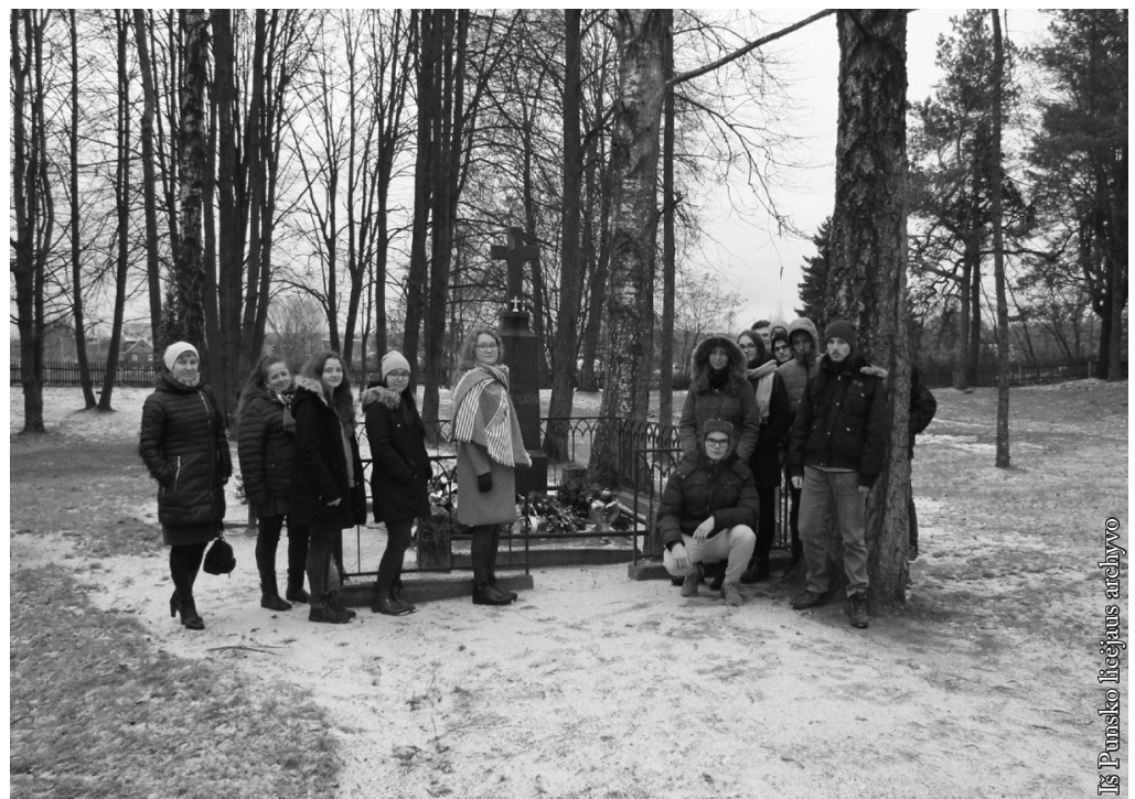
Prie Emilijos Pliaterytės kapo