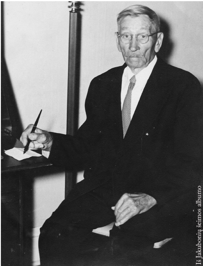
Iš Jakubonių šeimos albumo