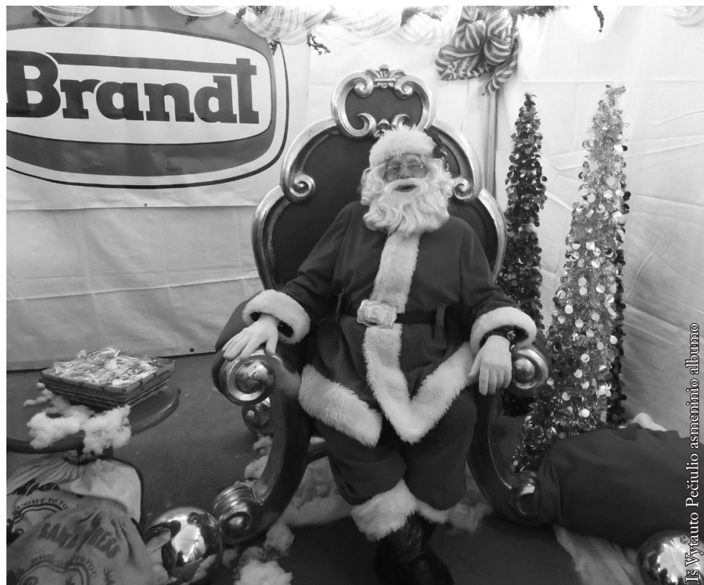
Kalėdų Senelis vokiečių parduotuvėje „Brandt“ įrengtame soste

Kai ateidavo tikros Kalėdos, jos jau nebuvo įdomios ir prasmė mažesnė. Namuose ruošiantis šventei buvo stengiamasi laikytis papročių,