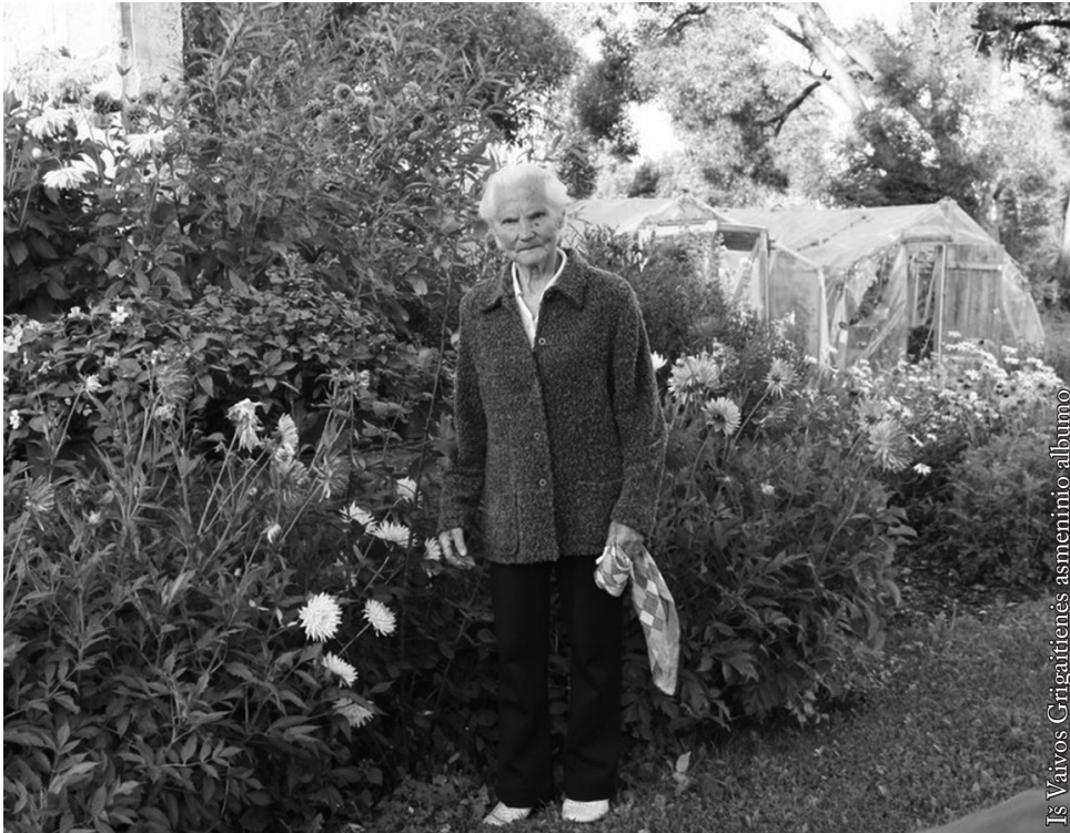
Mamytė savo darželyje