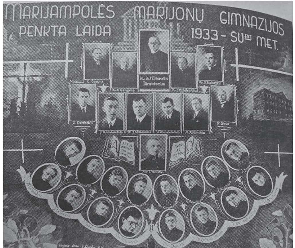
Marijampolės marijonų gimnazijos 5 laida. 1933 m.

1917 m. J. Totoraitis dalyvavo kon-ferencijoje Vilniuje, kur buvo išrink-ta Lietuvių Taryba. Konferencijos metu su keletu kunigų susitarė įsteig-ti Marijampolėje „Žiburio“ gimna-ziją. Gimnazija atidaryta 1918 m.