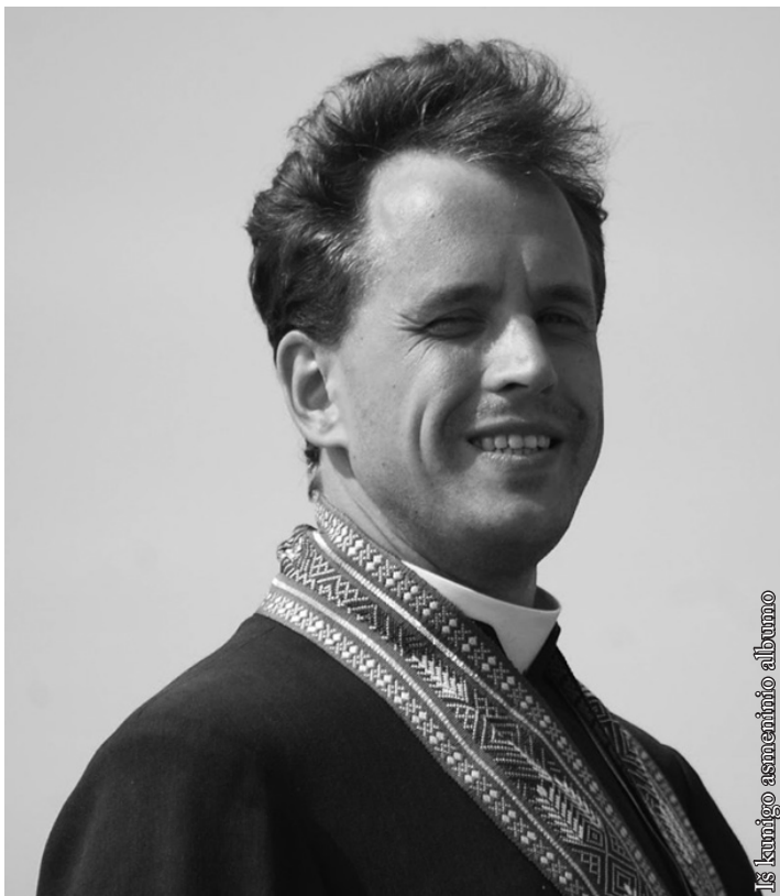
Iš kunigo asmeninio albumo

Nuo vaikystės svajočiau ir galvočiau apie kunigystę. Šį šventąjį sakramentą rinkausi baigęs Vilniaus Radvilų gimnaziją. Greit sulaukiau pasiūlymo ir gavau nukreipimą į Lenkiją, kur teko studijuoti teologiją Balstogės arkivyskupijos dvasinėje seminarijoje. Šventosios teologijos magistro laipsnį įgijau Varšuvos kardinolo Stepono Višinskio universitete. Katechetikos studijas baigiau