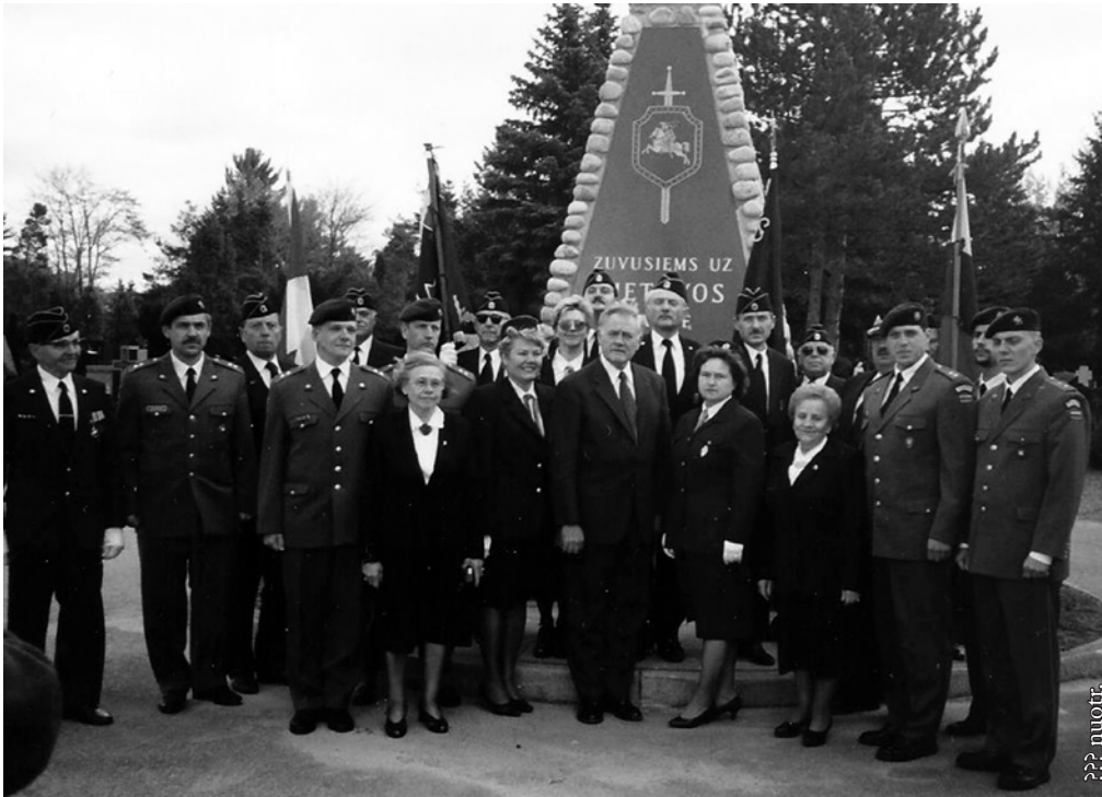
Prezidentas Valdas Adamkus lankėsi 1999 m. Kanadoje, prieš susitikimą su lietuviais Toronte lietuvių kapinėse padėjo vainiką prie paminklo „Žuvusiems už Lietuvos laisvę“