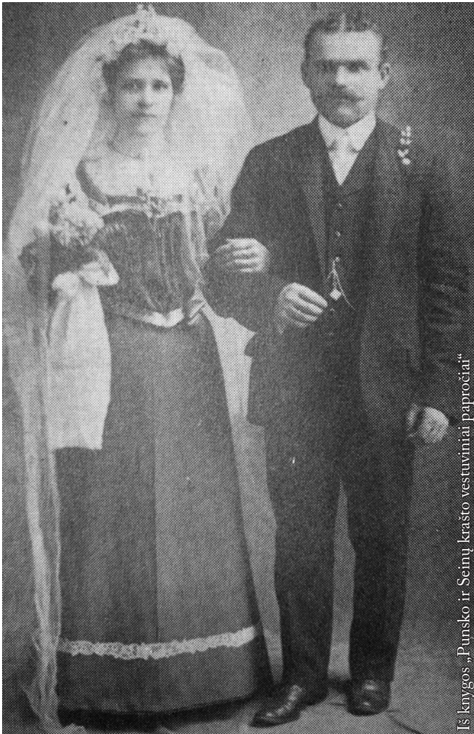
Iš knygos „Punsko ir Seinų krašto vestuviniai papročiai“

Anuomet piršlybos vykdavo iš išskaičiavimo. Nėra ko daug kalbėti apie meilę, jausmus ir atsidavimą. Pagalvojus, kokia ten ta meilė buvo, jeigu būsimi sužadėtiniai pasimatydavo vieną arba geriausiu atveju du kartus prieš vestuves. Kaip sakyta: „Meilė atsiradavo paskui, o kap jos nebūdavo, tai ir tep turėj būc gerai. Jūngė vaikai, bendras gyvenimas, nu, pripracimas. Kur tu dėsiš...“ Taip ir gyveno žmonės, negalėdami apibrėžti meilės jausmo. Gerai, kai ji įgudavo pagarbos vienas kitam įvaizdį, o jeigu ne, tuomet reikėjo gyventi, kaip buvo pažadėta prieš Dievą. Kaip pavyzdį, norėtusi pasidalyti istorija, kuri, atseit, yra tikra. Vieną kartą dvarponiu pasidavęs jaunuolis nuvažiavo į Lietuvą žmonos parsivežti. Na, iš tikrųjų pasipiršti ir greitai susituokti su nusižiūrėta dvaro šeimininkų dukra. Sunkiai suvokiamomis aplinkybėmis jaunuolis suviliojo panelę, vedė ir parsivežė į lietuvių kaimą šiandieninės Lenkijos teritorijoje. Jaunamartė klausia savo vyro: „Na, tai kurgi tas tavo dvaras, kad aš čia nieko nematau panašaus?“ Išlaipino vargšę plikam kieme, kur stovėjo aptrupėjęs lūšnelė, panaši į palinkusį svirną. Moteris negalėjo patikėti, kad šitaip ją galėjo apgauti. Nieko negalėjo padaryti. Teko priprasti prie skurdo. Sulaužyti duoto žodžio prieš Aukščiausiajį buvo