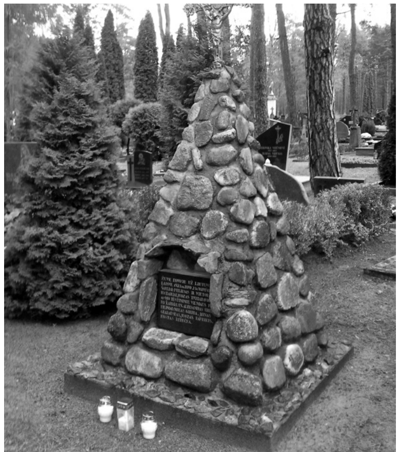
1923 m. kovo 23 d. Varviškės mūšyje žuvusių karių ir šaulių atminimui 2011 m. birželį pastatytas paminklas Leipalingio mstl. kapinėse. 2016-10-26.