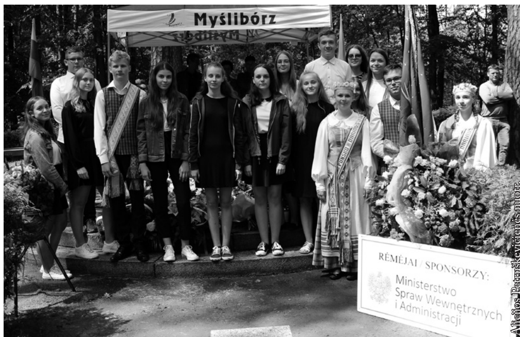
Punsko Dariaus ir Girėno mokyklos delegacija Pščelnyke

programą – padainavome kelias lietuviškas dainas.