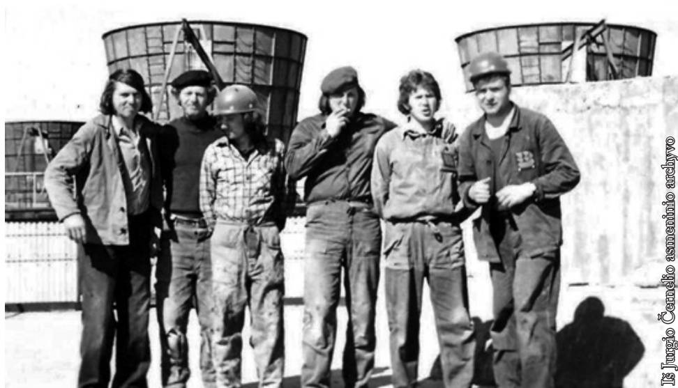
1975 m. Rybnike. Elektrinės statyba