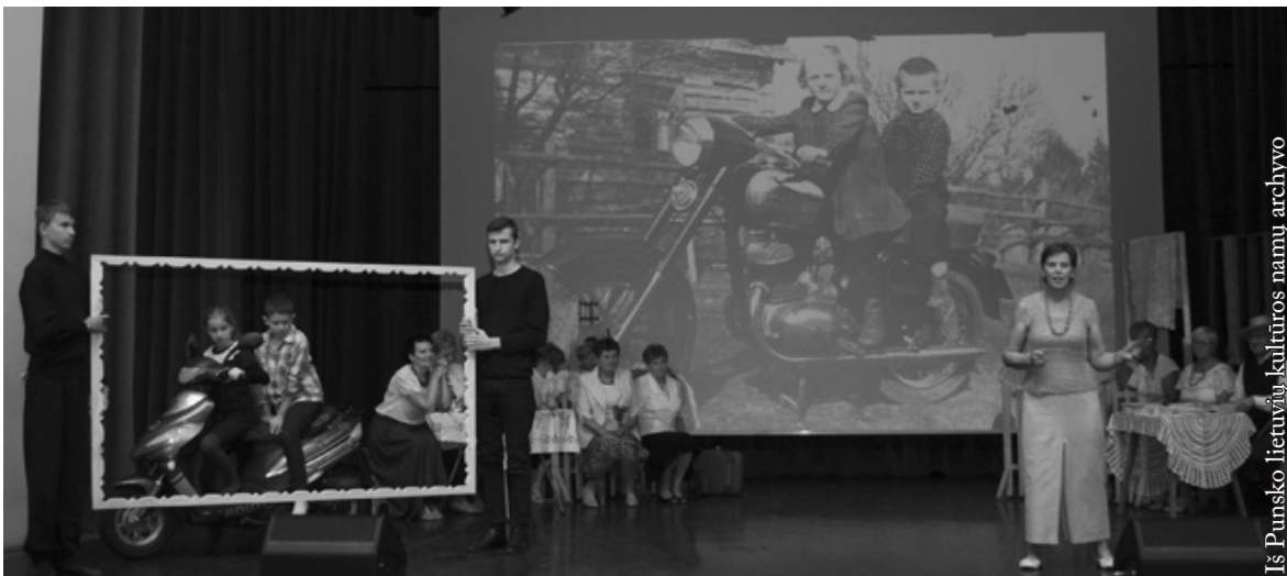
Punsco III amžiaus universiteto ir Kovo 11-osios licėjaus jungtinis teatras