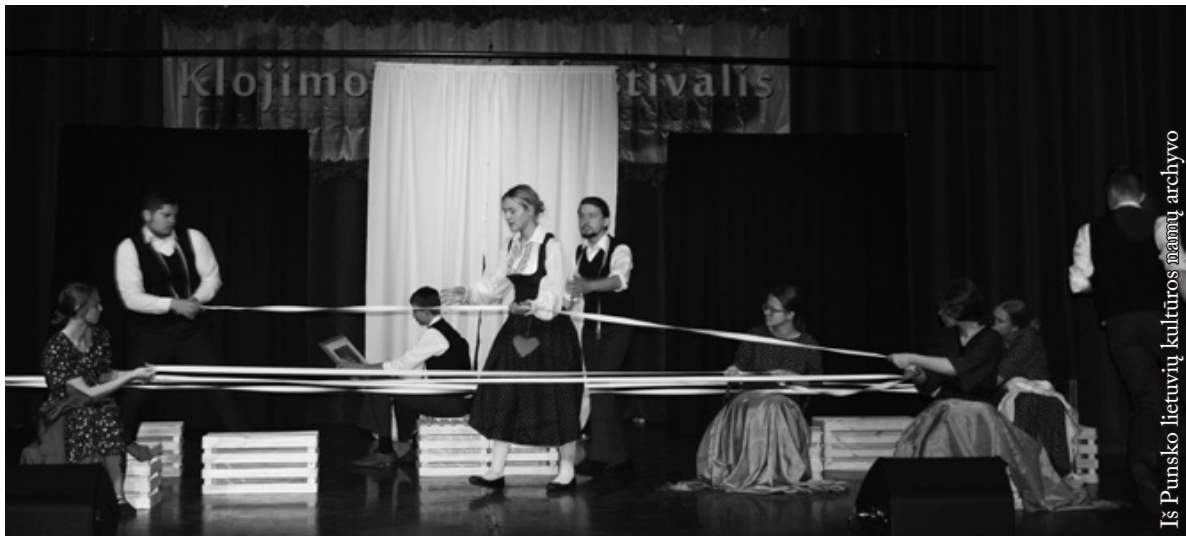
Punsco LKN jungtinis teatras

„Aušros“ numeryje, tad pasidalysiu informacija, kur šitas pastatymas buvo suvaidintas – Birštono festivalyje „Jausmų sala“, Šakiuose ir didžiausiame Baltijos šalių teatrų festivalyje „Baltijos rampa“ Kretingoje. Pastarajame punskiečiai atstovavo pasaulio lietuviams, mat 2019-ieji –