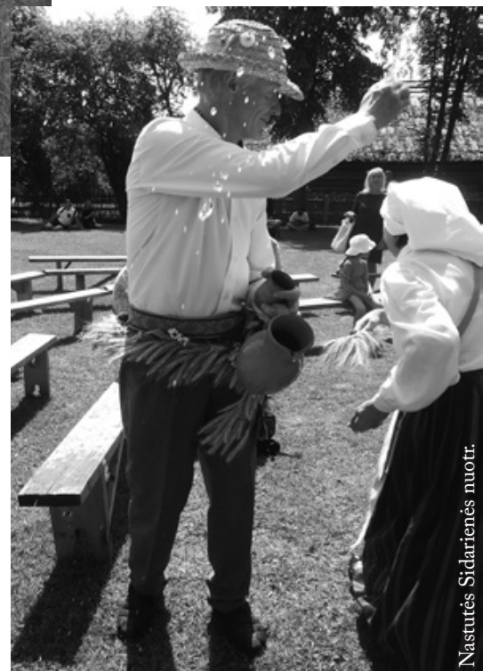
Po sunkaus darbo šeimininkas palieja vandeniu