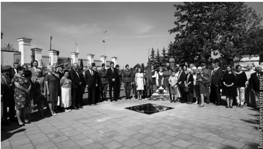
Atidengiama susitaikymo lenta

Atidengus lentą, oficialioji valdžia nuėjo padėti gėlių prie vadinamojo sukilimo paminklo, o visi renginyje dalyvavę lietuviai gėlių puokštę padėjo prie vysk. Antano Baranausko paminklo, nuvyko į Seinų ir Berznyko kapines, kur pagerbė Lietuvos savanorių atminimą, ir padėjo gėlių ant Seinų mūšyje žuvusio lenkų kario kapo, uždegė žvakutę ir prie Seinų „Žiburio“ mokyklos kieme esančio paminklo Lietuvos savanoriams, kovojusiems už Lietuvą.