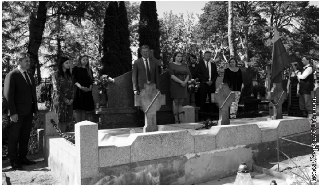
Prie Lietuvos savanorių kapų Seinuose