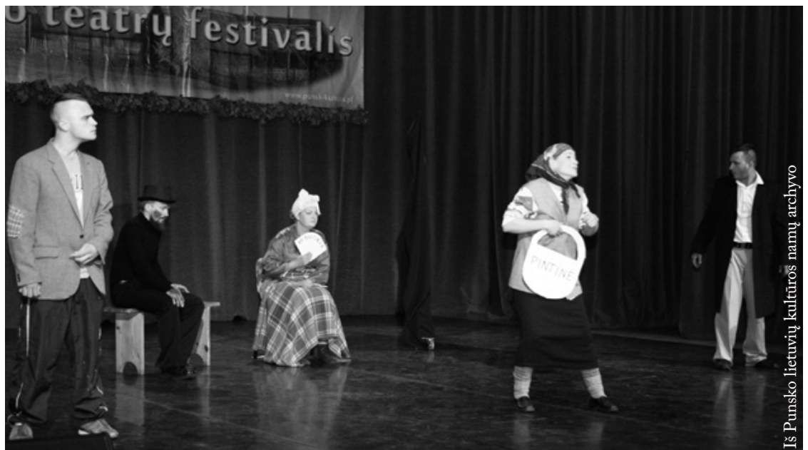
Meno fondo „Art Club“ teatras „Aurora“