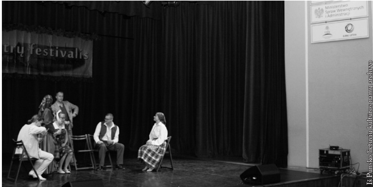
Suvalkų lietuvių teatras