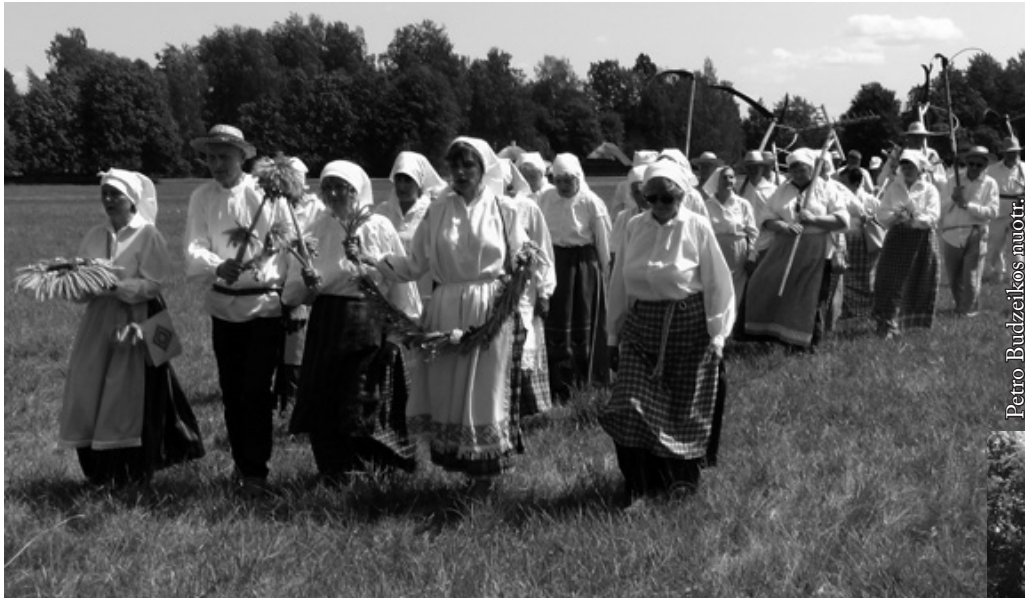
Namo iš laukų