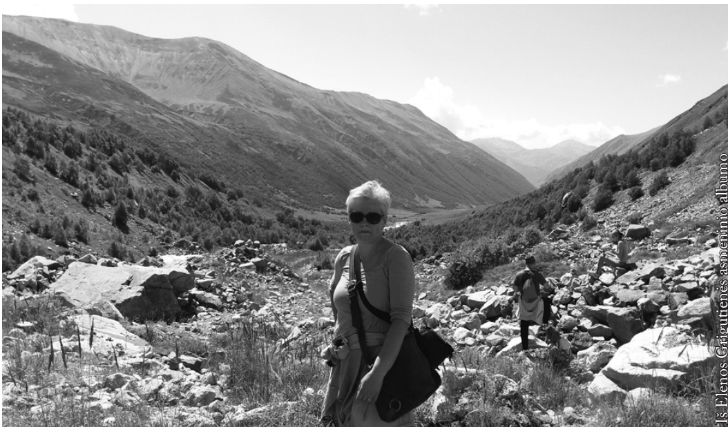
Sakartvelas 2017 m.

J. S.: Leiskite truputėlį paironizuoti. Bet ar pas mus nėra vis dar gyvas požiūris, kad moteriškai po 40-ies laikas rištis skepetą ir sėdėti šiltai namuose? Nuo senų laikų, net ir pačioje lietuvių literatūroje yra pavyzdžių, kad laužiančias stereotipus greitai pasiekdavo aplinkinių apkalbos, piktas žvilgsnis, pagrūmojimai.