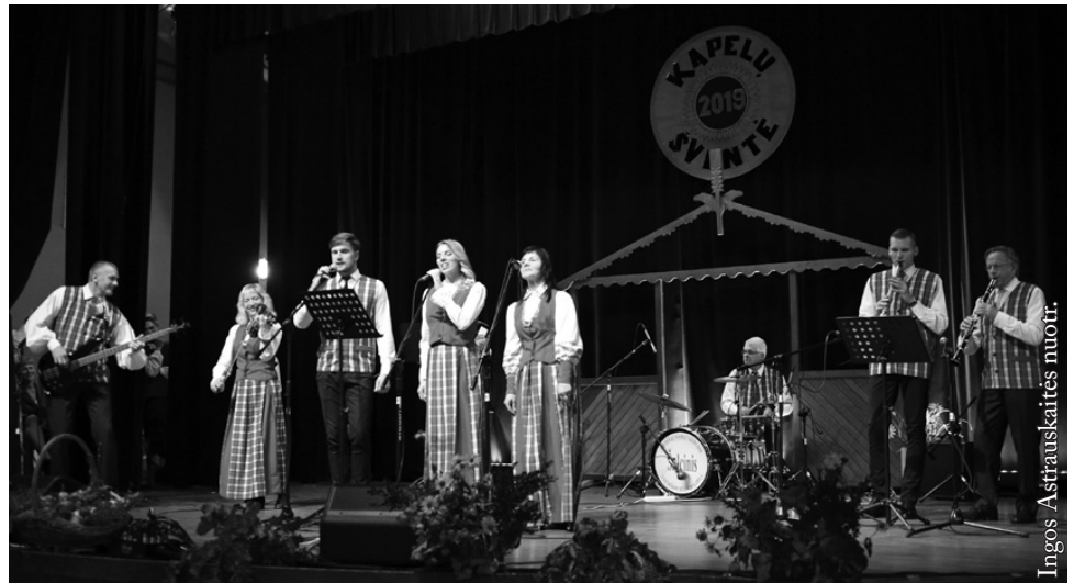
Kauno miškų ir aplinkos inžinerijos kolegijos liaudiškos muzikos kapela „Laumena“