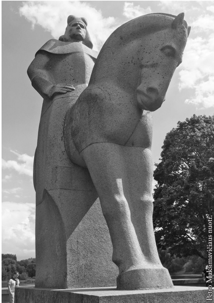
Vytauto paminklas Birštone