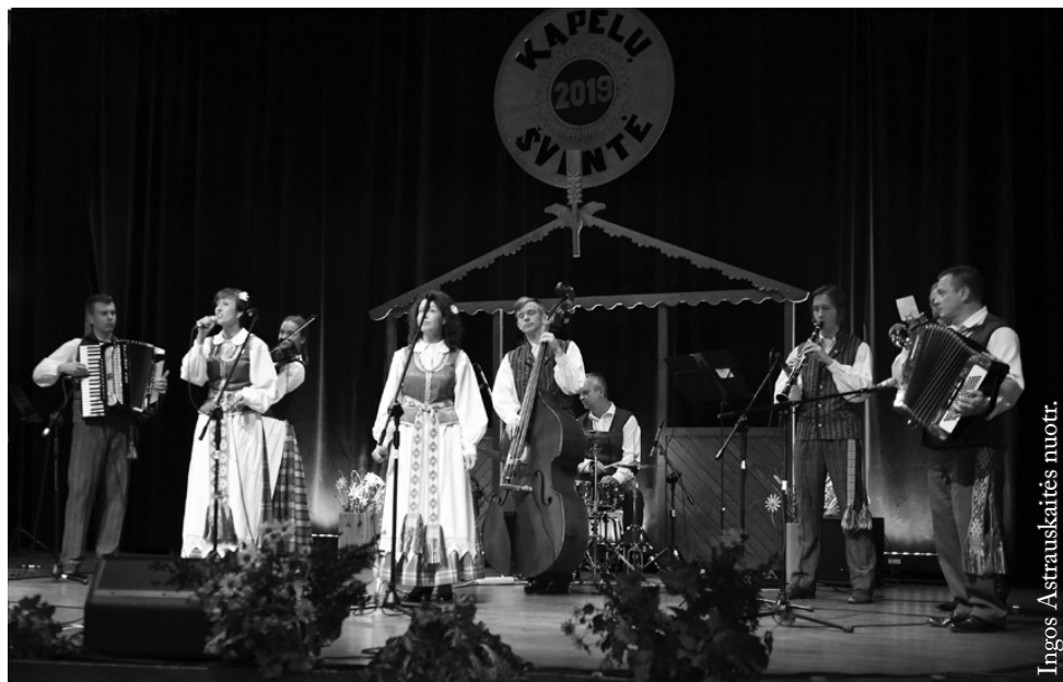
Punsko lietuvių kultūros namų kapela „Klumpė“