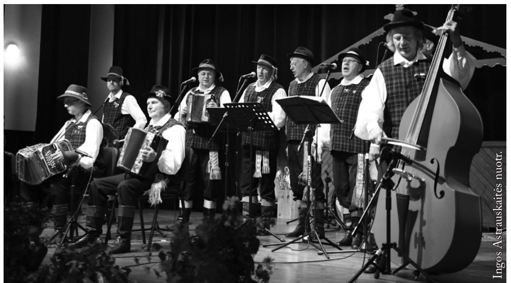
Jurbarko kultūros centro kapela „Santaka“

2006 m. spalio mėn. susikūrė Kauno miškų ir aplinkos inžinerijos kolegijos liaudiškos muzikos kapela „Laumena“. Kapelos branduolį sudaro 13 muzikantų – įvairių profesijų žmonės. Repertuare skamba tradicinė lietuvių autorių muzika bei pačių kurtos ir aranžuotos lietuvių liaudies dainos. Dalyvavo įvairiose Lietuvos regionų šventėse, kapelų varžytuvėse,