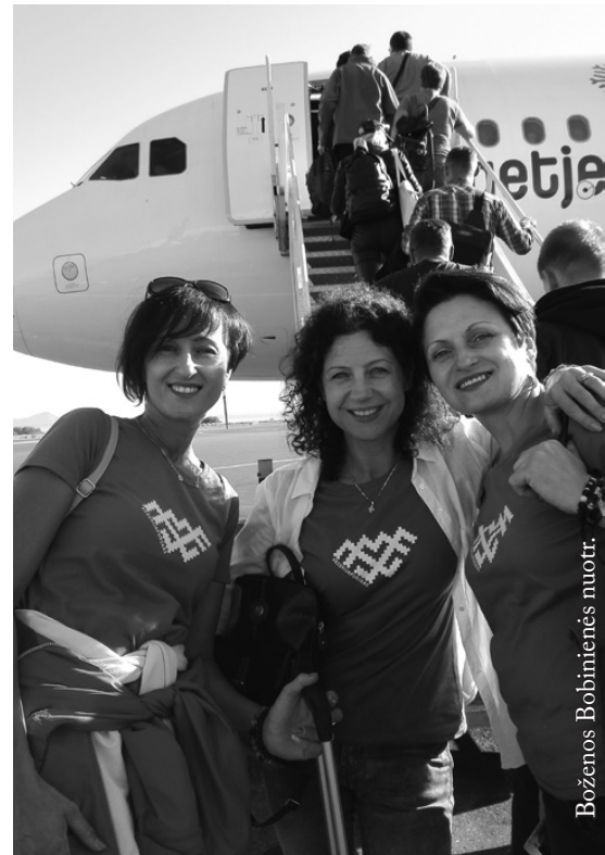
Lipame į lėktuvą

Bet sugrįžkime į rugsėjo mėnesio pabaigoje vis dar karštą Kretą – atslinkusio rudens ūkanose