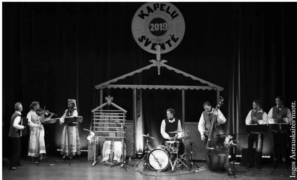
Vilniaus kolegijos šokių ir dainų ansamblis „Voruta“