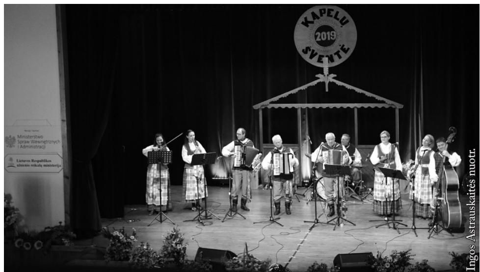
Seinų „Lietuvių namų“ liaudiškos muzikos kapela „Šalcinis“