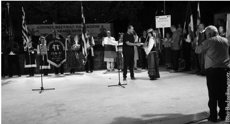
„Dzūkijos“ kolektyvui įteikiamas padėkos raštas