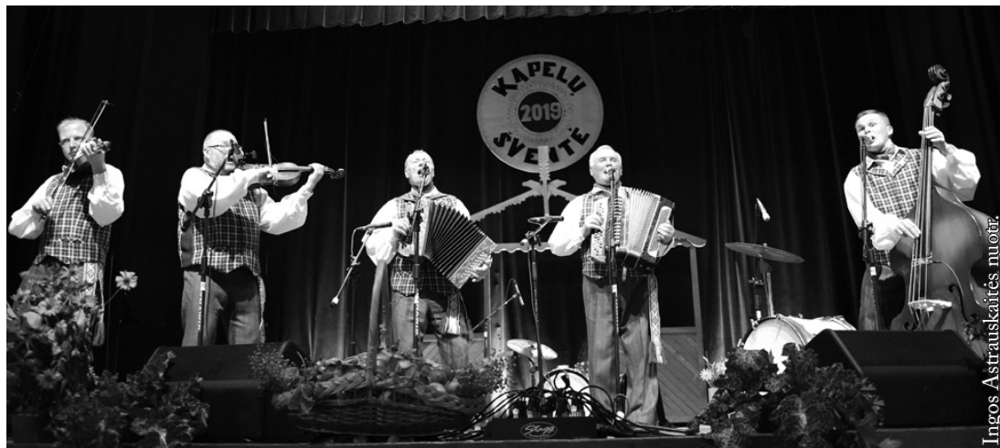
Alytaus rajono liaudiškos muzikos kapela „Pivašiūnai“

festivaliuose. Apdovanota padėkos raštais, atminimo dovanėlėmis, skynė ir didžiųjų laurų. Vienas įsimintiniausių – gyvas kalakutas, kuris svėrė per 20 kg (laimėtas Marijampolės sav. Šunskuose). Koncertavo užsienyje, taip pat ne vienus metus pasirodo LRT televizijos laidose „Gero ūpo“ ir „Duokim garo“. Dainos skamba ir radijo „Pūkas“ bangomis.