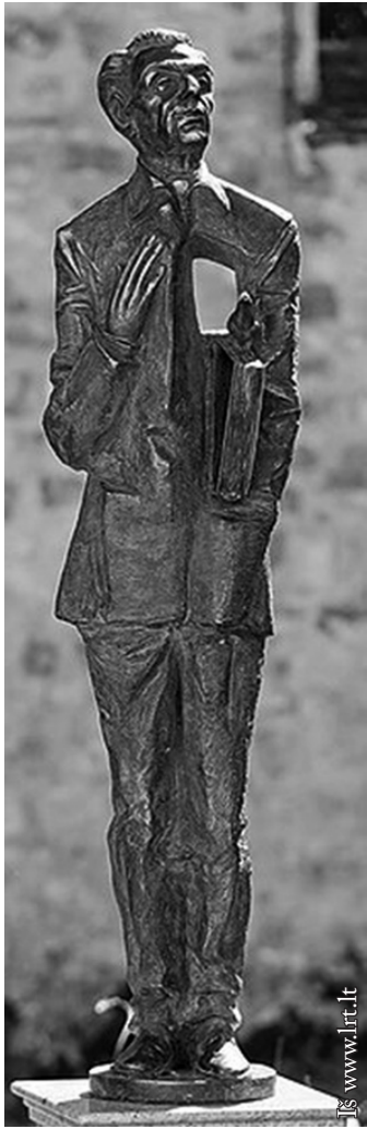
Oskaro Milašiaus skulptūra atidengta š. m. rugsėjo 15-ąją Prancūzijoje

Oskaro Milašiaus nuopelnai šiame darbe buvo neįkainuojami. Niekas kitas nemokėjo taip suredaguoti įvairių raštų prancūzų kalba kaip jis – prancūzų kalba kuriantis poetas. Jau vien dėl puikiausių politikos raštų stiliaus jie buvo perskaitomi ir stebimasi – iš kur tie lietuviai taip puikiai moka prancūzų kalbą.