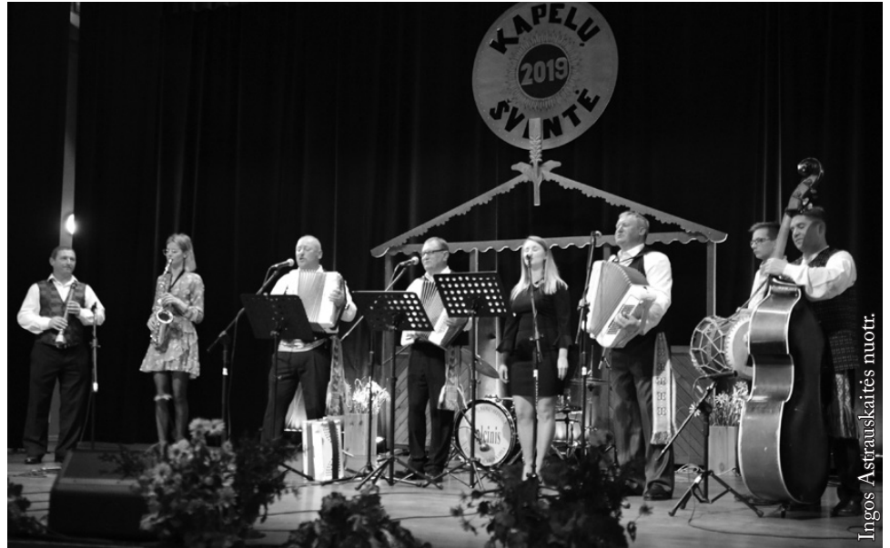
Vidugirių kaimo kapela

Ačiū visiems už buvimą kartu, austringus plojimus ir gerą nuotaiką. Juk muzika – tai galingas įrankis, suvirpina sielą, suteikia atsipalaidavimą bei padeda išgyventi sunkumus.