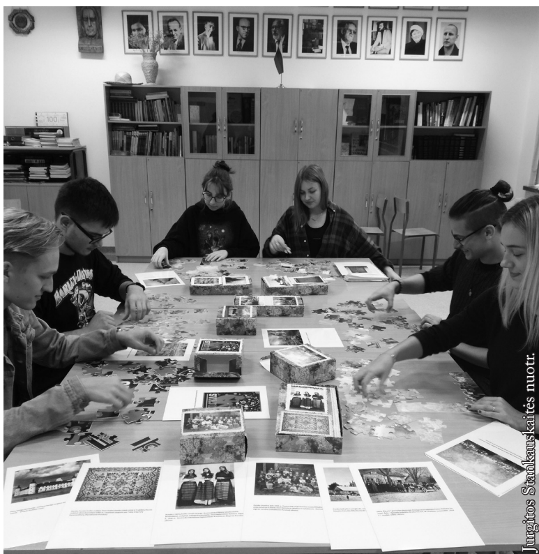
Trečios klasės mokinių grupė dėsto dėliones

Kitame puslapyje akis numargina mūsų lovatiesė, kuri labai susijusi su anksčiau matyta choristų nuotrauka. Seniau kaimuose statomų vaidinimų metu pasirodydavo ir choristai. Šių artistų scena visuomet būdavo puošiama lovatiesėmis. Ši