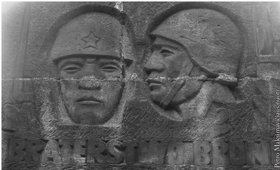
„Lilka“ paminklo postamentas

jos fotografuodavosi ir kaip senais laikais siųsdavo pažįstamiems nuotraukas su Seinų „simboliu“.