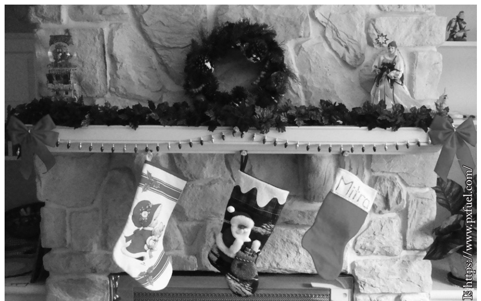
Kojinės laukia dovanų

Danijoje per Kūčias valgomi saldūs ryžiai su cinamonu ir obuoliais įdaryta kepta žąsis. Tradicinis patiekalas yra pudingas su ryžiais, kuriame šeiminiškė paslepia migdolą. Kas jį randa, gauna marcipanineį kiaulytę, kuri neša laimę visus metus.