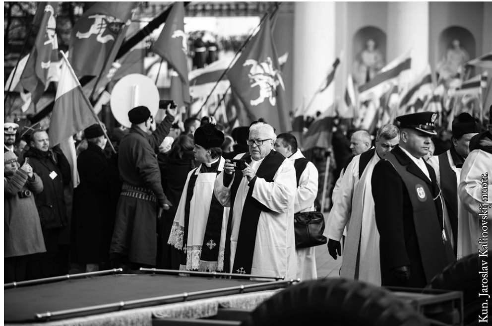
1863 m. sukilimo dalyvių laidotuvės