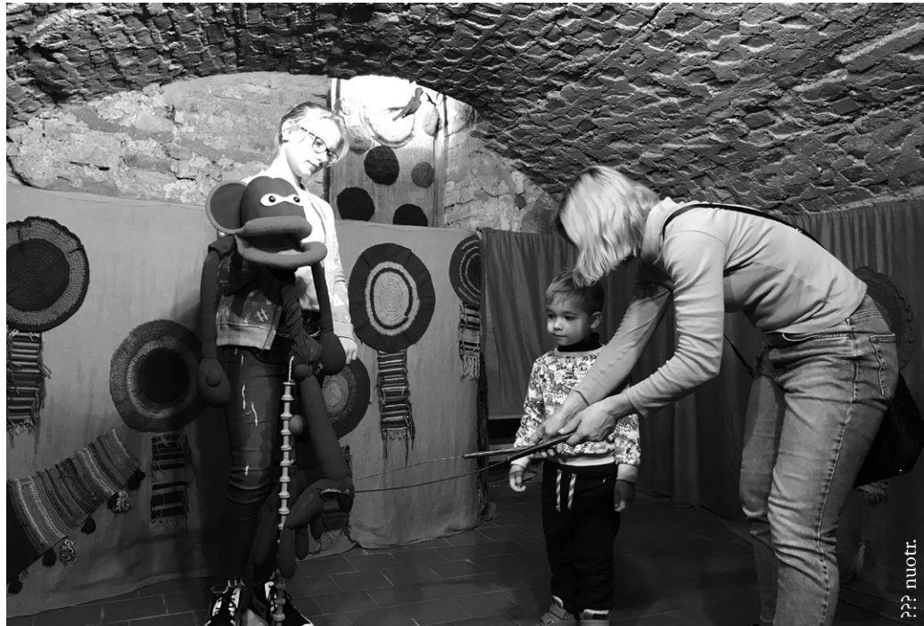
Lietuvos teatro, muzikos ir kino muziejuje Vilniuje

Lietuvos teatro, muzikos ir kino muziejuje vyko edukaciniai užsiėmimai šeimoms. Pradžioje vedėja supažindino susirinkusius su lėlėmis, kurios seniau dalyvavo įvairiuose spektakliuose, o dabar