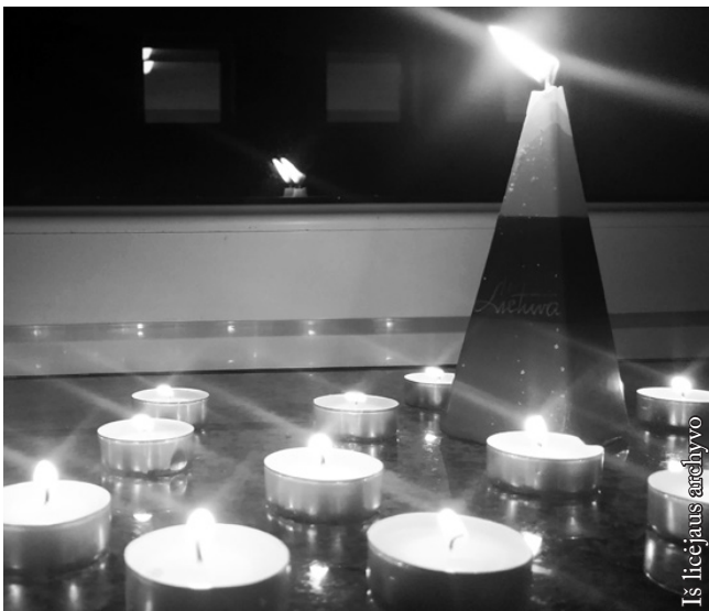
Iš licėjaus archyvo