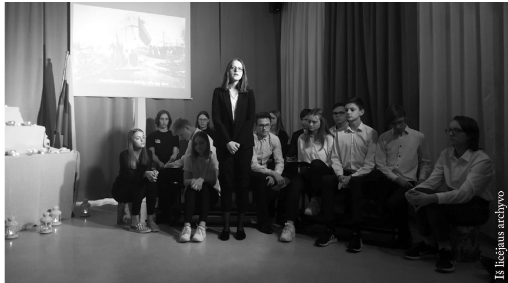
Iš licėjaus archyvo