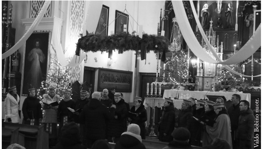
Punsco Švč. Mergelės Marijos Dangun Ėmimo bažnyčioje