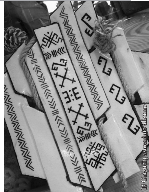
Elenos Grigutienės keramika