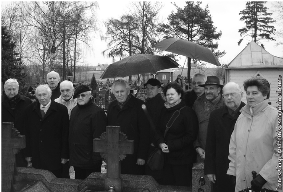
Kovo 11-osios signatarai, lydimi LLB atstovų, prie Lietuvos savanorių kapų Seinų kapinėse, 2007 m.

V. P.: Kaip vertinu, gal nusakysiu keliais pavyzdžiais. Jau 2013 m.