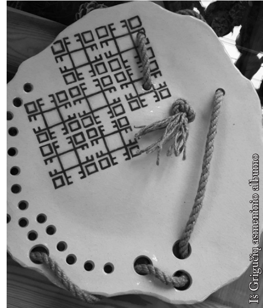
Iš Grigučių asmeninio albumo