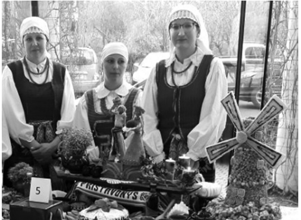
Pristavonių kaimo šeimininkės

Konkursas vyko vasario 20 d. Balsotogės operos ir filharmonijos teatre. Viską pasiruošėme, susikrovėme ne