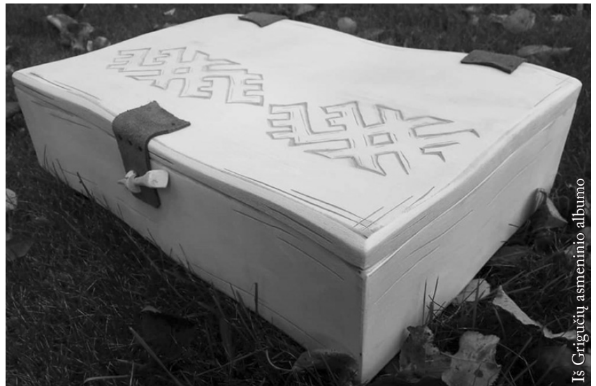
Juozo Grigučio išdrožta medinė skrynelė