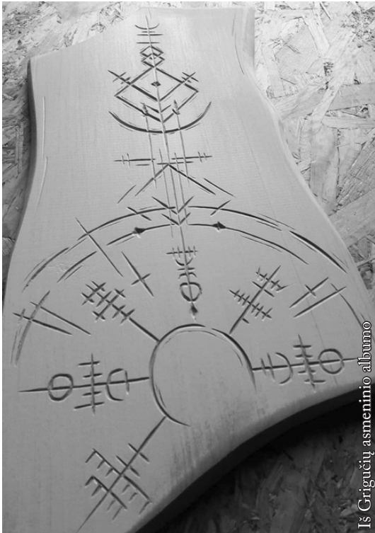
Juozo Grigučio medžio dirbiniai