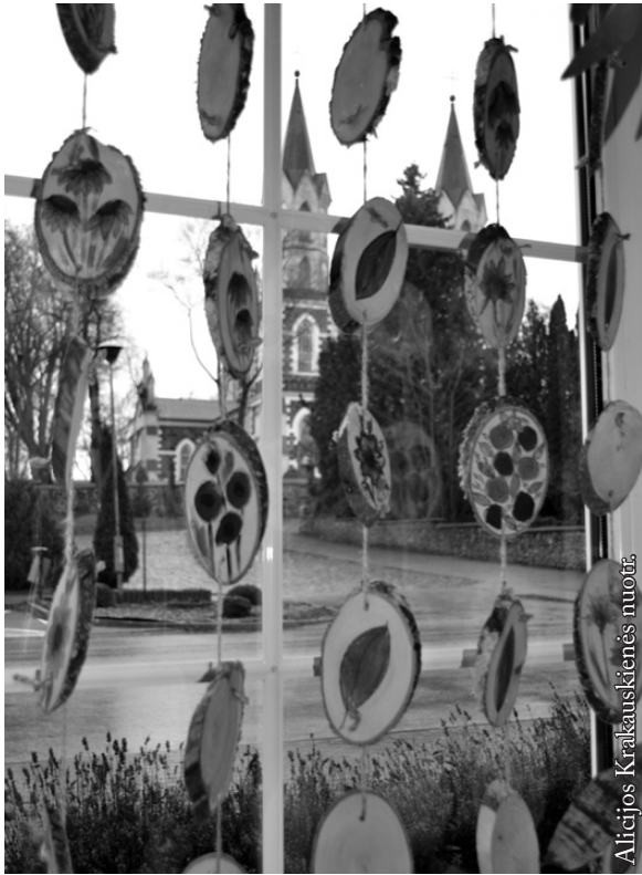
Floristikos meno studijoje