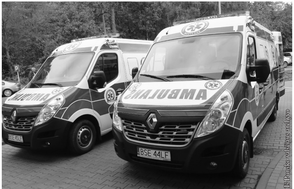
Iš Punsco valsčiaus archyvo

Europos regioninės plėtros fondo lėšomis pagal 2014–2020 metų „Interreg V-A“ Lietuvos ir Lenkijos bendradarbiavimo programą Punsco valsčiui pavyko įkurti ir įrengti 2 naujus kabinetus Punsco ambulatorijoje: ginekologijos ir akių gydymo, taip pat pagerinti naują stomatologijos kabinetą. „Pasienio regiono partnerystės stiprinimas