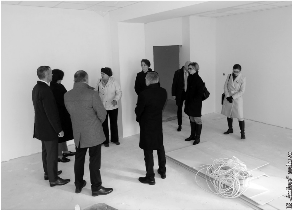
Būsimo Suvalkų vaikų darželio patalpose