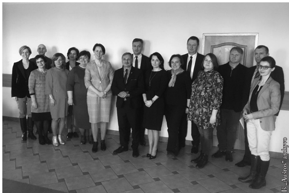
Suvalkų švietimo skyriuje

Viceministras taip pat informavo, kad artimiausiu metu bus siekiama