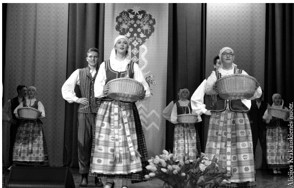
Šokių grupė „Šalčia“