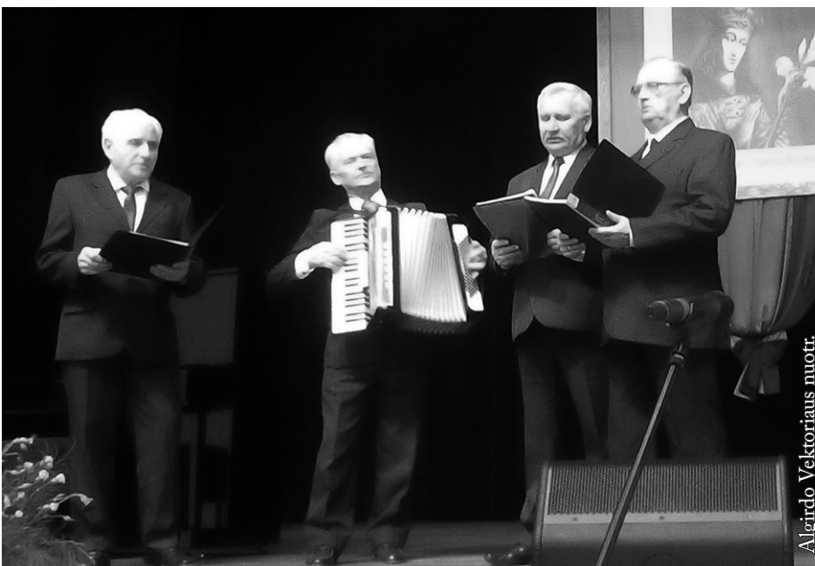
Šv. Kazimiero draugijos vyrų kvartetas

Pradžią Šv. Kazimiero draugijai davė 1888 m. Kaune klieriko Juozo Tumo-Vaižganto iniciatyva