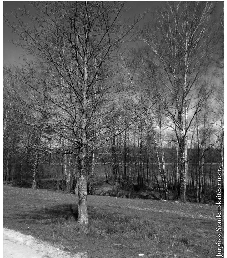
Atgyjanti žolė po beržu

Prieš mėnesį šukuojant savo dienotvarkės planus, glostant sutvarkytų reikalų varneles, pačios kojos nuvedė mane prie veidrodžio. Bandžiau prisiminti, kada paskutinį kartą prie jo praleidau bent penkias minutes. Pamačiau riaumojantį liūtą su nežmoniškai ilgais iltiniais dantimis, kuriais netyčia nukando nagą. „Fu, mama, tį kiminai“, – būtų pasakiusi mano dukra. Laimei, ji šito nematė. Priešingu atveju būtų bandžiusi paragauti savo nematomo rankyčių turto. Liūtui teko apsilankyti pas kirpėją.