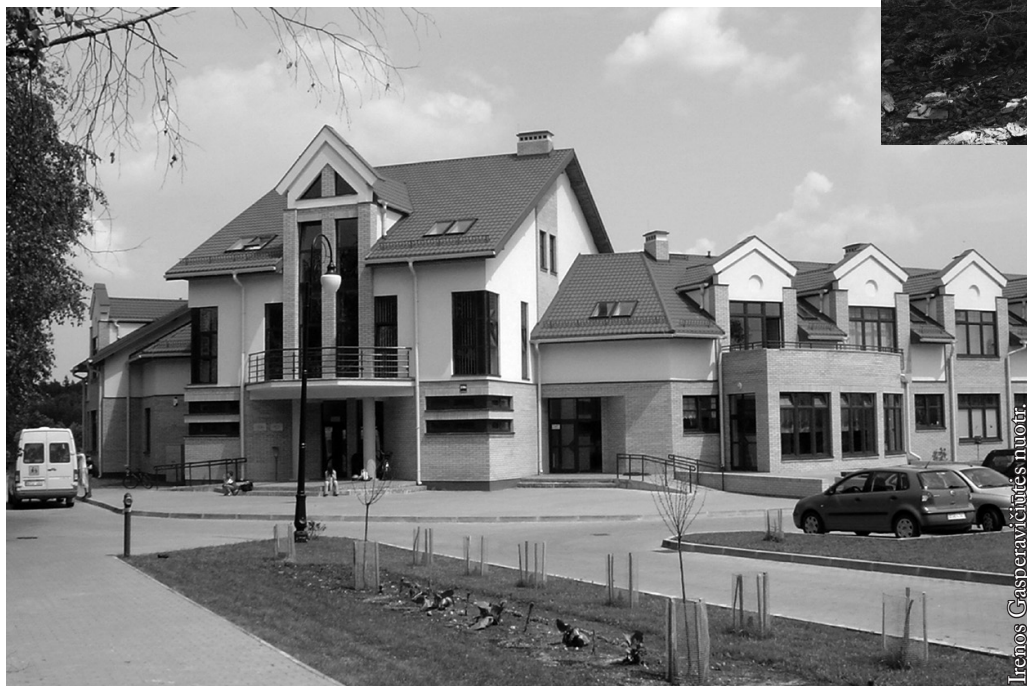
Seinų lietuvių „Žiburio“ mokykla

Į mokyklą tėvai įeina pavieniui. Kas dieną dezinfekuojami plokštieji paviršiai, durų rankenos, turėklai, žaislai. Dezinfekuojama ir žaidimų aikštelė prieš vaikams į ją įeinant. Vaikai negali išeiti už mokyklos teritorijos. Tokie tie esminiai pasikeitimai.“ Ir priduria: „ Primename, kad Seinų lietuvių „Žiburio“ darželyje dar yra laisvų vietų kitiems mokslui metams. Norinčiuosius raginame jau užrašyti savo vaikelius. “