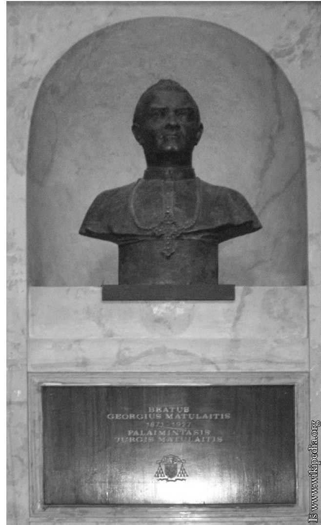
Palaimintojo Jurgio Matulaičio paminklas Vilniaus arkikatedroje