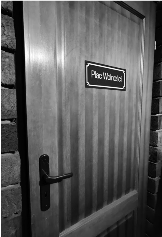
Pogrindžio kirpykla Lenkijoje

besiformavusios tapatybės. Jie net nepamąsto: o kada toji Amerika buvo galingesnė, turtingesnė ir modernesnė nei dabar, XXI amžiuje? Ar prekybos vergais laikais, Vietnamo karo metu, o gal kai N. Armstrongas atsisėjo ant Mėnulio paviršiaus? Įdomu, kad ne dabartinis JAV prezidentas šį šūkį sugalvojo. Šiuos žodžius Amerikos lyderiai kartoja jau nuo R. Reigano laikų ir visada, įvairių krizių metu pavyksta jiems mobilizuoti ir teigiamai nuteikti didžiąją dalį visuomenės.