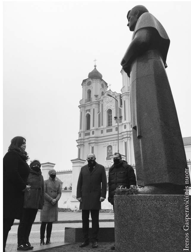
Lapkričio 26 d. paminėtos Seinų vyskupo ir lietuvių poeto Antano Baranausko mirties metinės