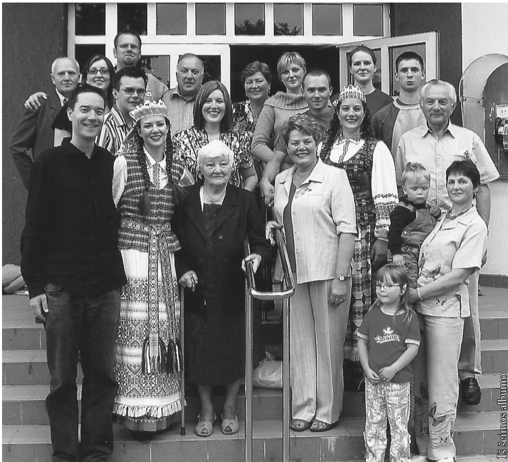
Punske su giminėmis, koncertuojant Toronto „Gintaru“

darželį. Užklausėm, ar patinka. Atsakė: „Darželyje mokytojos mums liepia kalbėti tik lietuviškai, o jos tarp savęs pasikalba angliškai. Matyt, nori, kad mes nesuprastum.“