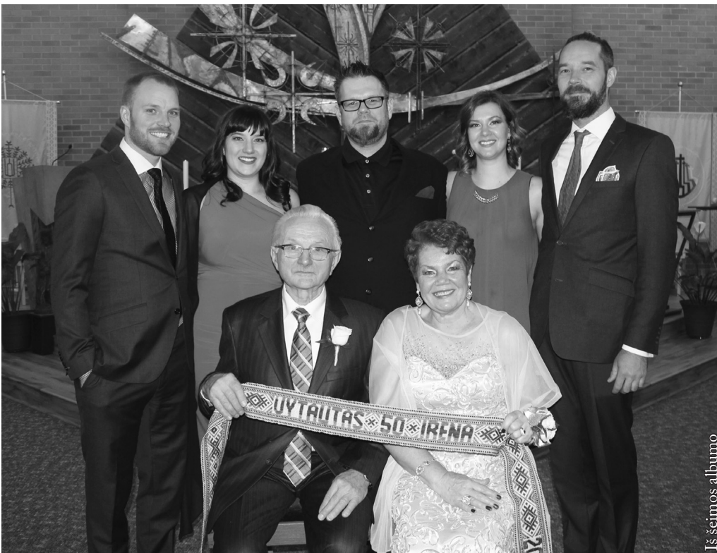
Iš šeimos albumo