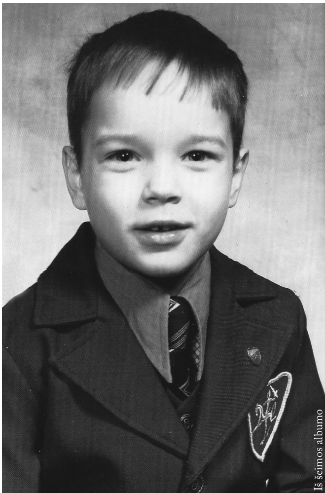
Iš šeimos albumo

Mirties angelas nelaukiamas svečias ir jam apsilankius viskas pasikeičia. Ko gyvenime nesitikėjom, mūsų šeimoje atsitiko. Netektis aplankė netikėtai – staiga mirė mūsų pirmagimis, gyvenęs prasmingą gyvenimą. Tėvams ir šeimai labai sunku tai išgyventi, labiausiai – su tokiu likimu susitaikyti.