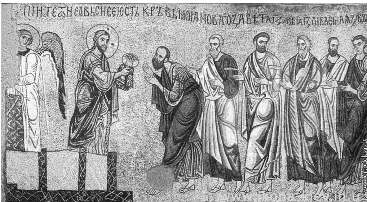
Eucharistija kaip nekruvinoji auka (Šv. Mykolo katedros mozaika)

Tokias aukas aukodavo ir po šiai dienai aukoja visos pagonių tautos ar gentys, kurios yra išlikusios. Baisiausia ne tos kruvinos aukos, bet kad jos būdavo aukojamos ir iš žmonių, ypač naujagimių. Net ir Šventajame Rašte apie tai skaitome.