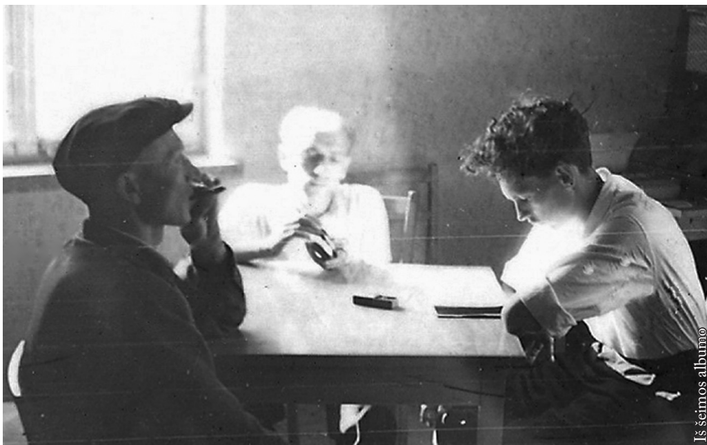
Is šeimos albumo

Ciesų sakanc, kap pro miglas lyg kokias dūmas vercasi da vienas jo pasakojimas apė giarancus vyrus Pūncko kapinėsia, apė jiem pasirodzusias dvasias, velnius, nežmoniškus baladojimus in prie kapinyno kadaisia stovėjusio toaletto duris, alia niekap negaliu jo atkūrc. Žinau, kad jis buvo labai ilgas ir gąsdzinancis. Prismydavau jį kiekvienais metais, kap