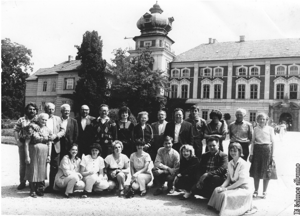
Iš šeimos albumo

1990 m. Žešuve (laimėjus trečiąją vietą Lenkijos mastu už šokius ir ratelius)