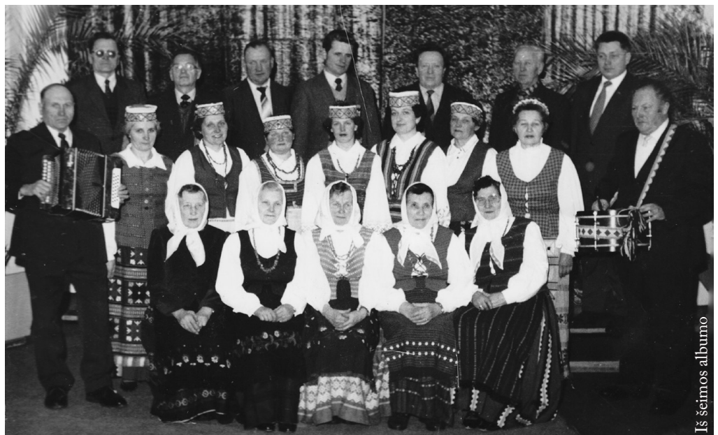
Iš šeimos albumo