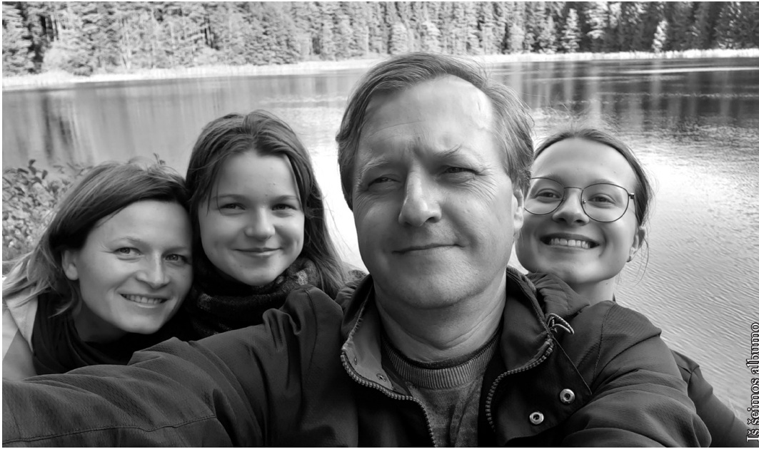
Vygrių parke 2020 m. Paskutinėje nuotraukoje kartu visa šeima...