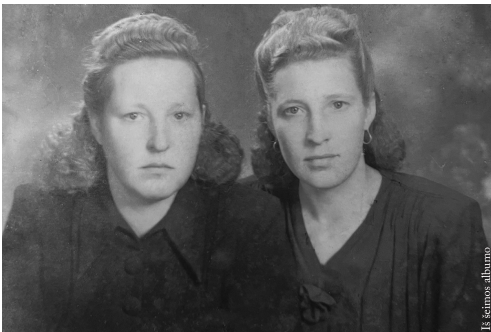
Iš šeimos albumo

„ Daina tapo mano kasdienių vargų, nepriteklių ir rūpesčių paguoda. Dainuodavau, kai būdavo labai liūdna ir skaudėdavo širdį, dainuodavau, kai išaušdavo gražus rytas, kai saulė skaisčiai šviesdavo. Ypač norėjosi dainuoti vasarą, kai saulė nusileisdavo ir pievas apgaubdavo rūkas, kai viskas nutildavo. Tada daina sklisdavo toli. Kitame