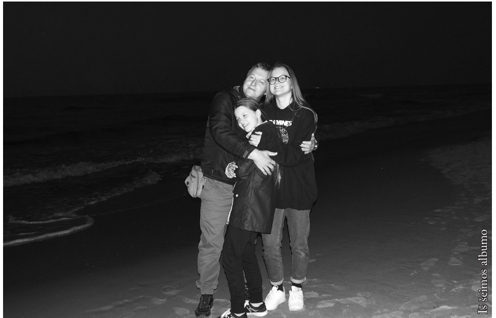
Prie jūros su savo numylėtosiomis dukromis 2017 m.

1995 m. baigęs aukštąjį mokslą, turėjo daug vilčių, kad sugrįš į Punksą ir čia galės dirbti pagal savo specialybę. Deja... 1996 m. jam buvo pasiūlyta tik vadovauti telefonizacijos darbams Punsko valsčiuje, o po to