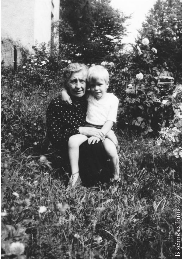
Su anūku Rimu 1990 m.

kaimė dainuojančiam galėjai pritarti“ , – toje pat knygoje apie dainavimą kalbėjusi mama.